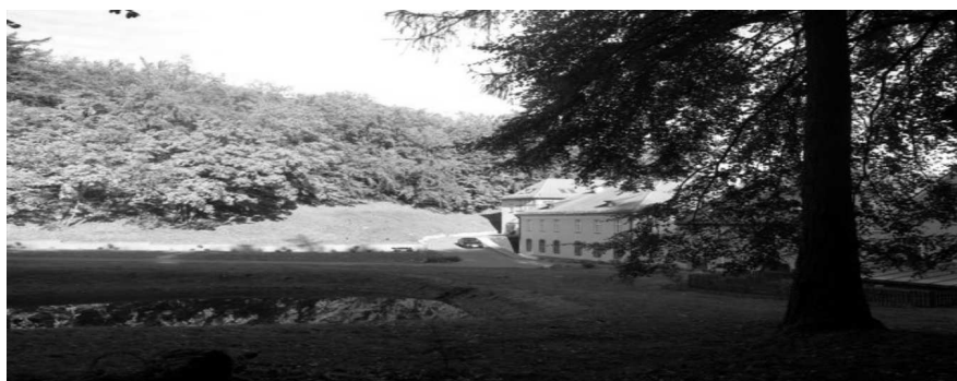
Rys. 1. Stan obecny części zachodniej założenia – ogród zachodni w Dworze II Fig. 1. The current state of the western part of the complex – the western Garden in Court II

Swój wyjątkowy charakter Dwór II zawdzięcza też miejscu, w którym się znajduje. Jest to miejsce bardzo atrakcyjne krajobrazowo, dolina erozyjna, otoczona stromymi zalesionymi stokami, która otwiera się szeroką platformą w kierunku ulicy Polanki, a w dalszej perspektywie w kierunku morza.