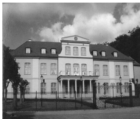
Rys. 3. Elewacja frontowa budynku pałacu w Dworze II po rewaloryzacji

Fig. 2. Reconstruction of Court II following Hans Reichow's remarks from 1923; from: H. Reichow, Historical bourgeois gardening. Depiction of Gdańsk garden life in the 17 th and 18 th centuries , p. 29