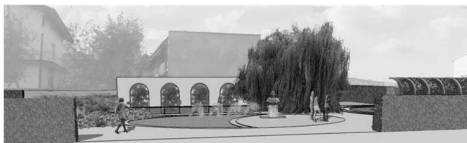
Rys. 5. Koncepcja zagospodarowania placu na osiedlu Adama Mickiewicza w Gdańsku – wizualizacja; proj. Gabriela Kosiedowska; wyk. Grażyna Nowińska; wykonana w 2009 roku przez Usługi Projektowo-Konsultacyjne „Ożywić Miasto” Gabriela Kosiedowska

Zieleń i elementy jej towarzyszące mają za zadanie spajać i jednocześnie wydzielać poszczególne przestrzenie, jakie na placu zostały zaaranżowane. Precyzowanie idei i potrzeb w zakresie zagospodarowania musi odbywać się na poziomie lokalnym tak, aby ludzie czuli się współtwórcami, a nie ofiarami tego miejsca.