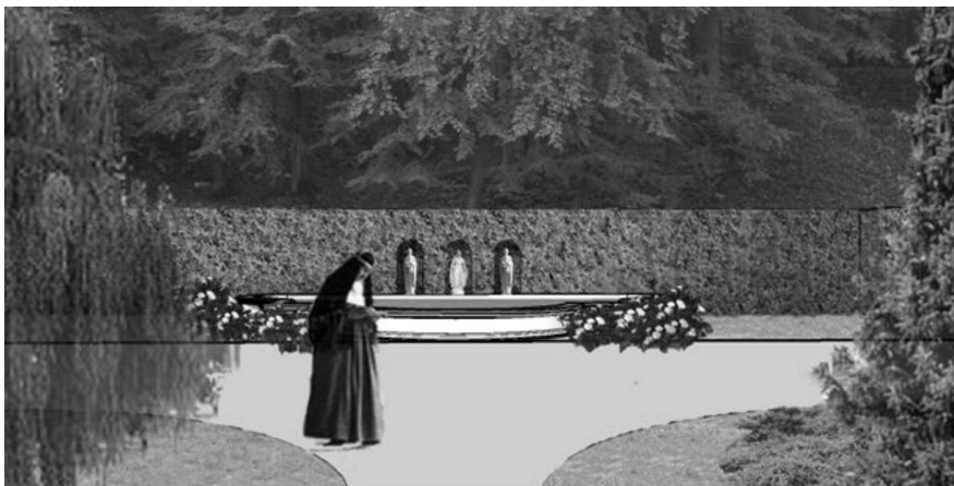
Rys. 4. Wizualizacja projektowanego wnętrza ogrodowego w Dworze II. Projekt Gabriela Kosiedowskiego, wyk. Grażyna Nowińska. Projekt Centrum Ekumeniczne – rewaloryzacja i adaptacja Dworu II w Gdańsku Oliwie przy ul. Polanki 124, BPBK S.A., 2009

Dwór II to miejsce z tajemnicą – mówi to każdy, kto je odwiedza – nosi znamiona tradycji mieszkańców Gdańska. Tradycją tego miejsca jest spotkanie. Tak jak niegdyś patrycjusze gdańscy, tak teraz ludzie różnych religii, intelektualści i wreszcie siostry zgromadzenia św. Brygidy ożywiać będą to miejsce swoją obecnością, wypoczywając, pracując i budując wzajemne relacje. Tak więc powstaje tu przestrzeń symboliczna. Zastosowana symbolika, która wpleciona zostanie w kompozycję ogrodu, wyrażać będzie – jak myślę – wartości uniwersalne, służyć będzie pojednaniu religijnemu i wzmacniać będzie tęsknotę za pięknem rajskiej szczęśliwości.