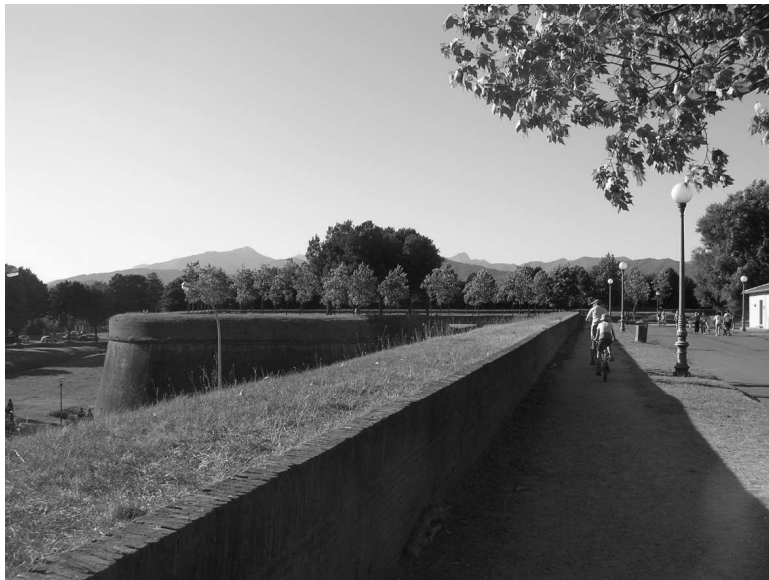
Rys. 5. Nowe nasadzenia w przestrzeniach rekreacyjnych murów w Lucca Fig. 5. New plantings in the areas of recreational walls of Lucca