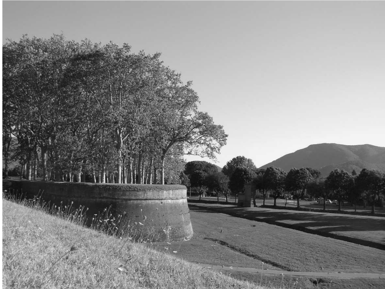
Rys. 4. Widok z poziomu fortyfikacji na esplanade i otaczające szczyty gór Fig. 4. View from the fortification onto esplanade and surrounding mountain tops