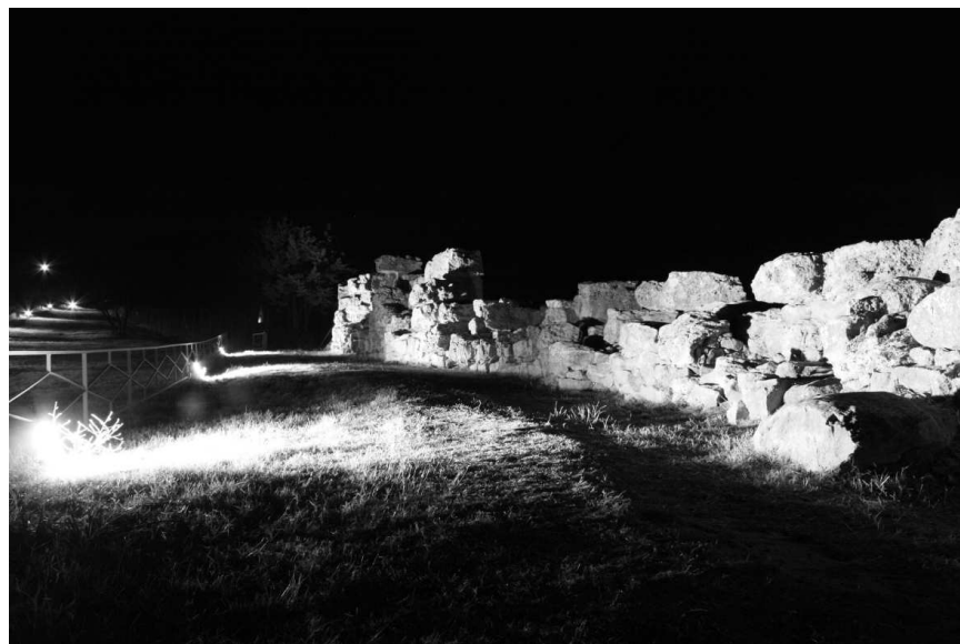
Rys. 3. Iluminacja etruskich murów