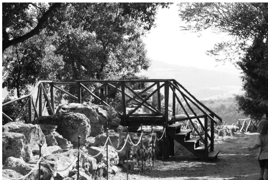
Rys. 2. Mury etruskie w Volterze (fot. K. Hodor, 2008)