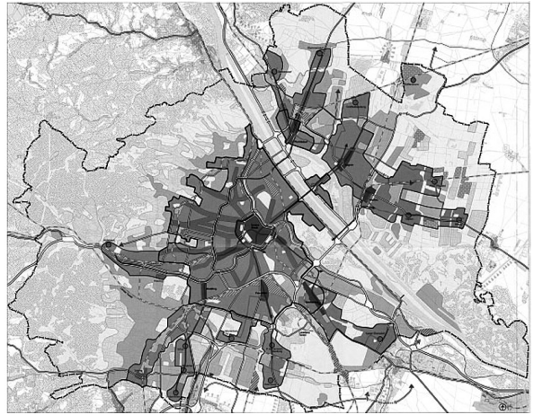
Rys. 2. Planu Rozwoju Miasta STEP 94