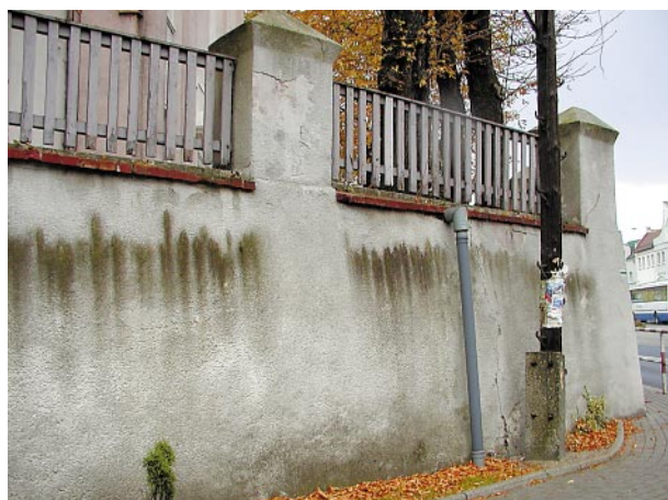
Ryc. 7, 8. Pęknięcia i ślady silnych zawilgoceń muru oporowego okalającego skarpy Fig. 7, 8. Cracks and traces of damp patches on the retaining wall surrounding the escarpment