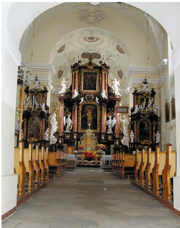
Ryc. 1, 2. Elewacja frontowa oraz wnętrze kościoła Fig. 1, 2. Front elevation and the church interior