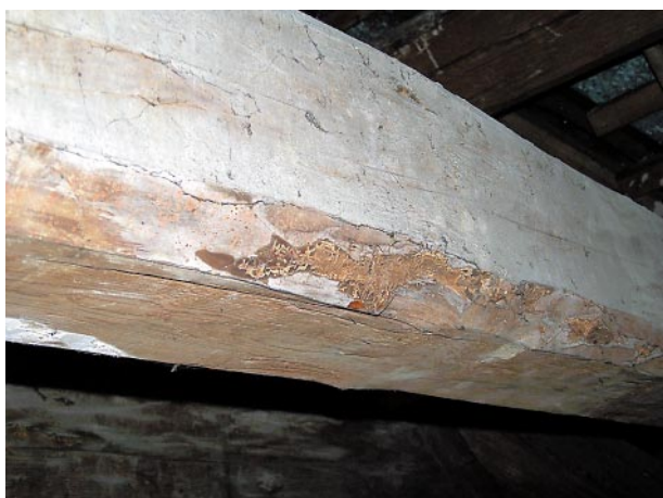
Ryc. 3, 4. Konstrukcja dachu i efekt żerowania owadów – technicznych szkodników drewna na elemencie więźby dachowej Fig. 3, 4. Roof construction and the effects of insects feeding – wood destroying pests on an element of rafter framing