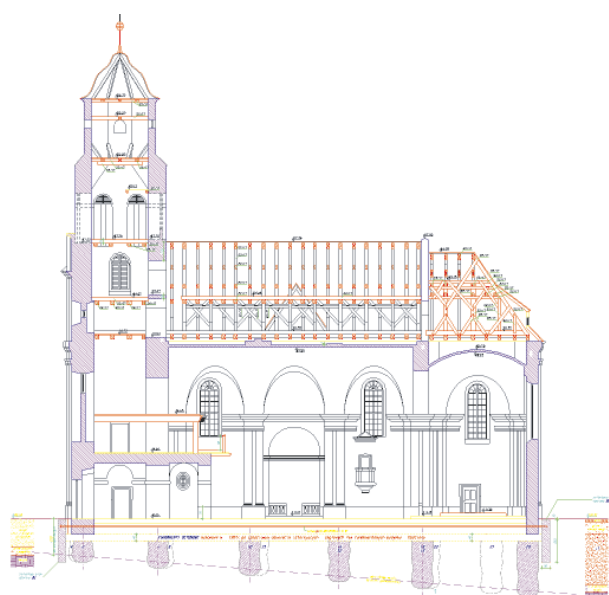
Ryc. 11, 12. Propozycja wzmocnienia skarpy oraz fundamentów kościoła Fig. 11, 12. Proposal of strengthening the escarpment and the church foundations