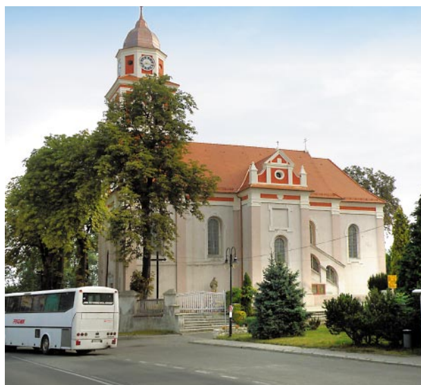
Ryc. 9, 10. Widok kościoła przed oraz po wykonaniu pierwszego etapu prac remontowych i konserwatorskich Fig. 9, 10. View of the church before and after completing the first stage of renovation and conservation work