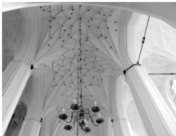
Ryc. 3. Kościół św. św. Piotra i Pawła Fig. 3. St. Peter and St. Paul's Church