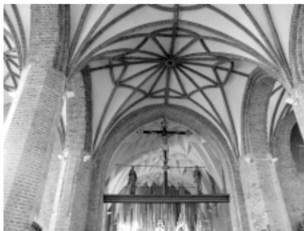
Ryc.5. Kościół św. Brygidy Fig. 5. St. Bridget's Church

Gotyckie sklepienia wznosili muratorzy, którzy umiejętność ich konstruowania doskonalili pod okiem mistrzów cechowych i zobowiązani byli do utrzymywania ścisłej tajemnicy zawodowej. Wraz z nastaniem nowych kierunków w architekturze wygasła potrzeba ich wznoszenia i zasady konstrukcji tych sklepień uległy zapomnieniu. B. Ranisch prawdopodobnie z przekazów rodzinnych