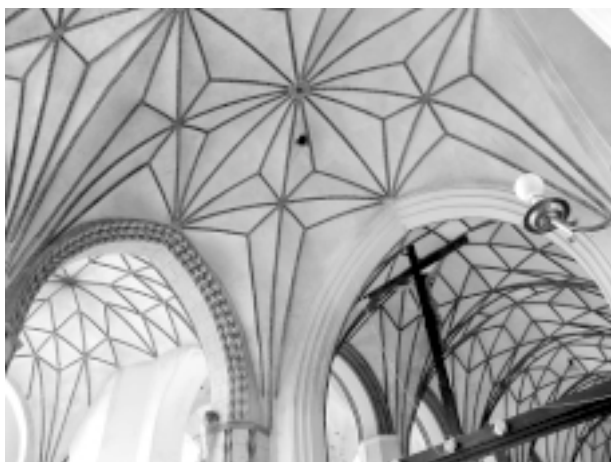
Ryc.4. Kościół św. Katarzyny Fig. 4. St. Katherine's Church