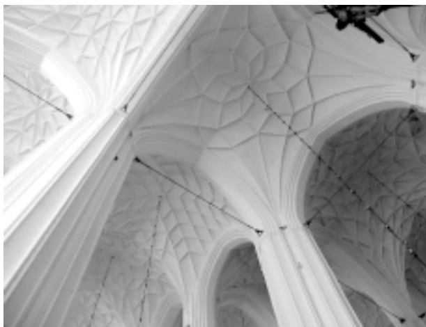
Ryc. 2. Kościół Mariacki Fig. 2. St. Mary's Church