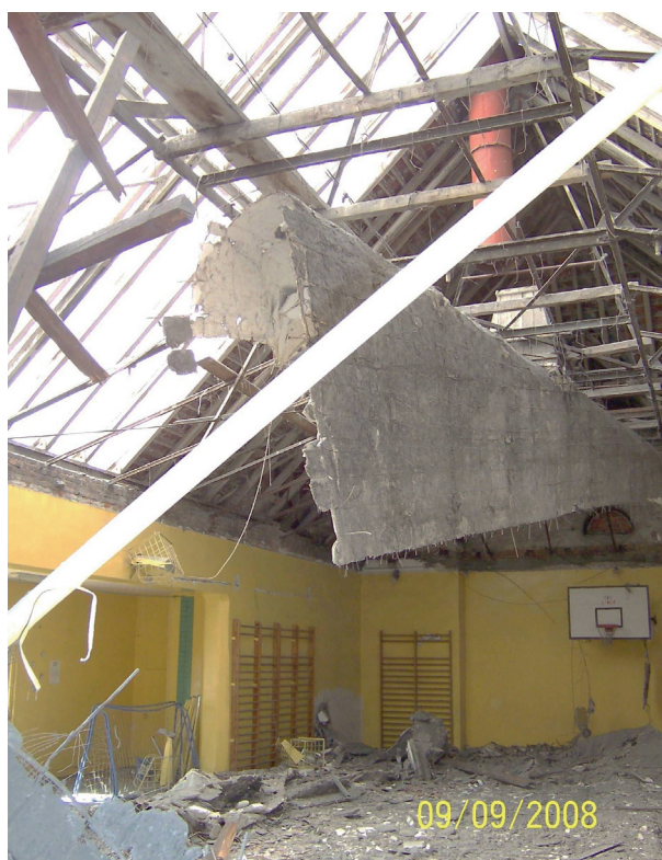
Rys. 3. Widok sufitu sali gimnastycznej przed katastrofą Fig. 3. View of the gymnasium's ceiling before the catastrophe