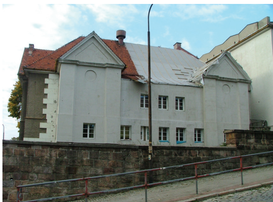
Rys. 1. Widok prawego skrzydła budynku szkoły Fig. 1. View of the right wing of the school building