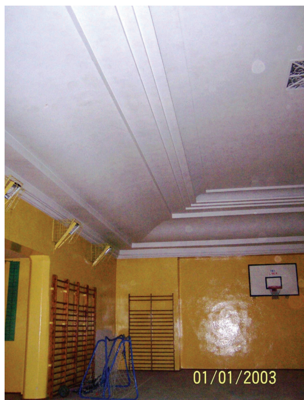
Rys. 4. Widok sufitu sali gimnastycznej po katastrofie Fig. 4. View of the gymnasium's ceiling after the catastrophe

dzięki siatce z prętów jego spore płyty. Stan ten zilustrowano na rys. 4.