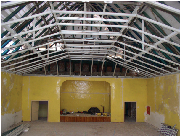
Rys. 7. Widok ogólny konstrukcji nośnej nowego sufitu