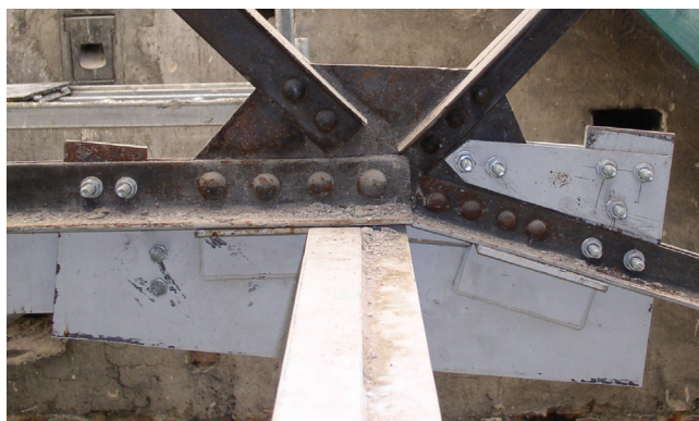
Rys. 6. Widok wzmocnionego węzła pasa dolnego wiązara trapezoidalnego Fig. 6. View of the strengthened node at the bottom chord in the trapezoidal truss

At the stage of establishing the technology of fire protection with swelling paints, there occurred a problem with two-branch rods, for which the coefficients of massiveness