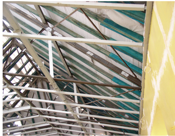
Rys. 8. Zbliżenie na konstrukcję nośną sufitu podwieszono (opis w tekście)