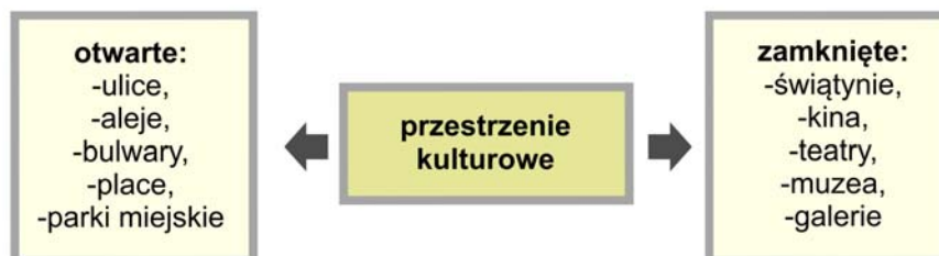
II. .2. Schemat ilustrujący podział przestrzeni kulturowych na otwarte i zamknięte (oprac. D. Pazder)

III. 1. The ideogram illustrates the relationship between downtown cultural and public space