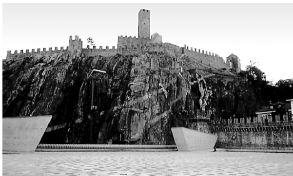
Ryc. 4. Bellinzona – plac Del Sole z parkingiem pod spodem u podnóża zamku Castelgrande Fig. 4. Bellinzona – Piazza Del Sole with the underground parking lot at the foot of Castelgrande castle