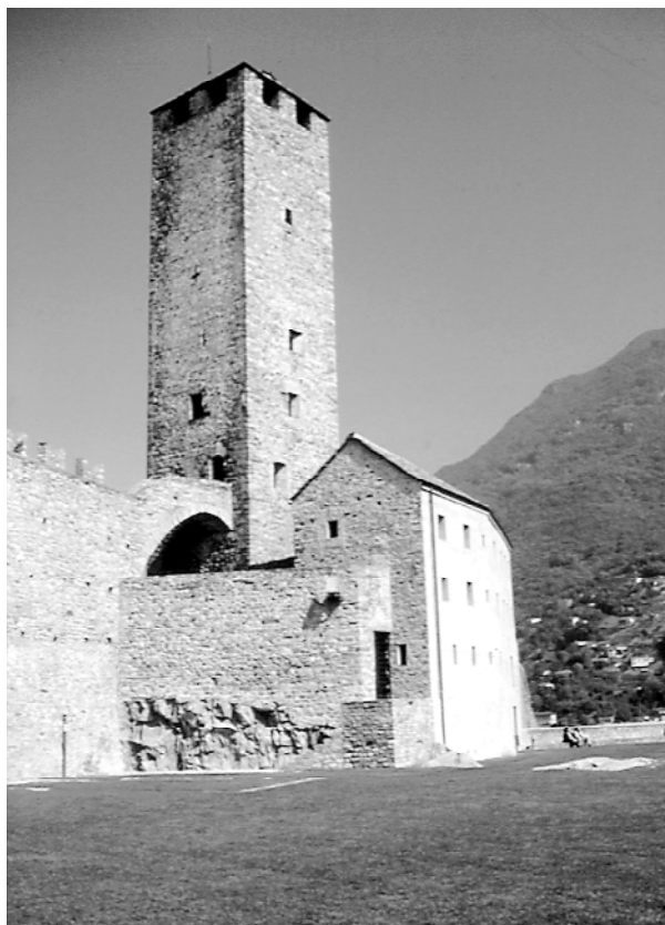
Ryc. 5. Bellinzona – historyczna wieża kamienna i nowa kubatura na dziedzińcu zamku Fig. 5. Bellinzona – historic stone tower and new volume in the castle courtyard