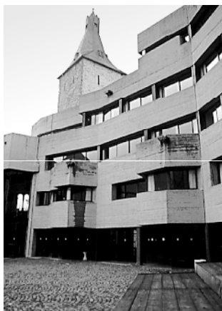
Ryc. 1. Bensberg – nowa wieża z betonu w średniowiecznej warowni adaptowanej na ratusz Fig. 1. Bensberg – new concrete tower in the medieval stronghold converted into a town hall