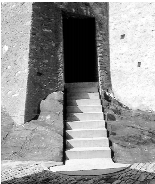
Ryc. 3. Bellinzona – detal odwodnienia nowych schodów prowadzących do winiarni zamkowej na stoku wzgórza zamku Castelgrande Fig. 3. Bellinzona – drainage detail of the new stairs leading to the castle winery on the slope of Castelgrande castle hill