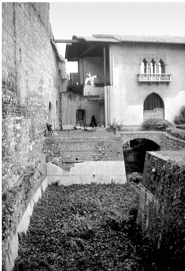
Ryc. 6. Dziedzińiec zamku Castelvecchio w Weronie Fig. 6. The courtyard of Castelvecchio castle in Verona