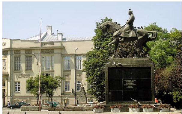
Ryc. 2 i 3. Plac Litewski w Lublinie, widok od strony pld.-wsch. Na pierwszym planie Pomnik Marszałka Piłsudskiego, w tle Pomnik Nieznanego Żołnierza i Pomnik Konstytucji 3 Maja.

Fig. 2. and 3. The Lithuanian Square in Lublin, view from south – east. In the foreground monument of Marshal Piłsudski, in the background the Unknown Soldier monument and the 3 rd of May Constitution monument.