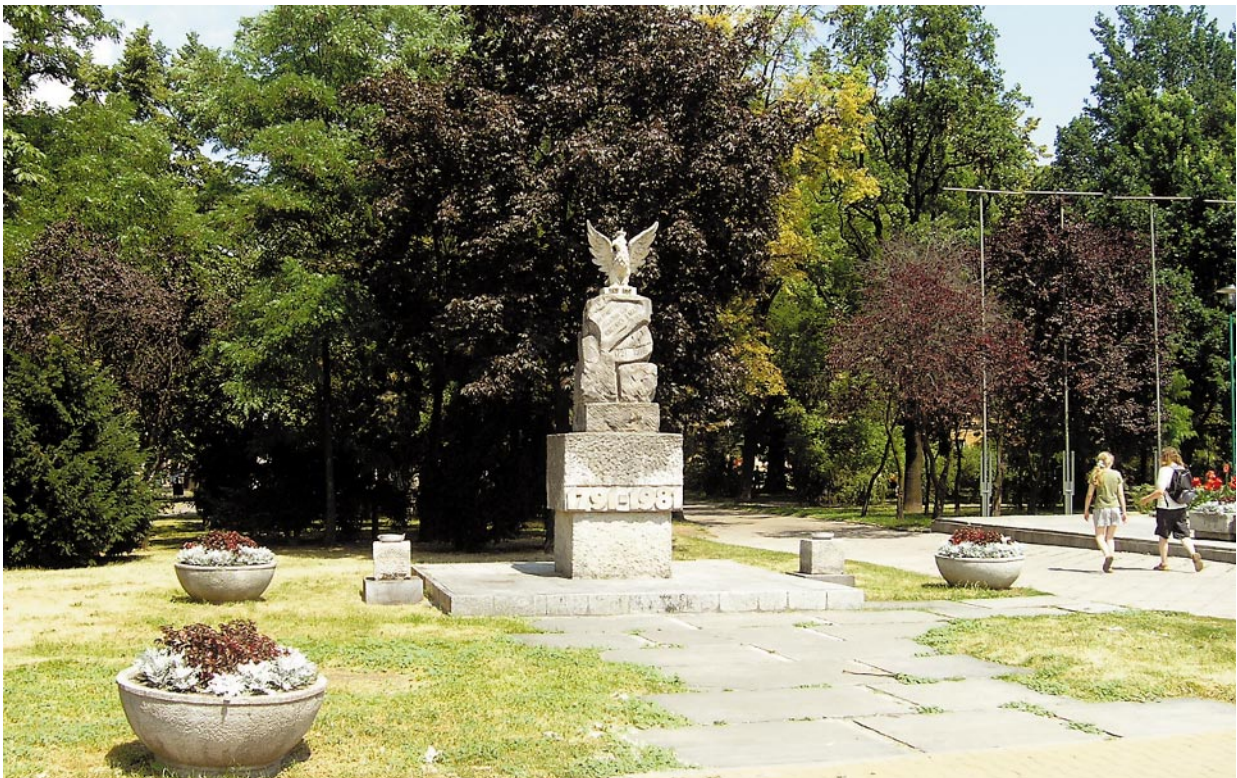
Ryc. 4. Plac Litewski w Lublinie. Pomnik Konstytucji 3 Maja. Fot. z archiwum WKZ Lublin, 2006

Fig. 2. and 3. The Lithuanian Square in Lublin, view from south – east. In the foreground monument of Marshal Piłsudski, in the background the Unknown Soldier monument and the 3 rd of May Constitution monument. Photo: archives of WKZ Lublin, 2006