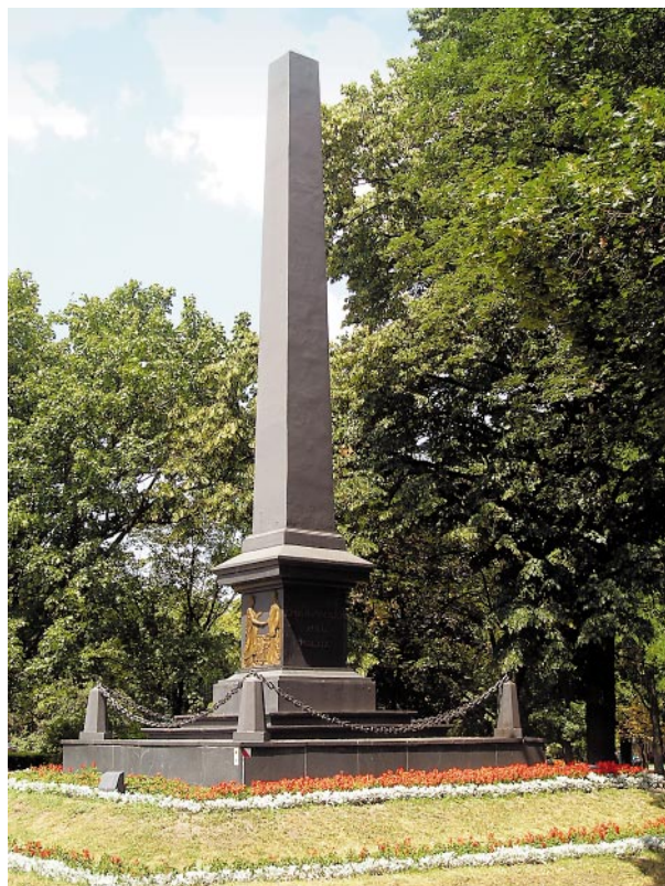
Ryc. 5. Plac Litewski w Lublinie. Pomnik Unii Lubelskiej. Fig. 5. The Lithuanian Square in Lublin. Monument of the Lublin Union.

Nie ustały także problemy związane z brakiem koncepcji użytkowania Placu Litewskiego. Pomimo usytuowania na nim najważniejszych czterech pomników o najwyższym wymiarze symboli patriotycznych i narodowych obszar placu nie jest traktowany jak „panteon” – nawet w bezpośredniej strefie „pomnikowej”. Organizowane są imprezy rozrywkowe: spotkania sylwestrowe, imprezy dla dzieci, pokazy, wystawy o dyskusyjnej treści. Do historii przeszły pokazy rekinów z Florydy zaaranżowane w ustawionych na placu TIR-ach-basenach latem 2004 roku, za aprobatą władz miasta proponowano – wzorem paryskich bulwarów nad Sekwaną – urządzenie plaży, zaś w grudniu 2005 roku, pomiędzy Pomnikiem Marszałka Piłsudskiego i pomnikiem Unii Lubelskiej z pieniędzy samorządu miasta zamontowano sztuczną płytę lodowiska wraz z urządzeniami chłodniczymi, zapleczem, ogrodzeniem. Na środku placu, niemal u stóp pomnika Marszałka ustawiono na okres kilku miesięcy przenośne toalety – TOI-TOI, które przyciągały zdziwiony wzrok turystów