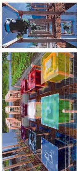
"The film Laboratory" prof. Paul Cooper z Festiwalu International de Jardins, 2009 Coronata organizowane w ramach Dni Muzeów w Warszawie. Są to imprezy artystyczne i edukacyjne - Festiwal International de Jardins stanowiła odpowiednią okazję do interdyscyplinarnych wypraw i umiędzynarodowienia praktyczności. Tworzone instalacje są czasowe i trudno ich zmierzyć i liczyć niż niższą sztukę.