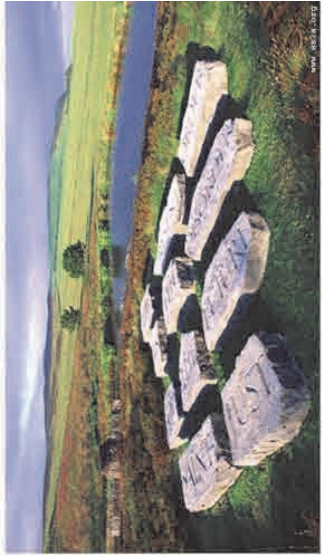
"Little Sparta" prof. Ian Hamilton Finlay - sokołki, sadziszki i ogródki: i. konstatacja literackich, filozoficznych, a nawet politycznych, umiędzynarodowienia przyrody.