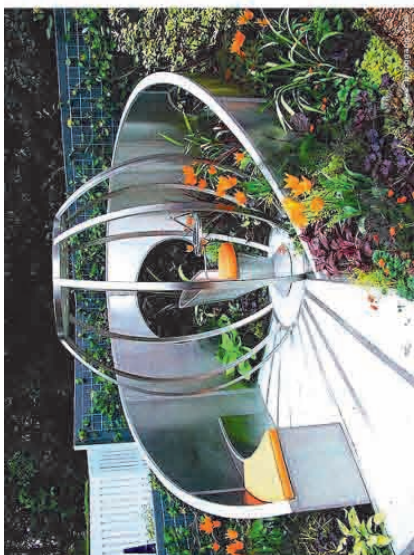
"Wiosna 2014 roku (zdjęcie 02061) 2014, Dwa fasony pod listem Taylor F20/441 140 wygrał pokaz Chelsea Flower Show w 2015 roku. Fundacja stowarzyszenia przyjaciół roślin.

"Chciałabym zajmować się sztuką o dużej skali, i dlatego zaczęłam studiować architekturę krajobrazu" Martha Schwartz, architekt krajobrazu