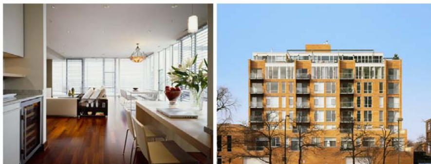
Ryc. 6, 7. Budynek wielorodzinny w Evanstone, USA Fig. 6, 7. Multifamily house in Evanstone, USA

Zastosowanie szklanych, prześwitujących ścian, przejrzystych i transparentnych zaskakuje mieszkańców (ryc. 6, 7, 8, 9) nowo projektowanych przestrzeni mieszkalnych. Zmusza do zmiany dotychczasowych przyzwyczajeń i upodobań do wnętrz o pełnych ścianach.