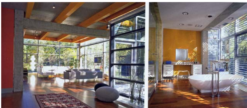
Ryc. 8, 9. Prosta paleta materiałów, światło i powietrze tworzą przestrzeń wnętrza Fig. 8, 9. The simple palette of materials with light and air make generous interior space

Filozofia uczestnictwa w tym programie mieszkaniowym stała się marką handlową o niekwestionowanym sukcesie finansowym na trudnym chicagowskim rynku deweloperskim.