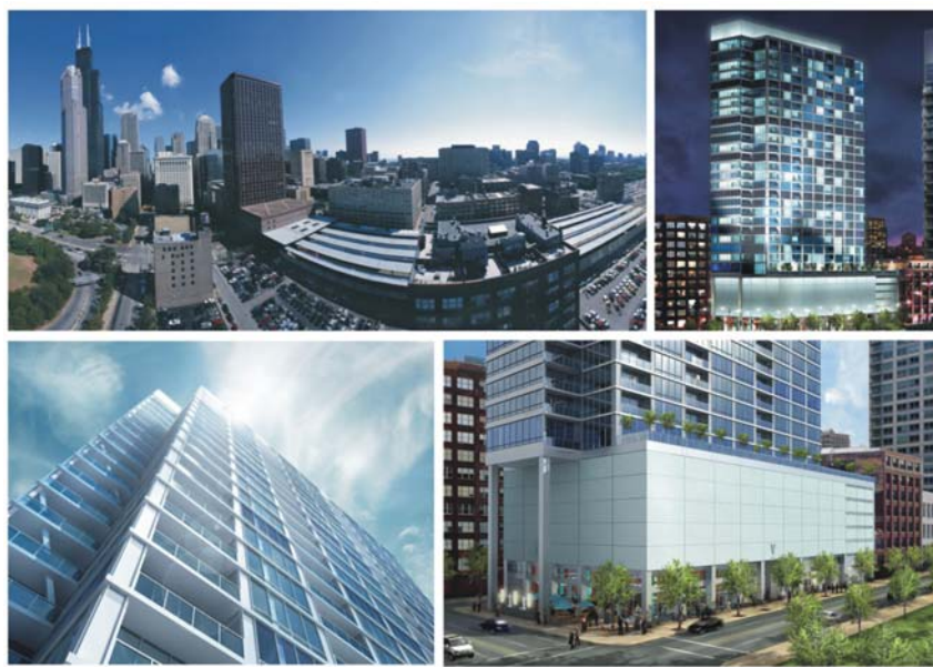
Ryc. 2, 3, 4, 5. Budynek wielofunkcyjny/mieszkalny – wielorodzinny w Chicago Fig. 2, 3, 4, 5. Mixed-use and multifamily building in Chicago

-architektów w celu dopasowania nowatorsko kreowanych przestrzeni do utartych stereotypów, związanych z indywidualnością i prywatnością.