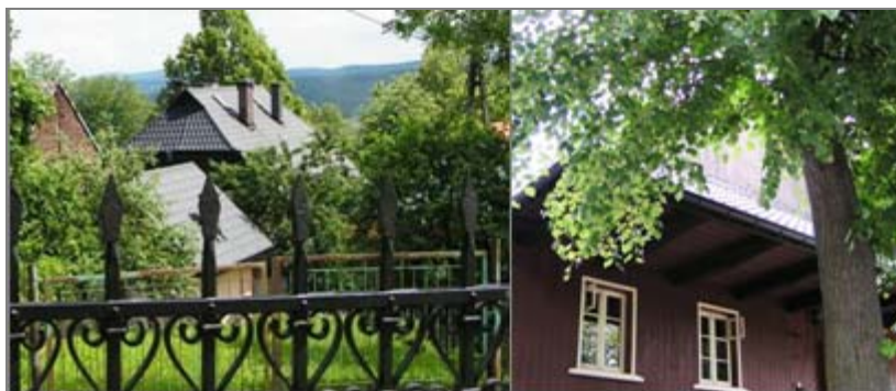
Ryc. 3. Przyrynkowy dom lanckoroński po remoncie. Fot. A. Mitkowska, 2007

Fig. 3. House at market-place after renovation. Photo A. Mitkowska, 2007