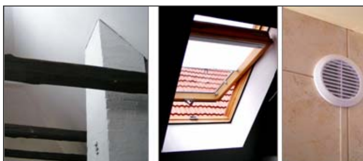
Ryc. 5. Szczegóły techniczne domu przyrynkowego w Lanckoronie (poddasze, strych).

Fig. 4. Details of house interiors, in Lanckorona market-place.