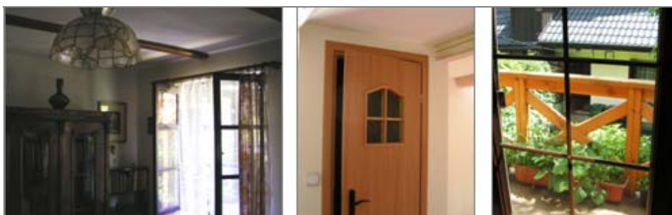
Ryc. 4. Detale wykończenia domu przyrynkowego w Lanckoronie. Fot. A. Mitkowska, 2007

Fig. 3. House at market-place after renovation. Photo A. Mitkowska, 2007