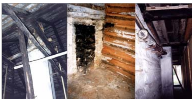
Ryc. 2. Wnętrze domu przed remontem (Lanckorona, rynek).

fundamentowania, źle wykonane instalacje kominowe, brak wentylacji pomieszczeń sanitarnych i gospodarczych – uniemożliwiają prowadzenie na bieżąco robót wykończeniowych podnoszących standard mieszkania. Zastąpienie tradycyjnego krycia gontem przez dachówkę cementową lub eternit powoduje przeciążenia konstrukcji w pierwszym przypadku, w drugim zagrożenie zdrowia mieszkańców. Brak rynien i rur spustowych lub ich zniszczenie pogłębiają dewastację substancji budynku przez permanentną penetrację wód opadowych. Klepiska pozostające jako dawny sposób urządzenia podłóg w pomieszczeniach uniemożliwiają mieszkanie w obiekcie.