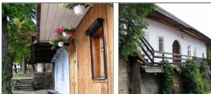
Ryc. 1. Tradycyjne domy lanckorońskie. Fot. A. Mitkowska, 2006

Miasteczko Lanckorona, położone ok. 40 km na południowy zachód od Krakowa, w pobliżu trasy komunikacyjnej do Wadowic, sięgające tradycjami osadniczymi co najmniej XIII w., lokowane na prawie magdeburskim w XIV w., obecnie jest administracyjnie wsią i siedzibą gminy. Pomimo wielokrotnego niszczenia jego substancji architektonicznej, do dziś zachowało charakter tradycyjnej architektury, odznaczającej się wyrazistością formalną, tak daleko idącą, że możemy mówić o „stylu lanckorońskim”. Wybitne walory oryginalnego lanckorońskiego stylu architektonicznego dostrzegli i sławili m.in. Jan Matejko i Stanisław Wyspiański.