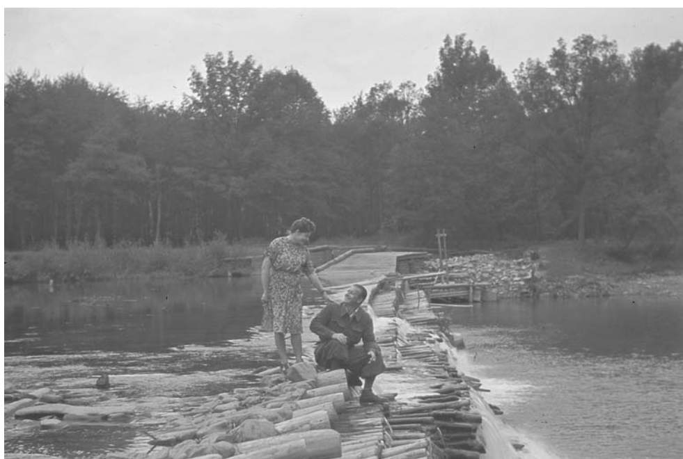
Ryc. 2. Zarabie w Myślenicach od lat pozostaje tradycyjnym miejscem wypoczynku letniego

Nabrzeża Raby w Myślenicach, Dobczycach, Gdowie, większe skupiska leśne, niewielkie wzniesienia, wyrobiska, glinianki, żwirownie, użytkowane sezonowo, od lat były miejscami wypoczynku.