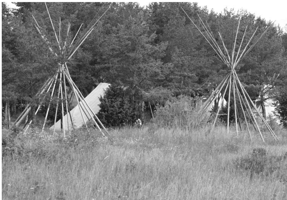
Ryc. 3. Alvkerleby – przykład sezonowego wypoczynku dla ludności metropolii sztokholmskiej – konstrukcja wigwamów wioski indiańskiej wykorzystywana w czasie pikników „tematycznych”

Sztokholmu sprzyjają spędzaniu czasu nad wodą. Rozlewiska wielkich jezior (takich jak Melar) i morze według prawa użyteczności publicznej udostępnione są dla wędkarzy za darmo. Także zwyczaj biwakowania na obszarach zielonych poza kempingami (w Szwecji obowiązuje „stare prawo”, wchodzące w skład prawa użyteczności publicznej, pozwalające na użytkowanie gruntu czasowo pod warunkiem pozostawienia terenu w zastanym stanie) jest zachętą do wypoczynku sezonowego i dbania o środowisko naturalne. Na przykładzie miejscowości Alvkerleby, położonej w sąsiedztwie miasta Sodertajle na południowy wschód od Sztokholmu, można prześledzić sezonowe aktywności w ramach rekreacji na terenach atrakcyjnych przyrodniczo. Miejsce to jest jednym z wielu, gdzie mieszkańcy metropolii sztokholmskiej mogą wypoczywać zarówno po godzinach pracy, jak i w weekendy. Nabrzeża rzeki płynącej przez Alvkerleby są oblegane okresowo przez wędkarzy, łąki nad brzegami przez rodziny korzystające z kąpeli wodnych i słonecznych. Jesienią organizowane są tu pikniki. Zimą trasy rowerowe zamieniają się w trasy narciarskie i biegowe.