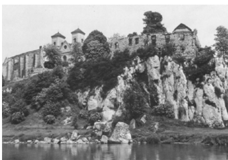
Ryc. 2. Opactwo Benedyktynów w Tyńcu – rezerwat kulturowy (widok od strony Wisły)

Dziedzictwo kulturowe zespołu zabudowań Opactwa Benedyktynów w Tyńcu posiada walor unikalny, przede wszystkim ze względu na istniejącą możliwość ochrony, a więc zachowania tego dziedzictwa i przekazania go przyszłości nie tylko w postaci struktury budowli, ale także jej otoczenia nasyconego śladami niezwyklej tysiącletniej przeszłości.