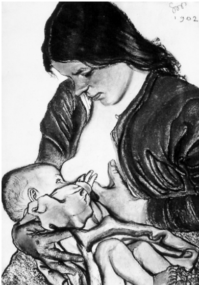
Pastel „Macierzyństwo” Wyspiańskiego z 1902 r. Pierwowzór dla płaskorzeźby wykonanej z plasteliny