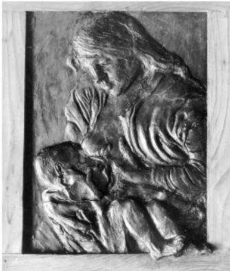
Zniszczona płaskorzeźba – stan przed konserwacją