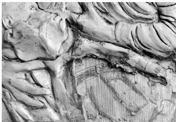
Szkicowy rysunek wykonany ołówkiem na desce podkładowej przez St. Wyspiańskiego