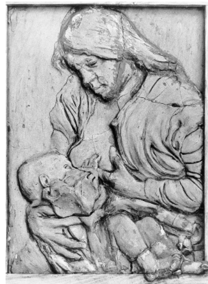
Po usunięciu lakieru ujawniły się liczne spękania, deformacje i wadliwe późniejsze uzupełnienia uszkodzonej wcześniej płaskorzeźby