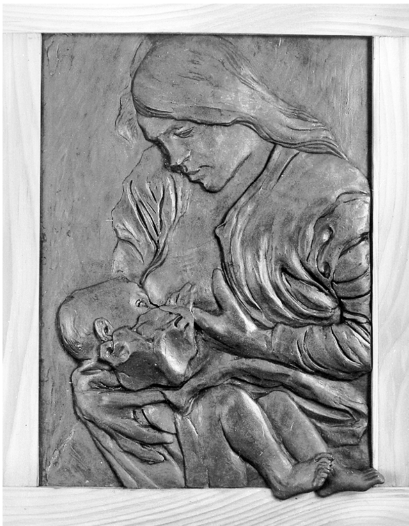
Plaskorzeźba po zabiegach konserwatorskich