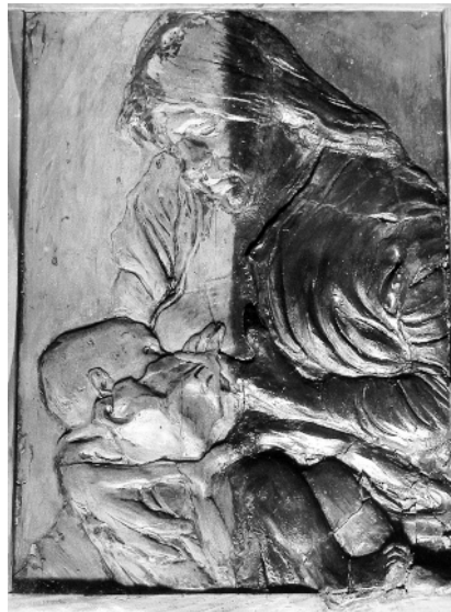
Usunięty z połowy płaskorzeźby niefachowo położony bezbarwny lakier