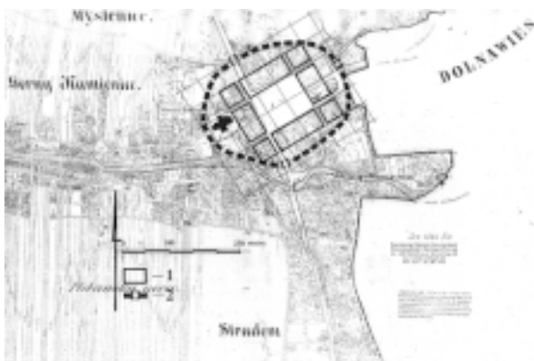
Myślenice. Analiza metrologiczna układu miasta lokacyjnego. Oprac. Autora. Legenda: 1 – bloki zabudowy mieszkalnej, 2 – hipotetyczny przebieg narysu umocnień obronnych miasta