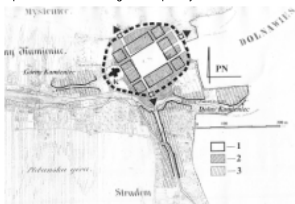
Myślenice. Rekonstrukcja układu przestrzennego miasta z końca XV wieku i początków wieku XVI. Oprac. Autora. Legenda: 1 – bloki lokacyjne, 2 – obszar miasta lokacyjnego zasiedlony w granicach jego umocnień obronnych, 3 – przedmieścia, K – kościół farny