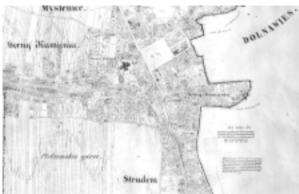
Myślenice. Fragment planu katastralnego miasta z połowy XIX wieku. Oryginał w zbiorach Powiatowego Ośrodka Dokumentacji Geodezyjnej i Kartograficznej w Myślenicach

Miasto otrzymało prosty układ urbanistyczny będący odmianą typu dziewięciopolowego. Skła- dał się on z 9 umiarowych bloków. Największy