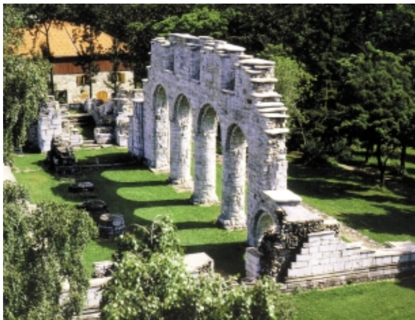
8. Widok na ruiny katedry w Hamar przed interwencją projektową (fot. Jan Hag, 1985)