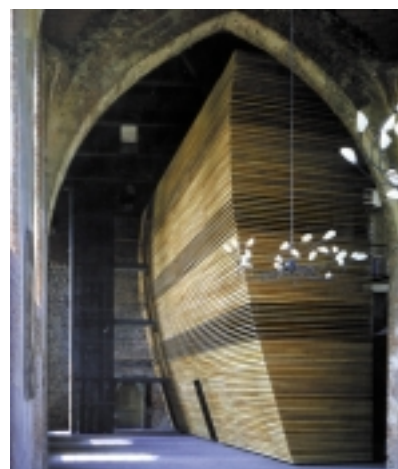
7. Widok na wnętrze kościoła St. Mary w Munchenberg po interwencji projektowej