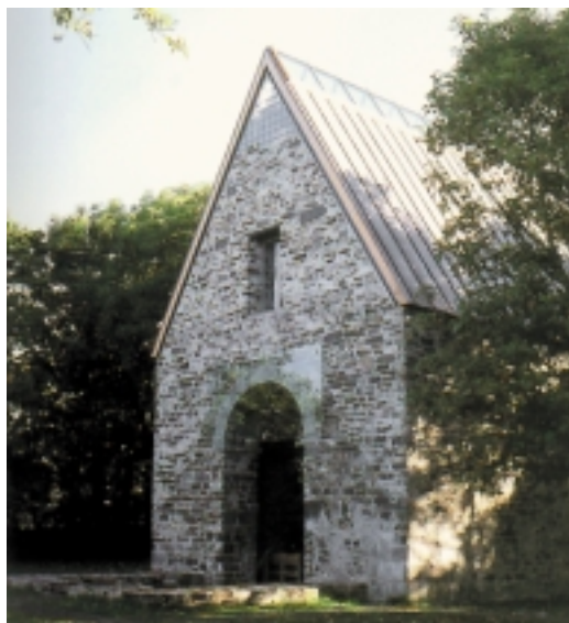
2. Widok na elewację frontową kościoła w Sola po interwencji projektowej