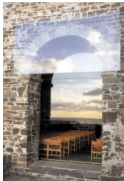
3. Widok na przeszklony portal kościoła w Sola po interwencji projektowej