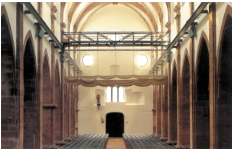
5. Wnętrze kościoła St. Maximin w Trier po interwencji projektowej (fot. Trapp, Oberdorf & Peitz)