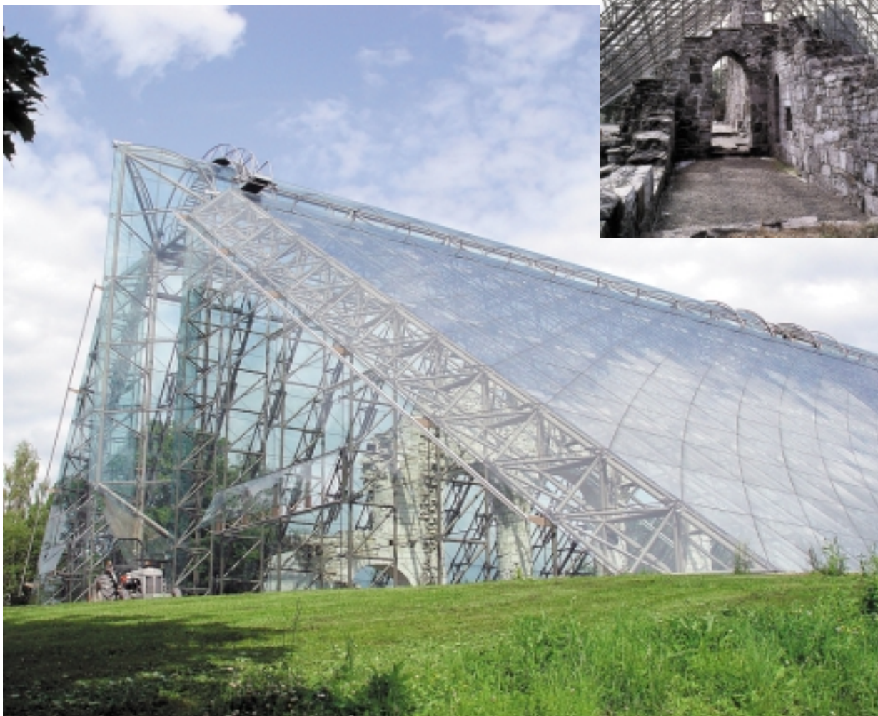
9. Widok na szklaną strukturę ochronną nad ruinami katedry w Hamar