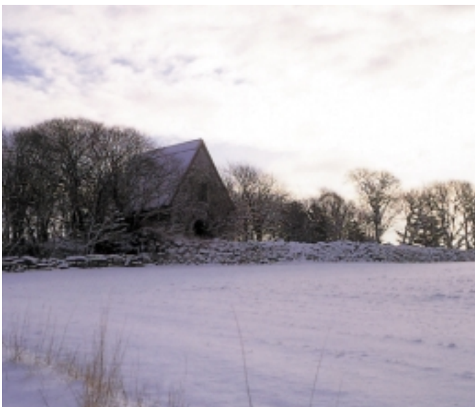
1. Widok na kościół w Sola