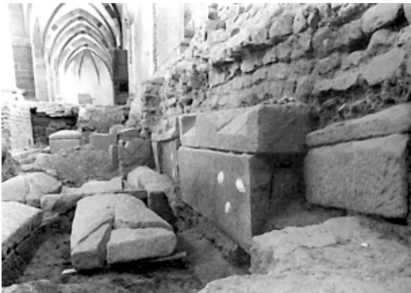
4. Wnętrze kościoła St. Maximin w Trier przed interwencją projektową