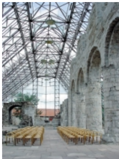
10. Widok na wnętrze katedry w Hamar po interwencji projektowej