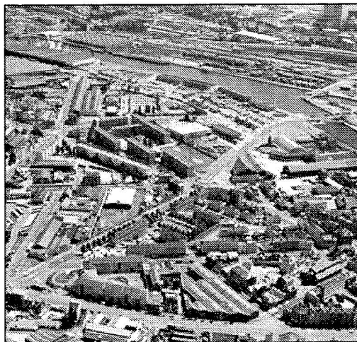
Ryc. 3. Doki w Hawrze we Francji charakteryzowało bezrobocie oraz opuszczenie (pustostany). Projekt „Piękno drewna” zakładał wykorzystanie tego miejsca jako terenu, na którym ma się odbywać rewaloryzacja mebli, likwidował częściowo bezrobocie, chronił środowisko oraz pozwalał sprzedawać usługi przy dość niskich kosztach.

Przyciągnięcie wysoko wykwalifikowanej siły roboczej ma duże znaczenie, co obejmuje przyjęcie środków związanych z dostępnością, wysokim poziomem edukacji, dostarczaniem usług w dziedzinie kultury oraz stwarzaniem możliwości rozwoju w zakresie badań i rozwoju technologicznego oraz innowacji.