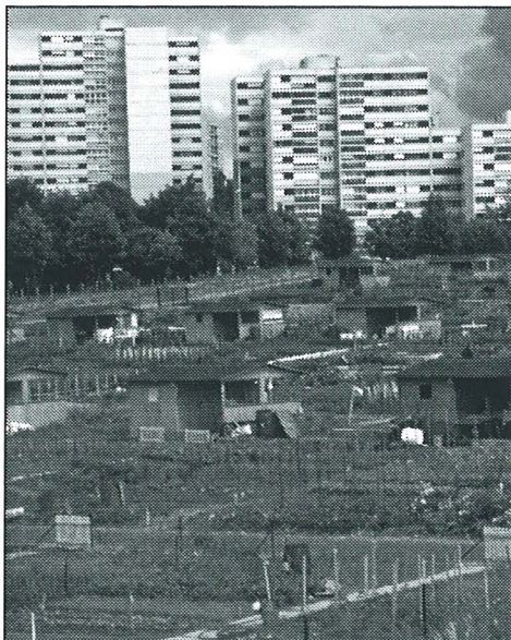
Ryc. 1. Alzacja, Francja. Socjalna i środowiskowa regeneracja – lokalnym mieszkańcom dano ogródki działkowe.