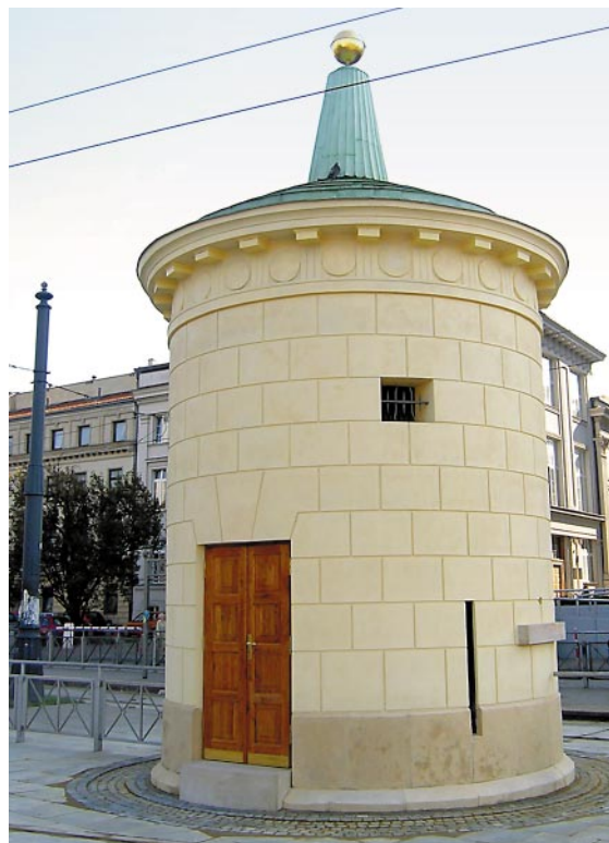
Zabytkowy budynek wodobioru „Gruba Kaśka” po pracach konserwatorskich. Warszawa – IX 2004 r.