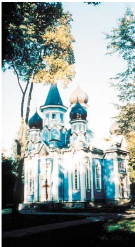
Kolorystyka obiektu zabytkowego utrzymująca tradycję lokalną