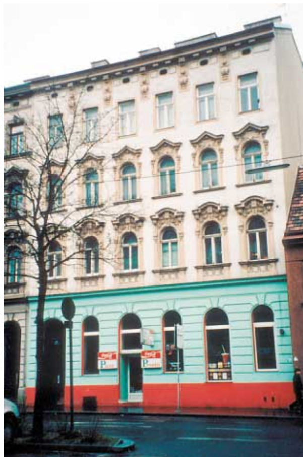
Fragmentaryczne pomalowanie zabytkowej etewacji farbami niewapiennymi