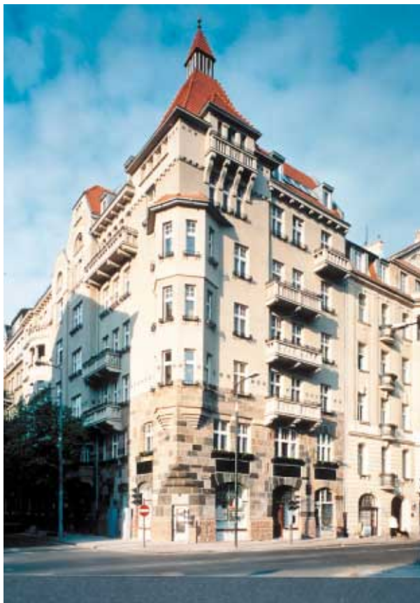
„Naturala” kolorystyka elewacji po wykonanym współcześnie remoncie konserwatorskim, z zachowaniem tradycyjnej technologii