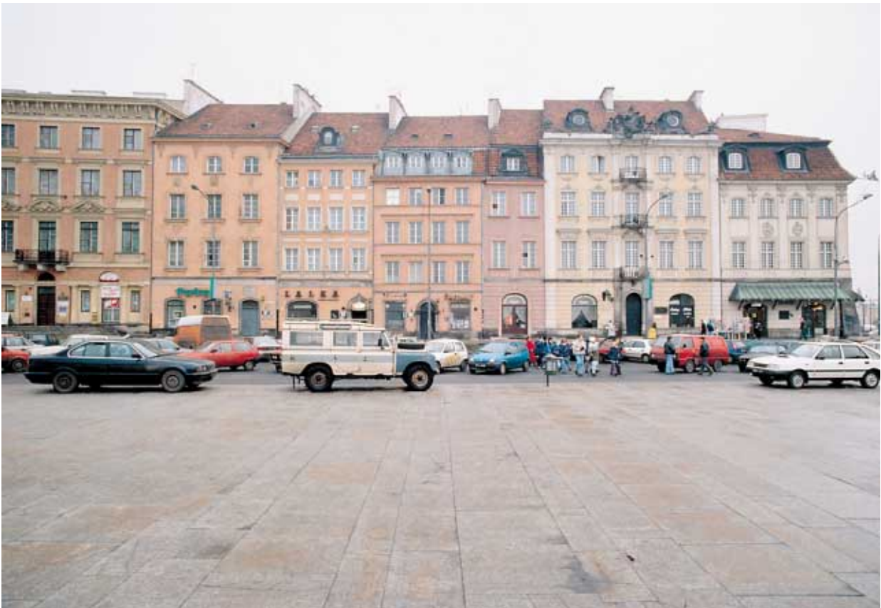
Fragment historycznej pierzei po remoncie konserwatorskim wg projektu wykorzystującego wzornik Schmidta

Na dobór kolorów w przeszłości miało także wpływ oświetlenie, w jakim je oglądano. Światło