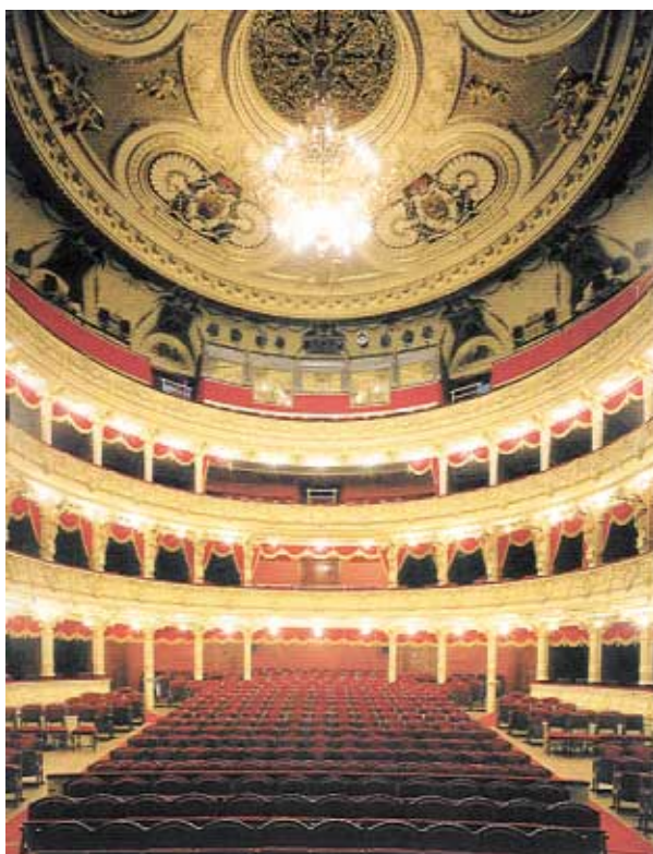
Teatr Słowackiego w Krakowie, audytorium po pracach konserwatorskich