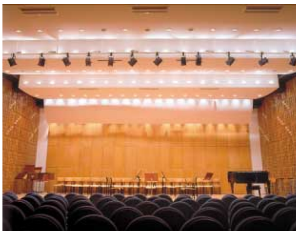
Akademia Muzyczna w Krakowie, sala koncertowa