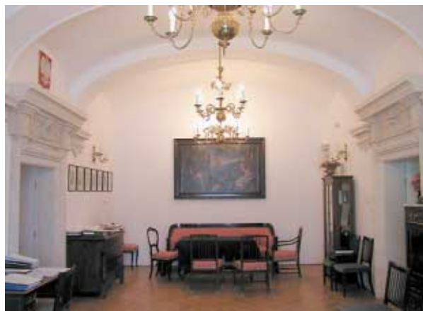
WAPK (d. Pałac Królewski w Łobzowie) dawna sień restauracji