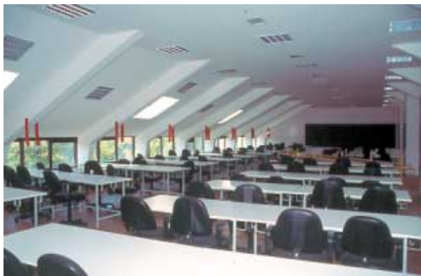
WAPK (d. Pałac Królewski w Łobzowie) adaptacja poddasza