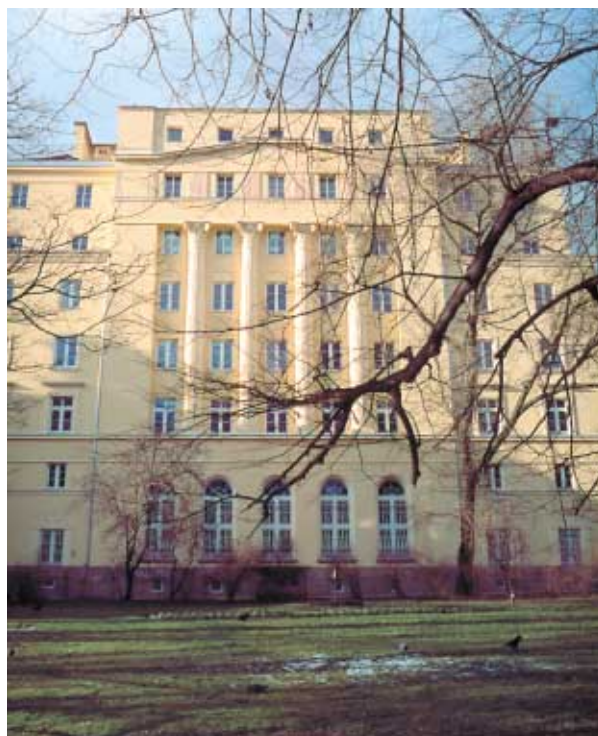
Akademia Muzyczna w Krakowie, elewacja wschodnia po renowacji