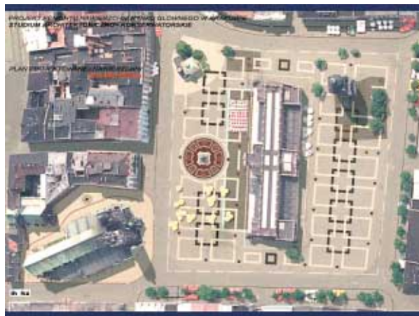
Rynek Główny w Krakowie, plansza kompozycyjna na powierzchni