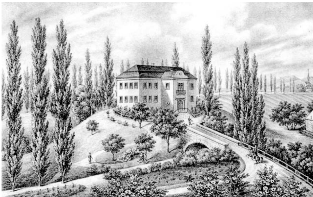
Rys. 3. Dwór w Graboszycach, „Lwowianin”, 1842

Majątek graboszycki został rozparcelowany w 1945 roku w wyniku reformy rolnej. W 1949 roku resztówka dworska została przejęta przez Nadleśnictwo Państwowe Andrychów od wadowickiego Starostwa Powiatowego. W następnym roku kasztel z otaczającym go parkiem przeszedł we władanie Gromadzkiej Rady Narodowej w Za-