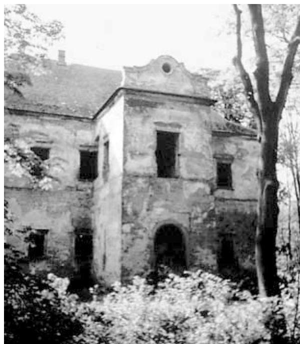
Rys. 5. Widok obecny dworu od frontu, fot. autorka, 2003

Żyjemy w czasach gospodarki wolnorynkowej. Dwór w Graboszycach przejęty od upadającej Fabryki Samochodów Małolitrażowych w Tychach przez Agencję Własności Rolnej został w ciągu trzech lat czterokrotnie sprzedany i odkupiony, za każdym razem ma się rozumieć za wyższą cenę. Obecny właściciel dysponuje odpowiednim kapitałem i myśli w kategoriach biznesu. Obiecuje, że przywróci Graboszycom dawną świetność, nie obciąży ich kredytem hipotecznym, nie pozwoli na dalszą degradację, by pozyskać atrakcyjną działkę.