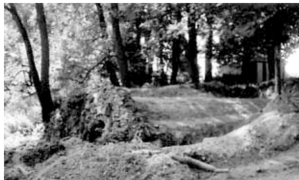
Rys. 6. Fragment założenia ogrodowego, fot. autorka, 2003