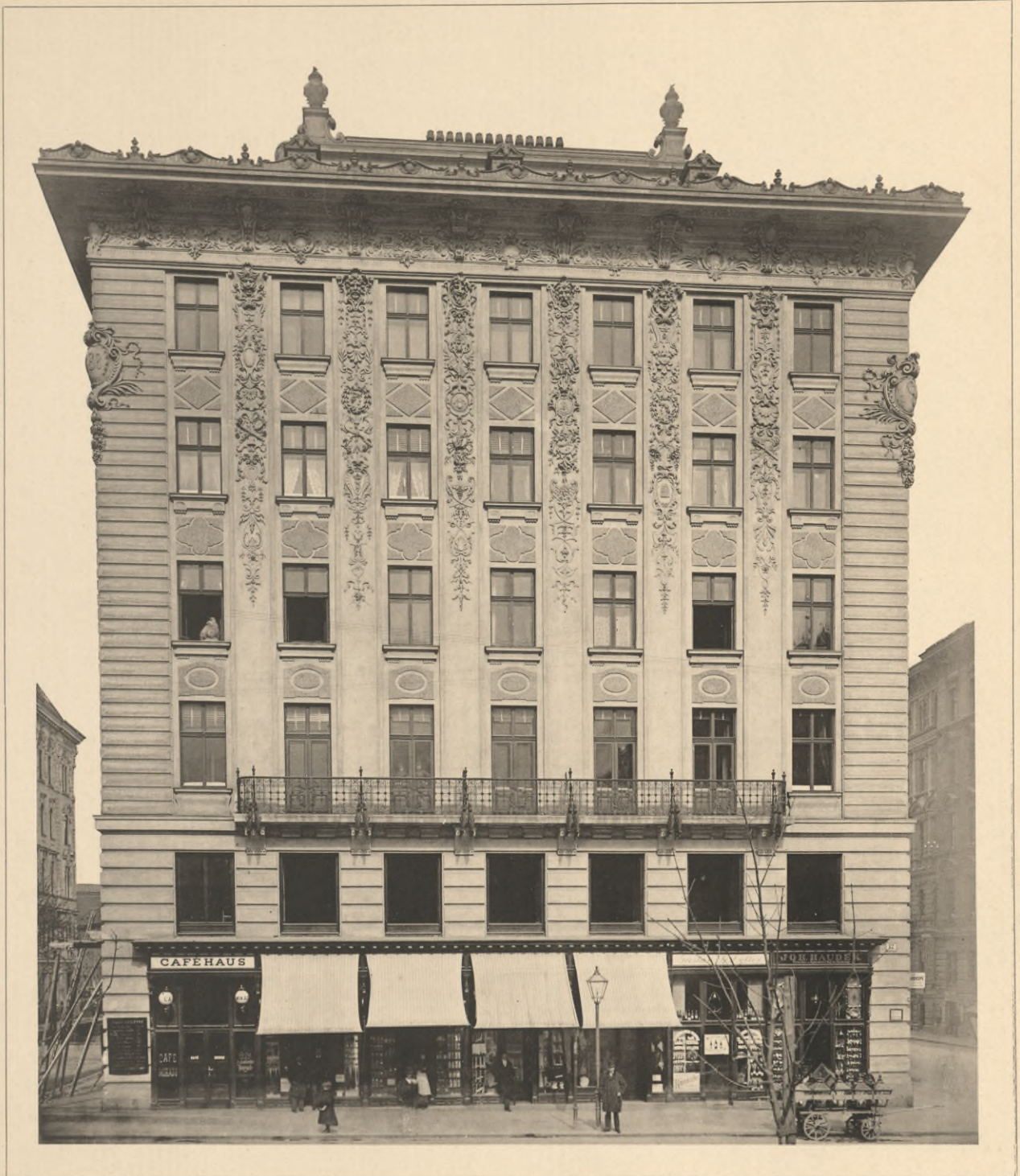
Otto Wagner, k. k. Baurath.