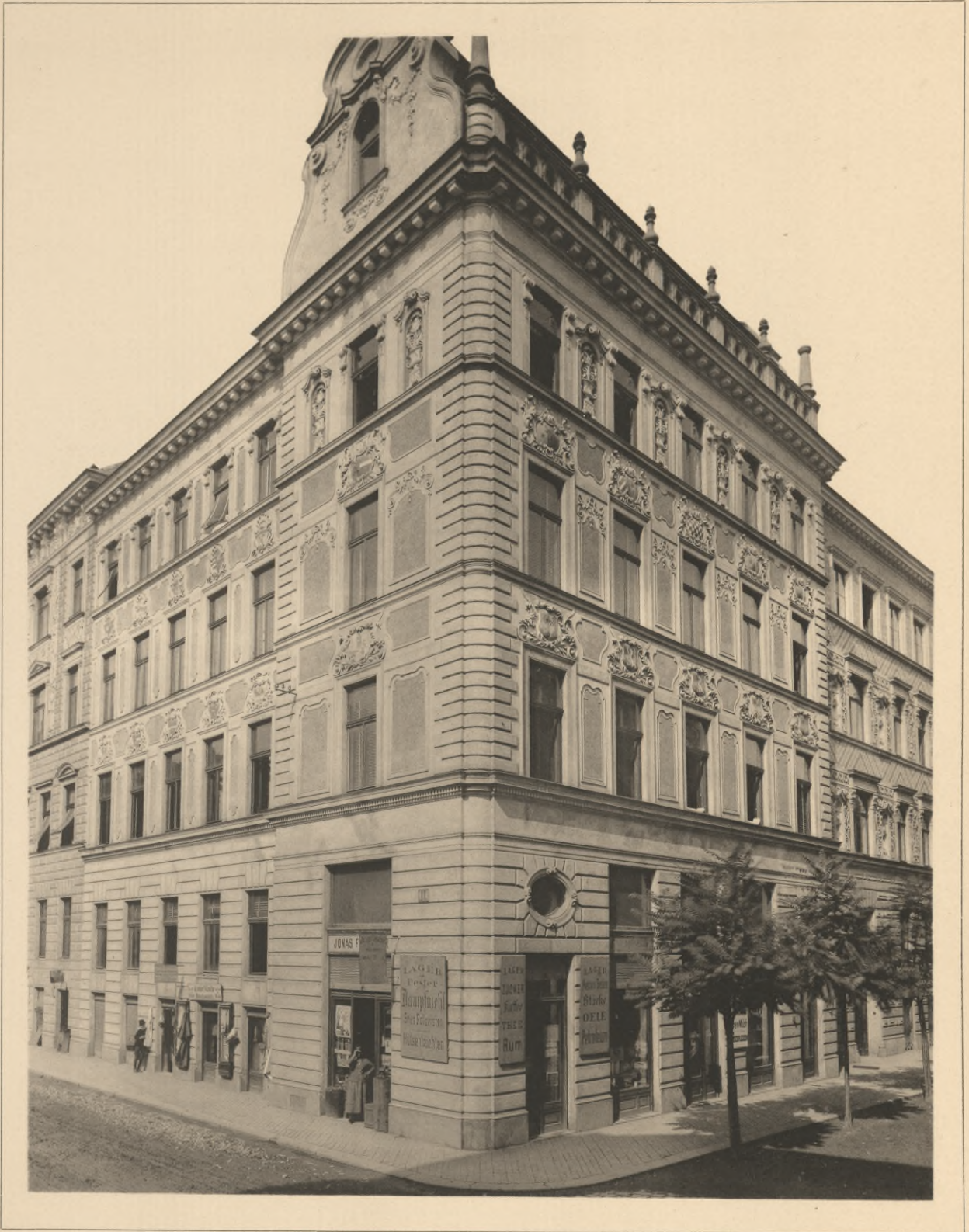
Wieser & Lotz, Architekten.