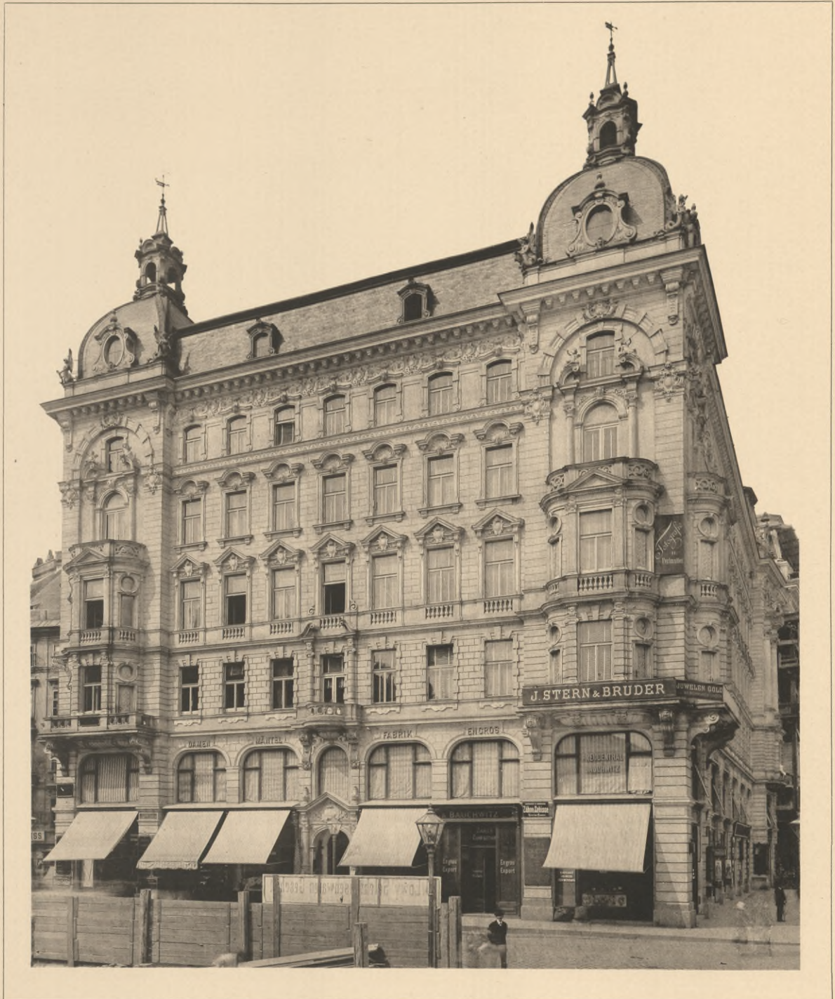
Fellner & Helmer, Architekten.