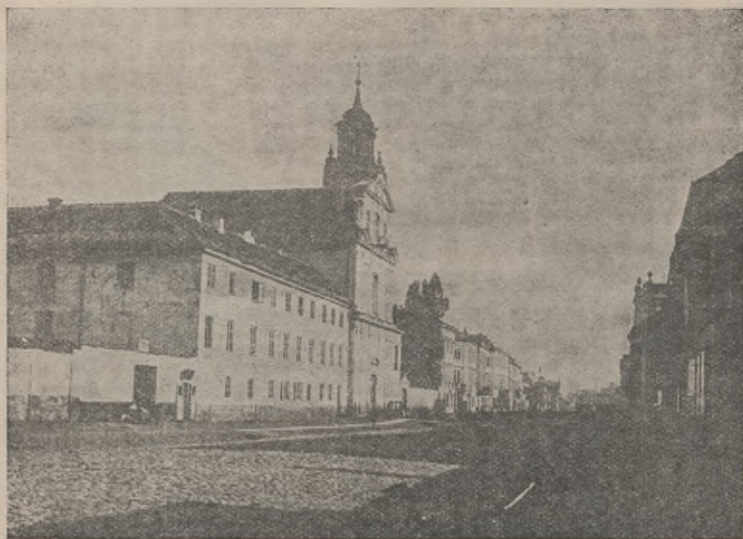
Rys. 3. Ul. Leszno, z fot. Brandla.

Okres dziejowy, zapoczątkowany w zaraniu XVIII w. przełomem w życiu Warszawy, kiedy stała się ona stolicą po przeniesieniu rezydencji królewskiej, najsilniej się rozwinął i najpotężniej przemawia też do nas w Przedmieściu Krakowskiem, najpiękniejszej ulicy Warszawy. Trzy bezmała wieki najświetniejszego rozwoju stolicy złożyły się na zasadniczą jego treść. Jest ono jakby Panteonem przeszłości. Ciągnie się