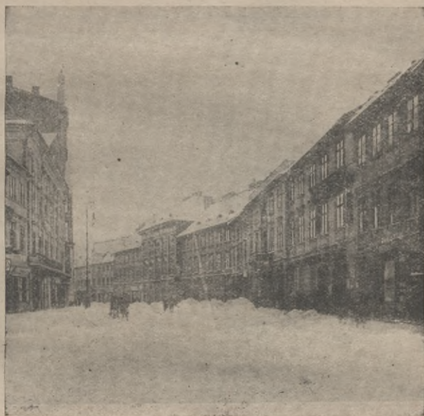
Rys. 2. Ul. Długa.

Burze dziejowe, czas i poczynania pokoleń następnych starły z nich wyraz pierwotny, jeśli chodzi o kształty architektoniczne budowli. Zginęły ówczesne pałace; kościoły przebudowano; domy narosły, jako twory późniejsze, lecz charakter tych dawnych przedmieść pozostał w ich ogólnej konfiguracji, w chaotycznym i przypadkowym rozplanowaniu, w którym znać nie liczący się z niczem szeroki rozmach możnowładczych jednostek. Przykład tego dowodny — okolice najbliższe placu Teatralnego. Duch dawnej Warszawy przemawia tu jeszcze sil-