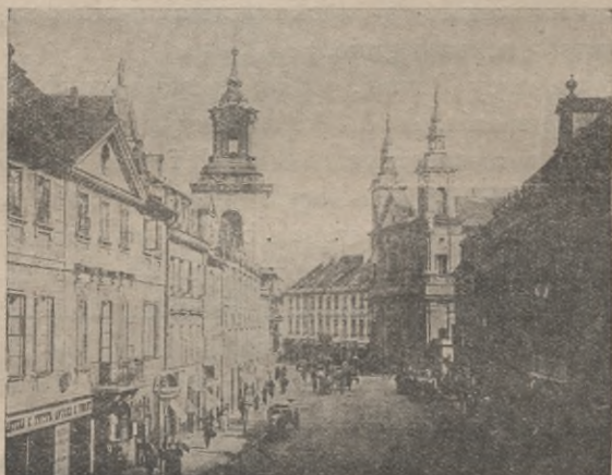
Rys. 1. Ul. Freta przy wylocie Długiej 1) .

Wiele też jeszcze staromiejskiego wyrazu posiada ul. Długa, odwieczna arterya komunikacyjna, dawny trakt błoński, do niedawna jedna z pryncypalnych ulic Warszawy. Część jej szeroka ma mniej więcej ten sam charakter barokowy, jaki widzieliśmy w ul. Freta, lecz du-