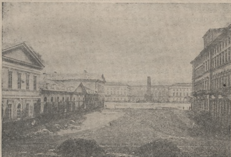
Rys. 5. Plac Saski, z fot. Brandla.

W chwili, gdy powstawał plac Saski, miasto znajdowało się już w okowach. Z utratą bytu politycznego i zanikiem władz autonomicznych, warunki jego stawały się anormalne; lecz rozwój mocą żywiołowego rozpędu trwał nieprzerwanie, nie zdradzając jeszcze symptoma-