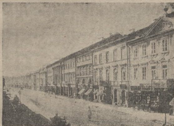
Rys 4. Ul. Nowy Świat, z fot. Brandla.

O założeniu pałacowem jest też gmach Uniwersytetu, dawny pałac Kazimierzowski, zepsuty dziś zawalidroga, jaką stworzyła dla szlachet-