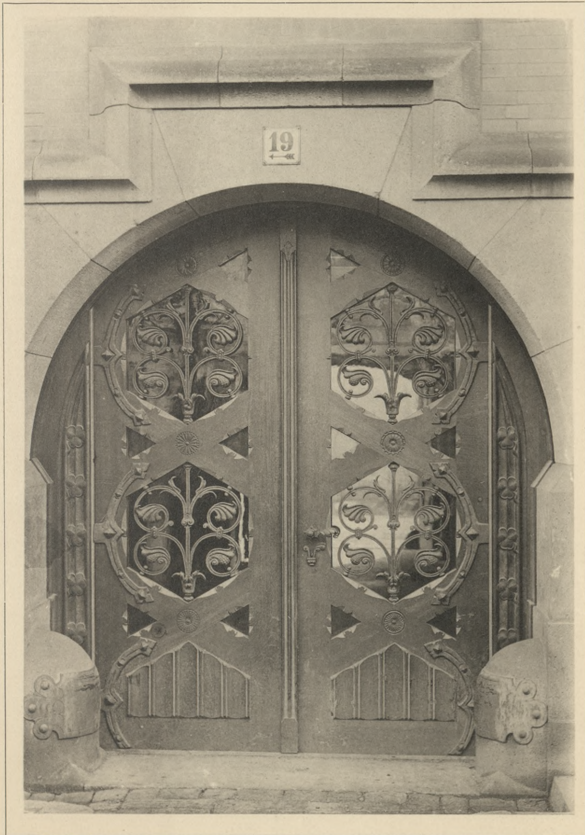
Entwurf: G. Rockstrohen, Berlin.