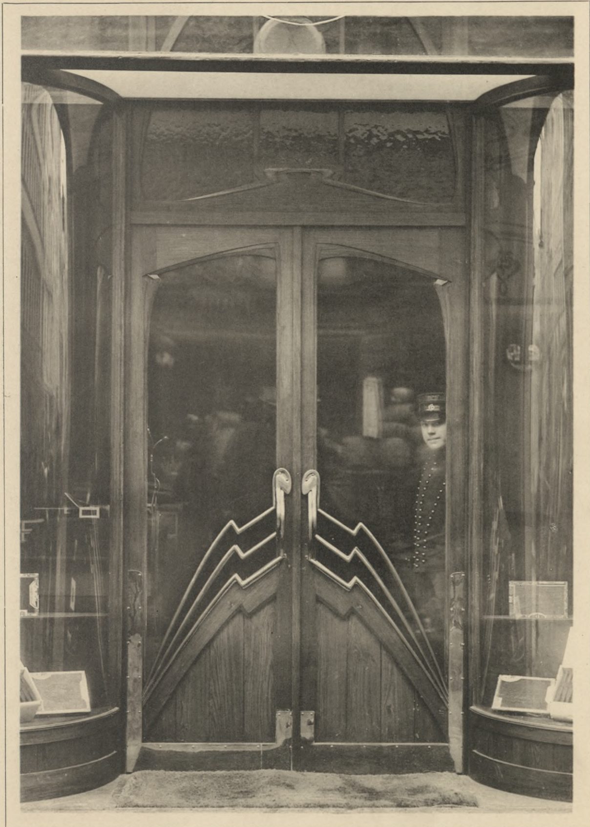
Entwurf und Ausführung: H. Van der Velde, Brüssel.