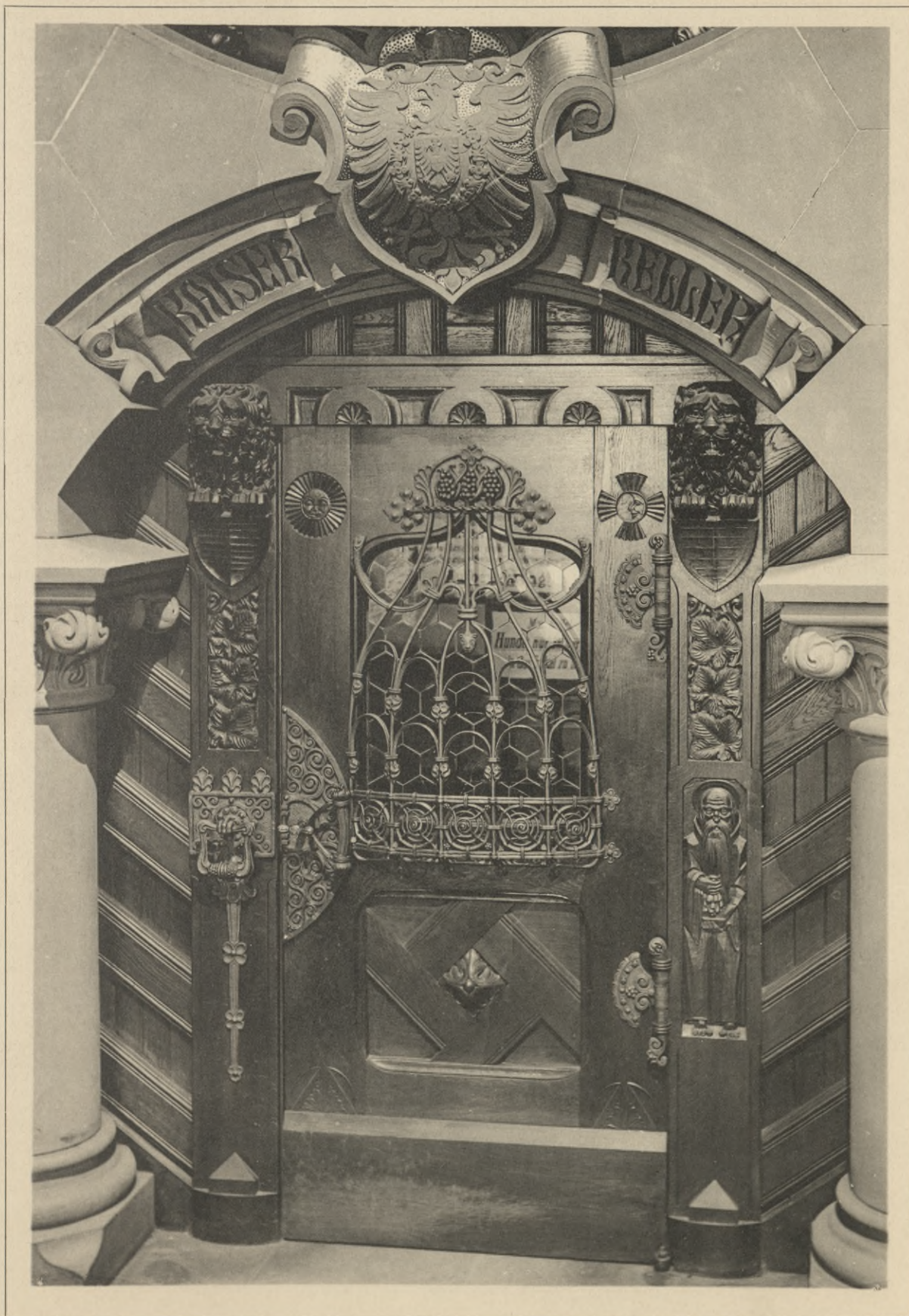
Entwurf: Franz Hildebrandt, Berlin.