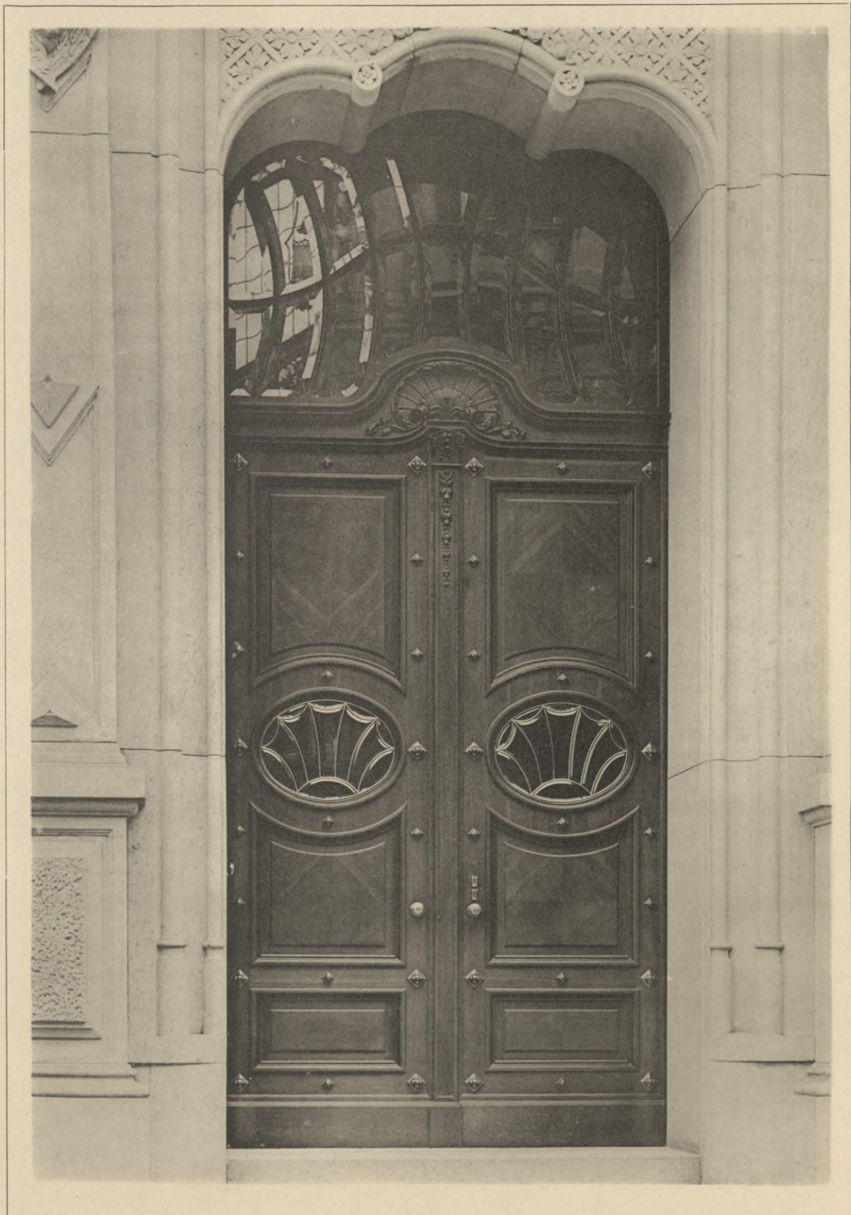
Entwurf und Ausführung: Gustav Meyer, Berlin.