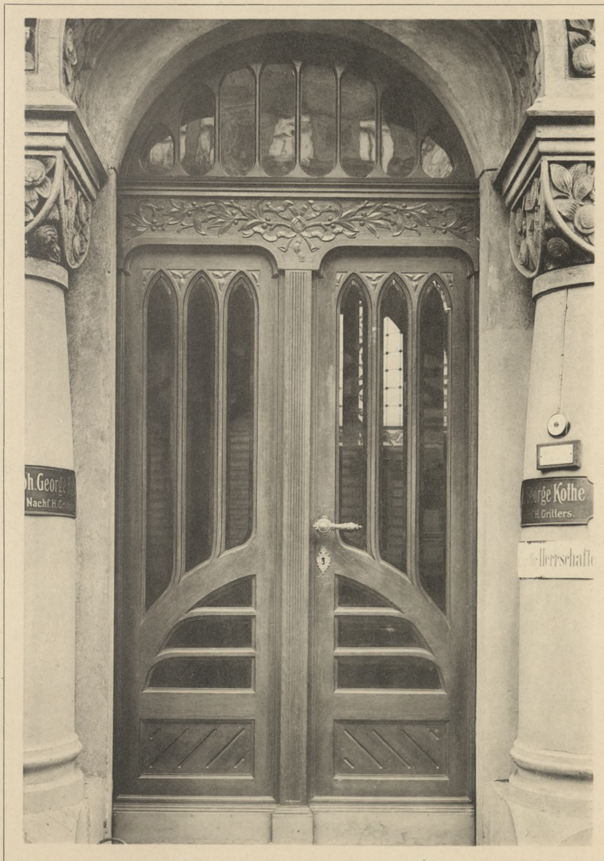
Entwurf: Paul Hoppe, Berlin.