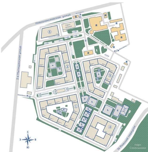
II. 3. Многоформатный комплекс апартаментов на улице Новоалексеевская в Москве. LLC „Проект SPiCh“, 2018