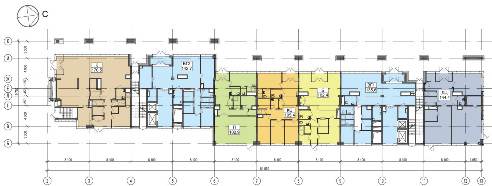
II. 4. Wielofunkcyjny kompleks apartamentów „Basmanny 5” w Moskwie. Twórca: JSC „MR Group”, 2018