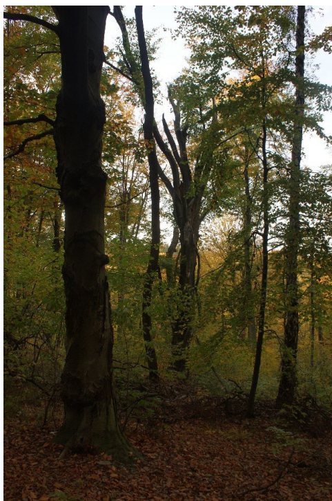
II. 3. Widok ze ścieżki prowadzącej do ZOO