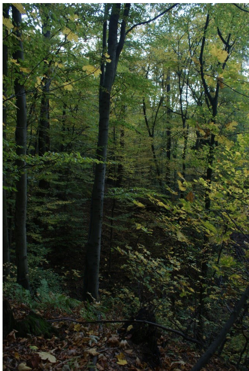
II. 2. Widok z leśnej ścieżki