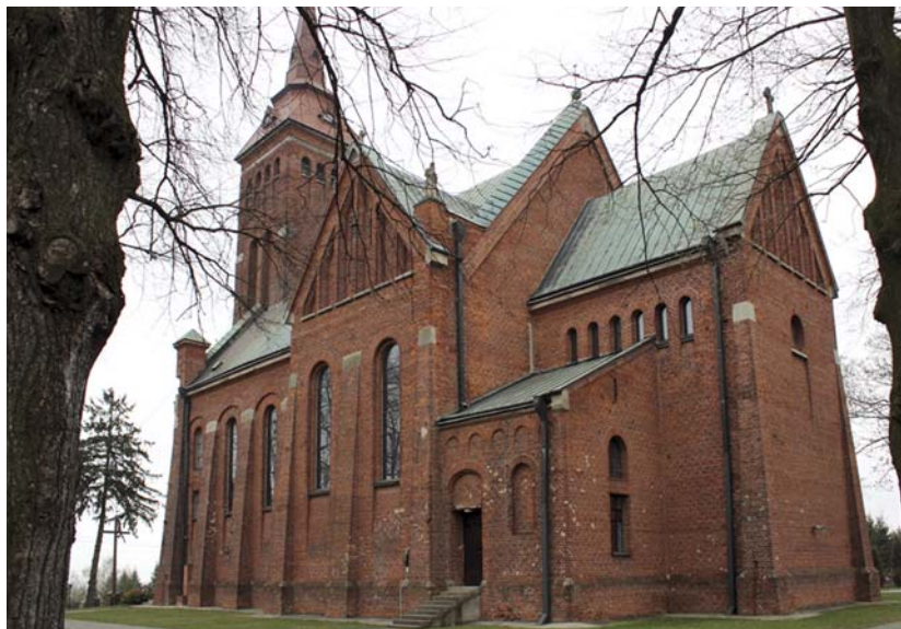
Ryc. 2. Widok od strony prezbiterium Fig. 2. View from the chancel