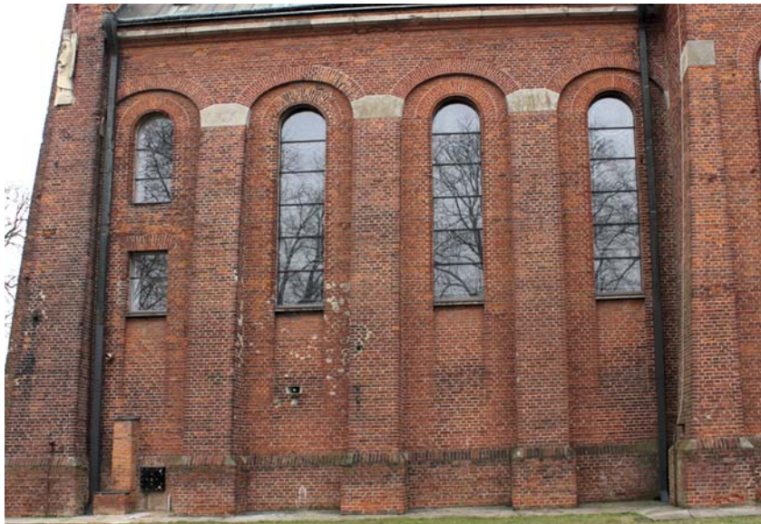
Ryc. 6. Otwory okienne w nawie zachodniej

Fig. 5. Statue on the shelf of the east façade