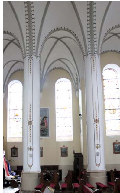
Ryc. 8. Kolumny międzynawowe

Fig. 7. Vault of the main nave