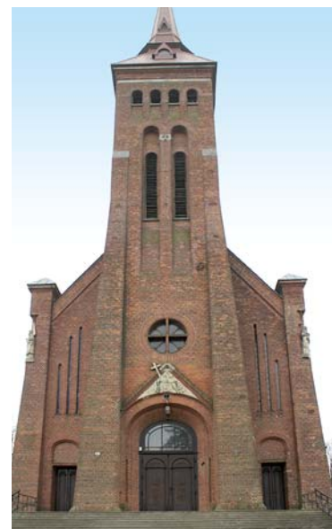
Ryc. 4. Fasada Fig. 4. Façade

obustronnie narożniki, jednak dodano tu jeszcze lizene na osi ściany transeptu między dwoma wysokimi oknami. Prosto zamkniętą szczytową część ściany czołowej transeptu również udekorowano analogicznie do prezbiterialnej, ale w południowych narożnikach wprowadzono dodatkowo obeliski z kamiennymi posągami. Ornamentyka elewacji transeptu także nie różni się od dekoracji bryły świątyni. Dołem znajduje się ceglany cokół z pulpitym gzymsem, na bocznych ścianach koronujący profilowany gzymś kamiennie-ceglany, a kamienne wkładki uzupełniają wątki ornamentalne (ryc. 3). Dodajmy jeszcze, że transept został nakryty dwuspadowym dachem krytym blachą, z kalenicą prostopadłą do kalenicy głównej i nieznacznie od niej niższą.