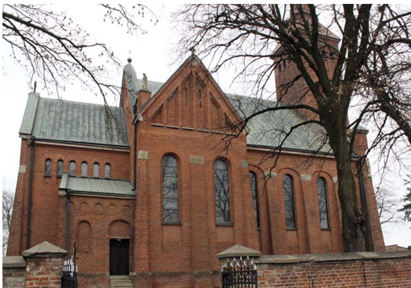
Ryc. 3. Elewacja boczna i wschodnie ramię transeptu Fig. 3. Side elevation and the east arm of the transept