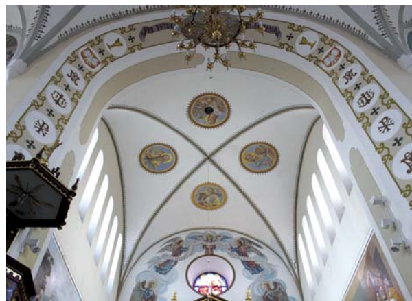
Ryc. 9. Sklepienie prezbiterium

The architect designed fairly uniform window openings. In the side aisles (in hall churches and pseudo-basilicas the main nave did not have window openings) he cut out tall windows with semi-circular tops framed with lizenas, decorated them with brick frames at the top, and made the whole create a kind of blinds with simple stone window sills lined with steel sheets (fig. 6). The windows in the front walls of the transept were similarly shaped and set in a stepped embrasure separated by a lizene, with stone window sills lined with steel sheets. In the gable wall of the chancel Kazimierz Skórewicz designed an ocululus with a rectangular niche below it, while in the upper section of side walls – a row of window openings with semi-circular tops, brick frames above the arch, and slanting window sills lined with steel sheets. By two southern openings in both side walls there are rectangular niches beneath the windows.