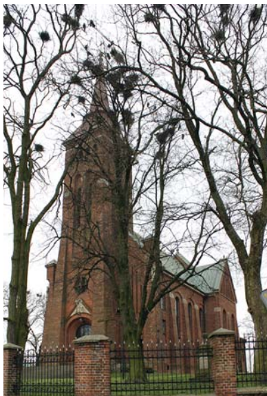
Ryc. 1. Ogólny widok obiektu Fig. 1. Overall view of the object