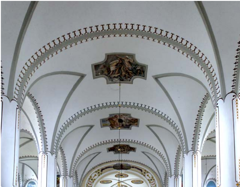
Ryc. 7. Sklepienie nawy głównej

Fig. 6. Window openings in the west aisle