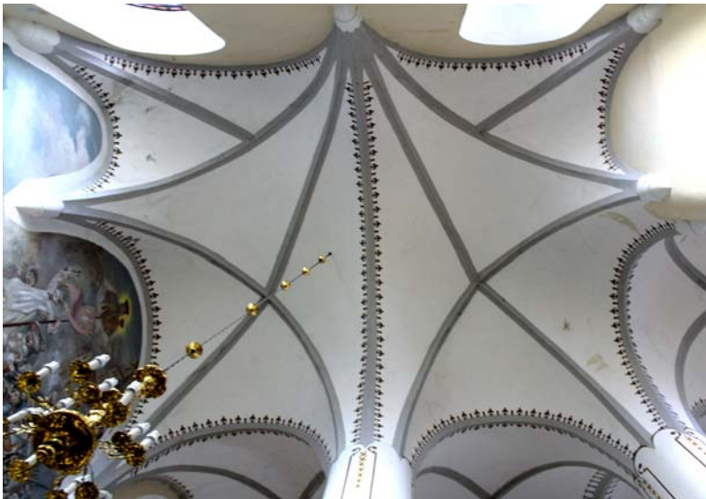
Ryc. 11. Sklepienie ramienia transeptu