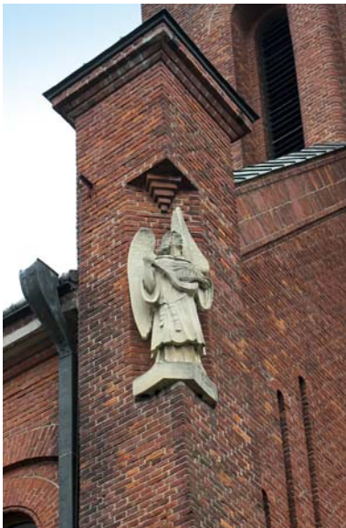
Ryc. 5. Posąg na półce wschodniej fasady

Fig. 5. Statue on the shelf of the east façade