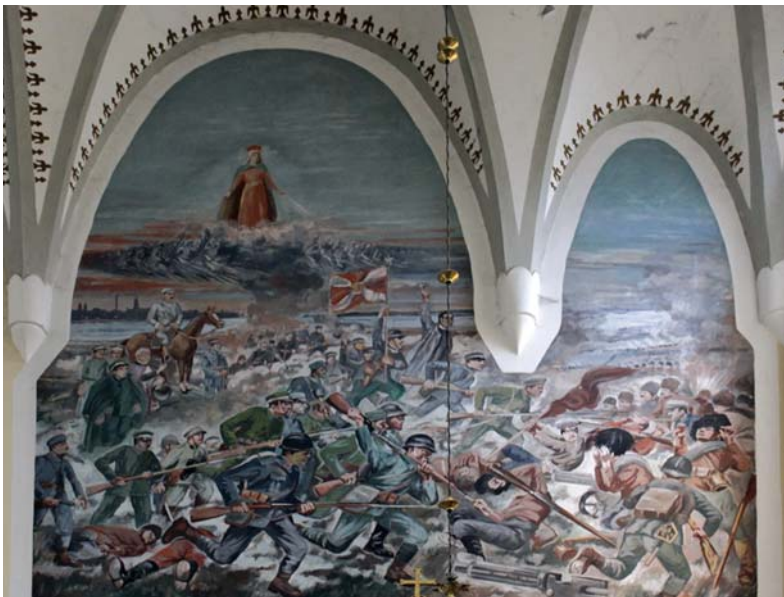
Ryc. 13. Polichromowany obraz w ramieniu transeptu