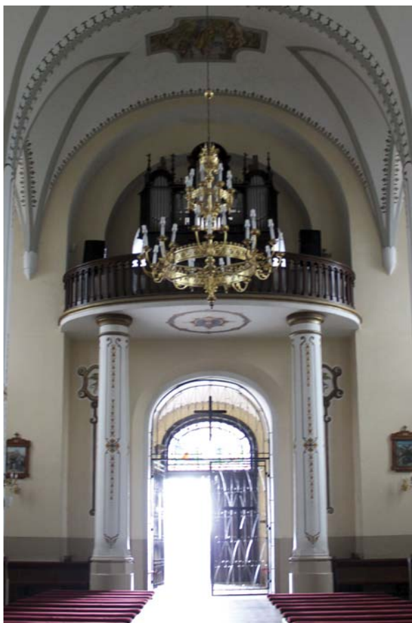
Ryc. 12. Chór muzyczny Fig. 12. Choir gallery

sklepieniach wszystkich naw nałożono malarską imitację żeber i gurtów. Bardzo podobną stylistykę zastosowano w prezbiterium. Na ścianach bocznych występują polichromowane obrazy ze scenami biblijnymi, zaś nad ołtarzem głównym polichromia z sylwetkami aniołów. Sklepienie prezbiterium zdobią polichromowane medaliony z wizerunkami świętych oraz malarska imitacja żeber. Na ściany transeptu nałożono polichromowane obrazy w obramieniach, przedstawiające wydarzenia historyczne, m.in. bitwę pod Komarowem (ryc. 13), obronę Częstochowy, śluby Jana Kazimierza, a także postacie świętych, zaś sklepienia tej części świątyni nawiązują do dekoracji naw korpusu z malarską imitacją żeber i gurtów oraz scenami biblijnymi w krzyżowych obramieniach. W 1996 roku Stanisław Książek z Żabikowa przeprowadził prace konserwatorskie polichromii. Dokonano wtedy przemalowania ścian i sklepień, pozostawiając jednak pierwotną kompozycję, dokonano retuszu „Bitwy pod Komarowem”, ale artysta wykonał też nowe obrazy: „Ostatnią Wieczerzę” i „Rozmnożenie Chleba” [4, s. 163]. Witraże figuralne zamontowane w oknach mają w większości dość późną genezę (ryc. 14). Chyba najstarszy witraż pochodzi sprzed 1938 roku i przedstawia Trójcę Przenajświętszą, w czasie wymiany okien (2010) został poddany konserwacji. Pozostałe zostały wykonane w latach 2007–2011 w Pracowni Witraży Bolesława i Zbigniewa Jaworskich we Wrocławiu i przedstawiają m.in. Świętą Rodzinę, NMP