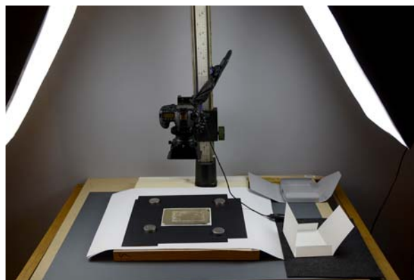
Ryc. 3. Stanowisko przygotowane do odwzorowania cyfrowego negatywów przed i po zabiegach konserwatorskich

Prace konserwatorskie rozpoczęto od przygotowania stanowisk pracy oraz miejsca przechowywania negatywów ze szczególnym kontrolowaniem stabilnych warunków temperatury i wilgotności względnej. Wydzielono przestrzeń do inwentaryzacji każdego z obiektów. Zaprojektowano i wykonano stanowiska do cyfrowej rejestracji fotograficznej przed i po wykonaniu działań na obiektach w świetle odbitym, jak i przechodzącym. Podczas prac każdy obiekt zostaje szczegółowo opisany pod kątem technologii wykonania i stanu zachowania. Opis zawiera również adnotacje o przeprowadzonych zabiegach. W celu precyzyjnego opisu każdego z negatywów stworzono autorski program dokumentacji obiektów, który służy do utworzenia statystyk omawianych zagadnień. Utworzona baza danych obejmuje inwentaryzację podłoża i warstwy obrazowej każdego z negatywów. Dokumentacja zawiera informacje na temat danych inwentaryzacyjnych obiektu (numer inwentaryzacyjny MHK, autor, data powstania, technika wykonania, format negatywu, treść, sposób przechowywania); techniki wykonania negatywu z określeniem wszystkich użytych materiałów (barwa obrazu, werniksy, retusze, maski papierowe, adnotacje, itd.); oceny stanu zachowania negatywu (stan zachowania szkła, warstwy obrazowej, warstw werniksów, retuszy, papierów maskujących, itd.); wszelkich napraw i renowacji przed 2017 rokiem oraz dokumentacji przeprowadzonych zabiegów konserwatorskich.