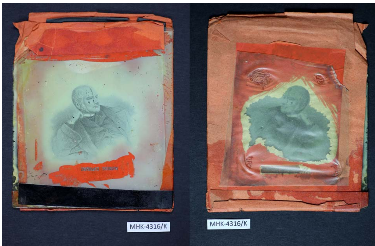
Ryc. 4. Fotografia negatywu kolodionowego MHK-4316/K. Widok od strony obrazowej i podłoża szklanego, przed konserwacją

Conservation work commenced by preparing workstations and a place for storing negatives with controlled stable conditions of temperature and relative humidity. Separate space for inventorying each object was arranged. Workstations for digital photographic recording before and after treating the objects in reflected and transmitted light were designed and prepared. During the work, each object was described in detail as far as the technology of making it and state of preservation were concerned. The description also includes annotations about carried out treatment. In order to precisely describe each negative, and the original programme for