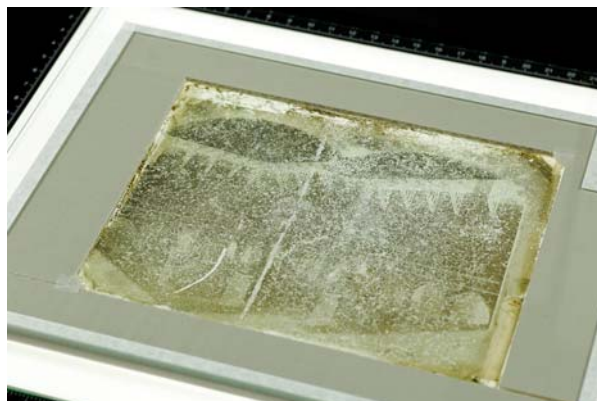
Ryc. 10. Detal, zabezpieczenie rozbitego negatywu między płytkami szkła ujętego w ramę z tektury falistej bezkwasowej

jako wykonane w technice mokrego kolodionu. Warstwa utrwalonego obrazu we wszystkich opracowywanych negatywach zabezpieczona została werniksem. Werniks najczęściej nakładano na całości warstwy obrazowej przez oblew z widocznymi krawędziami. Na większości negatywów werniks nałożony jest w równomiernej warstwie o dużej przezroczystości i połysku. Niektóre negatywy posiadają warstwę obrazową i warstwę werniksu nałożoną jedynie na fragmencie płytki szklanej. Niewielka liczba negatywów była pokryta werniksem matowym.