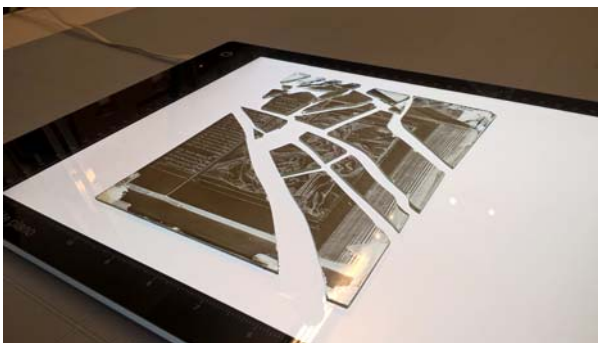
Ryc. 9. Fotografia rozbitego negatywu MHK-63/K, po oczyszczeniu i skompletowaniu elementów