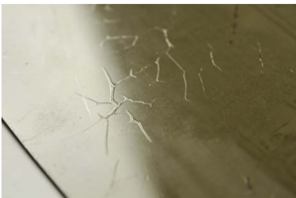
Ryc. 8. Detal negatywu kolodionowego, widoczne uszkodzenia warstwy obrazu oraz werniksu