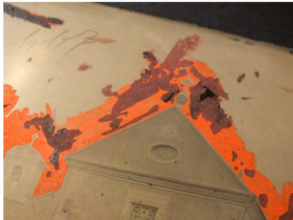
Ryc. 2. Detal, fotografia negatywu kolodionowego MHK-3576/K. Widoczne uszkodzenia retuszu naniesionego na warstwę obrazową

Istotne jest podkreślenie różnorodności problematyki zagadnień, z jakimi spotykają się konserwatorzy podczas pracy. Wynika ona ze zróżnicowania materiałów, z jakich zbudowane są obiekty, takich jak szkło, nośnik nitrocelulozowy, żywice, farby, papier oraz z konieczności odróżnienia uszkodzeń od autorskich wad technologicznych. W przypadku podłoża Kriegerowie wykorzystywali szkło o grubości od 1–3,5 mm, o nierównomiernych bokach, które mogą być wynikiem autorskiego przycinania tafli szkła (zarówno przed obróbką chemiczną, jak i po przeprowadzonych zabiegach), bądź uszkodzeń mechanicznych. Spękania, spęcherzenia warstwy obrazu mogą być spowodowane zarówno przez autorskie wady wykonania, jak i przez liczne nieuniknione zmiany chemiczne związane z warunkami przechowywania, szczególnie zmiennymi warunkami wilgotności względnej. Większość opracowanych negatywów była retuszowana m.in. poprzez naniesienie farby pędzlem, a następnie rozprowadzana palcem. Tego typu retusz jest trudny do odróżnienia od