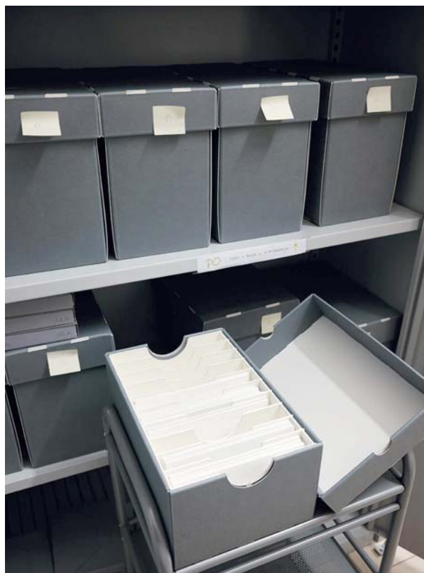
Ryc. 11. Klisze umieszcza się i przechowuje w dedykowanych pudłach, zgodnie z formatem klisz