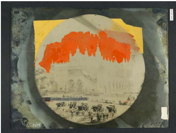
Ryc. 1. Fotografia negatywu kolodionowego MHK-1827/K. Widok warstwy obrazowej w świetle odbitym

Fig. 1. Photograph of collodion negative MHK-1827/K. View of the image layer in reflected light