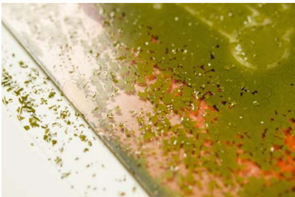
Ryc. 7. Detal negatywu kolodionowego, widoczne uszkodzenia warstwy obrazu, odspojenia i wykruszenia