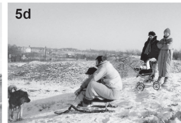
il. 5. Krajobraz Kurdwanowa: 5a – ul. Soboniowicka; 5b – ulica ślepa – kiedyś łącząca ulice Soboniowicką i Cechową. Na pierwszym planie widoczne są pozostałości dawnej drogi, na drugim planie opuszczone zabudowania fermy drobiu; 5c – park na os. Kurdwanów Nowy; 5d – zimowe zabawy na terenie dawnego kamieniołomu (5a – 5c zdj. aut. 2019, 5d – zdj. A. Klocek 1990)