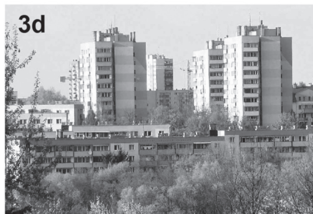
il. 3. Formy budynków mieszkalnych: 3a – dom z początku XX wieku; 3b – dom z połowy XX wieku; 3c – dom z lat 80.; 3d – osiedle Kurdwanów Nowy ill. 3. Forms of residential buildings: 3a – house from the beginning of the 20th century; 3b – house from the middle of the 20th century; 3c – house from the 1980s; 3d – estate of Kurdwanów Nowy

Nowe domy wznoszone w I poł. XX wieku naśladowały dawne formy. Obiekty zachowały prostokątny kształt i dwuspadowe przekrycie (il. 3b). Stosowano dwa typy ścian zewnętrznych: drewniane z oblicówką lub ceglane wykończone tynkiem. Budynki były nieznacznie większe od swoich poprzedników. Częstym zabiegiem było dodatkowe wydłużanie rzutu lub podwyższenie ścian poddasza co pozwalało uzyskać dodatkową przestrzeń użytkową. Popularne stały się ganki wejściowe do domów oraz niewielki okap rozdzielający ścianę parteru od pola szczytowego. Coraz częściej budynki mieszkalne były podpiwniczone. Charakter zabudowy różnił się tylko nieznacznie od tego z poprzednich dekad.