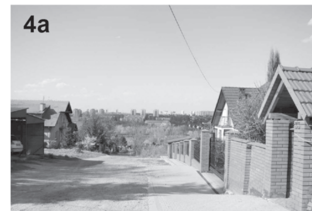
il. 4. Drogi prywatne (4a – 4d) – „sięgacze”, na przykładzie zabudowy między ulicami Wyżynną i Miarową ill. 4. „Private roads” (4a – 4d) – buildings between Wyżynna and Miarowa streets

The houses had flat roof or a roof with a slight slope. Unfortunately, flat roofs often leaked. For this reason, most of them have been rebuilt into gable roofs or