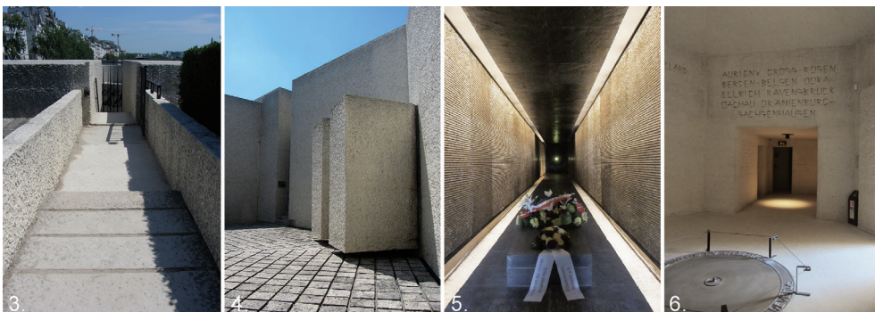
Il. 3–6. Pomnik Męczenników Deportacji, Paryż, Francja, lipiec 2019