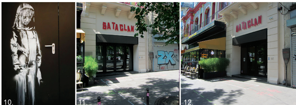
Il. 10. Bez tytułu, (prawdopodobnie) Banksy, Paryż, Francja