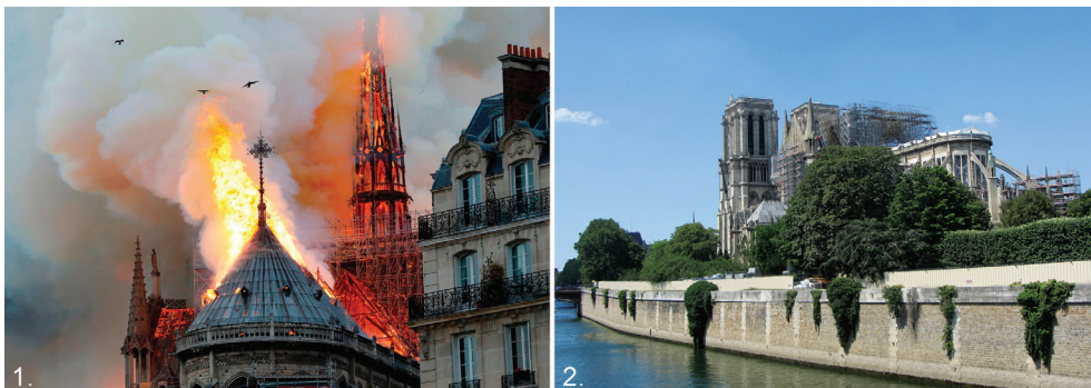
Il. 1. Płonąca katedra Notre Dame, Paryż, Francja Il. 2. Katedra Notre Dame po pożarze, Paryż, Francja, lipiec 2019