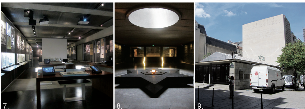
Il. 7–9. Muzeum Pamięci Shoah, Paryż, Francja, lipiec 2019