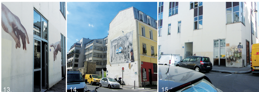
Il. 13, 15. Wejście do budynku redakcji Charlie Hebdo, Paryż, Francja, lipiec 2019