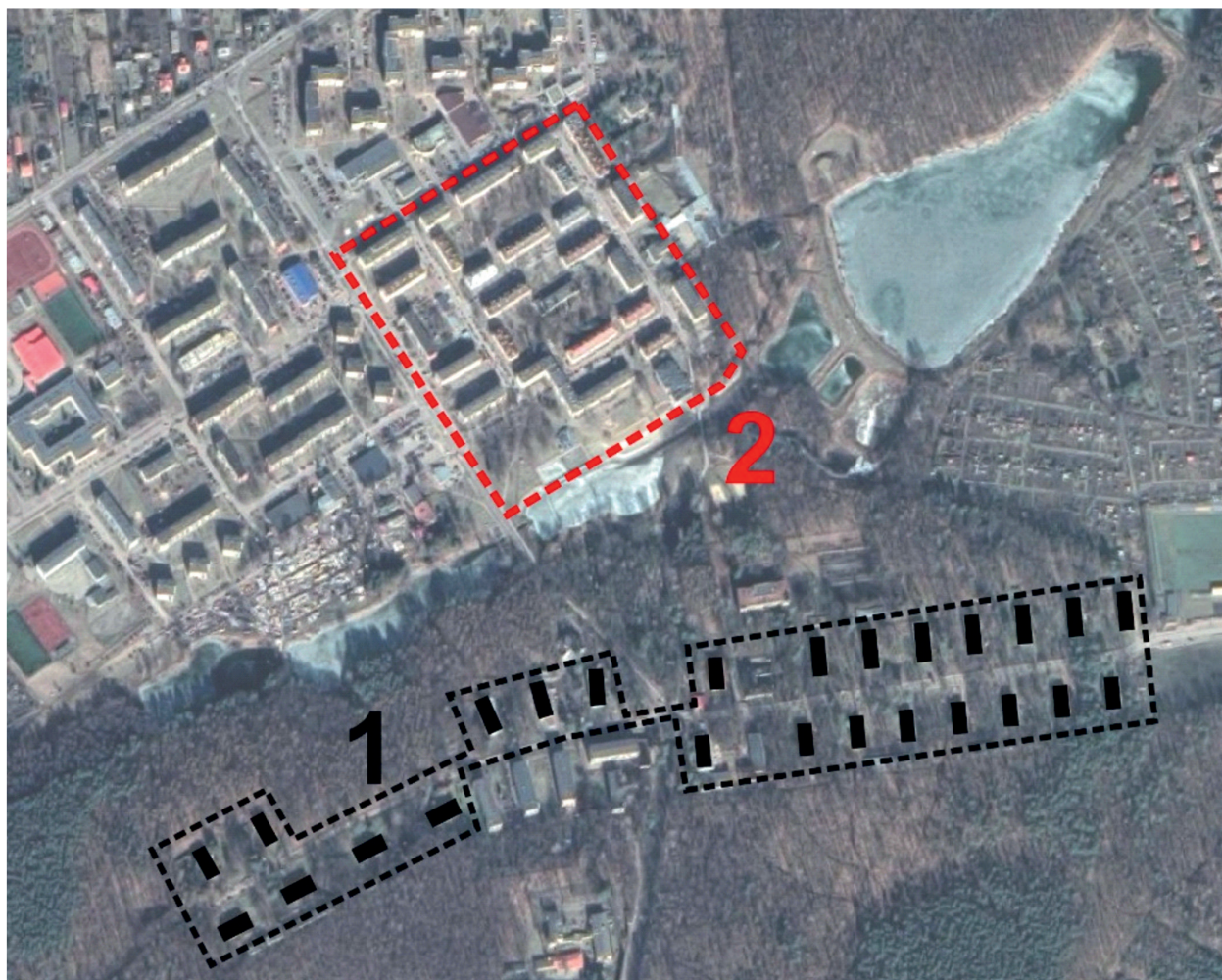
Il. 2. Policentryczny układ zespołów miejskich Poniatowej. Oznaczenia: 1 – kolonia urzędnicza i inżynierska, 2 – nowe śródmieście wybudowane w latach 50., 60. XX wieku (opracowanie własne)