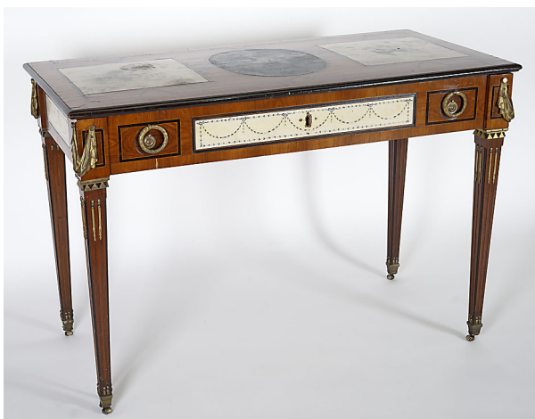
Ryc. 2. Stolik-biurko, ŁKr 142, stan przed konserwacją, autor: Konrad Stasiuk, Muzeum Łazienki Królewskie w Warszawie