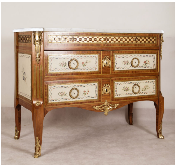
Ryc. 1. Komoda ŁKr 141/1, stan po konserwacji, autor: Oksana Fiodorowa, Fundacja D.O.M.