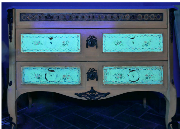
Ryc. 5. Komoda nr inw. ŁKr 141/2. Obraz fluorescencji wzbudzonej ultrafioletem zarejestrowany w zakresie światła widzialnego. Widoczna mleczna barwa fluorescencji charakterystyczna dla powłoki wykonanej lakierem syntetycznym

argumentem za tym, że meble pochodzą znan Sekwany jest informacja z inwentarza z 1783 roku, podana przez burgrabiego zamku warszawskiego Jana Kantego Fontanę, który przy opisie komody z sypialni podaje, że jest ona „paryska”. Jednak ta proveniencja nie jest pozbawiona wątpliwości. Rodzą się one zarówno co do szczegółów wykonania mebla, jak i co do rzetelności deklarowanego przez właścicieli warszawskich magazynów miejsca produkcji oferowanych mebli luksusowych. Jednym z rozwiązań zdobniczych nie występujących w podobnych meblach francuskich jest sposób opracowania pasa dekoracji przebiegającego przez górną szufladę i nad malowanymi plaketami boków. W komodach łazienkowych jest to ażurowa kompozycja złożona z dużych i małych okręgów, wycięta z grubego forniru palisandru rio nałożona na cienką złożoną w ogniu cynową blaszkę. W meblach francuskich analogiczna dekoracja wykonana jest albo ze złożonego brązu, albo w technice markieterii. Jeśli