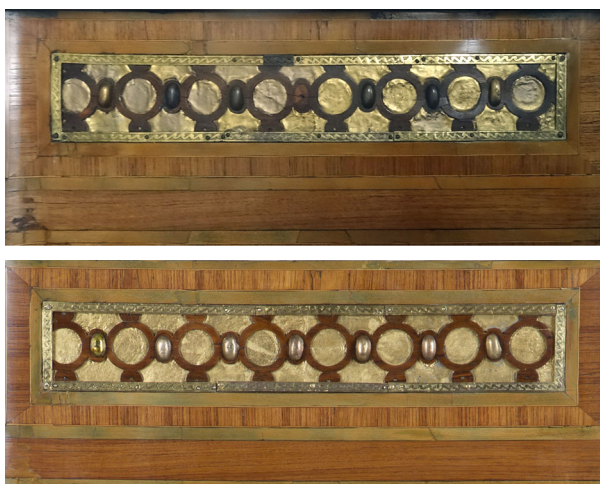
Ryc. 6. Lewy bok komody ŁKr 141/2, fragment, stan przed i po konserwacji