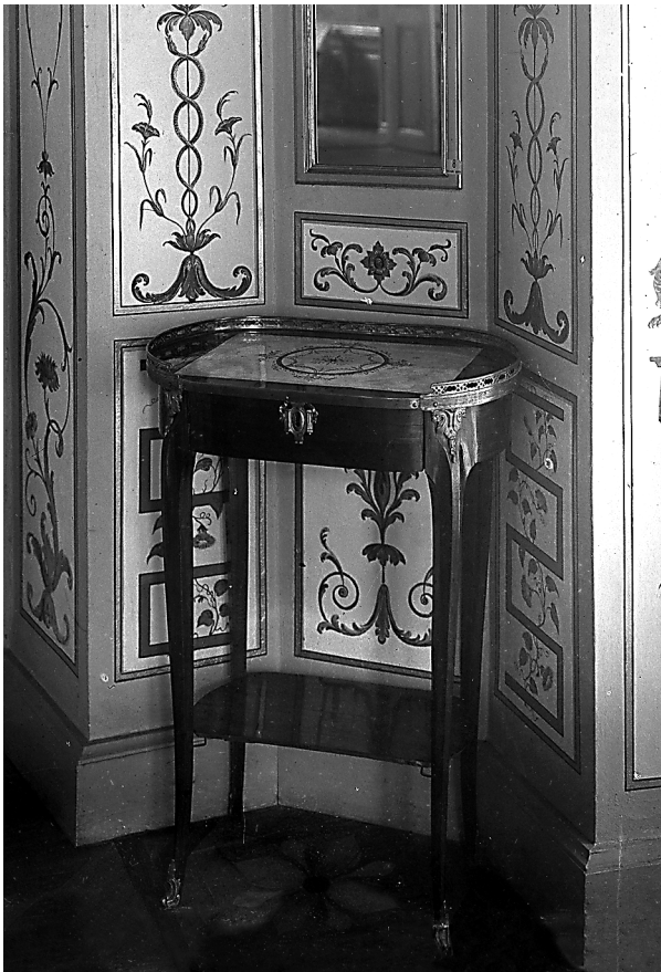
Ryc. 3. Stolik z jadalni Białego Domu, czas powstania 1915, autor: Stanisław Nofok-Sowiński.

Fig. 3. Table from the dining room in the White Pavilion, made in 1915, author: Stanisław Nofok-Sowiński.