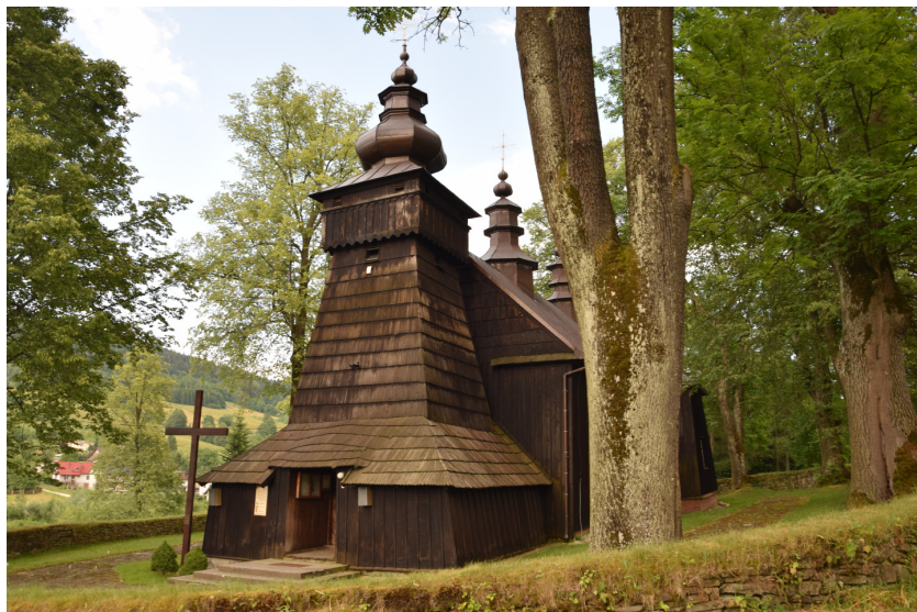
Królowa Górna. Kościół pw. Narodzenia Najświętszej Maryi Panny. Dawna cerkiew greko-katolicka pod tym samym wezwaniem; fot. J. Olesiak, 2016

parę kilometrów na zachód wzdłuż biegu potoku Królówka, zakładając wieś Królowa Polska 14 . Wtedy też datuje się początki tradycji i wielowiekowego procesu kształtowania się łemkowskiej grupy etnograficznej w tej okolicy 15 .