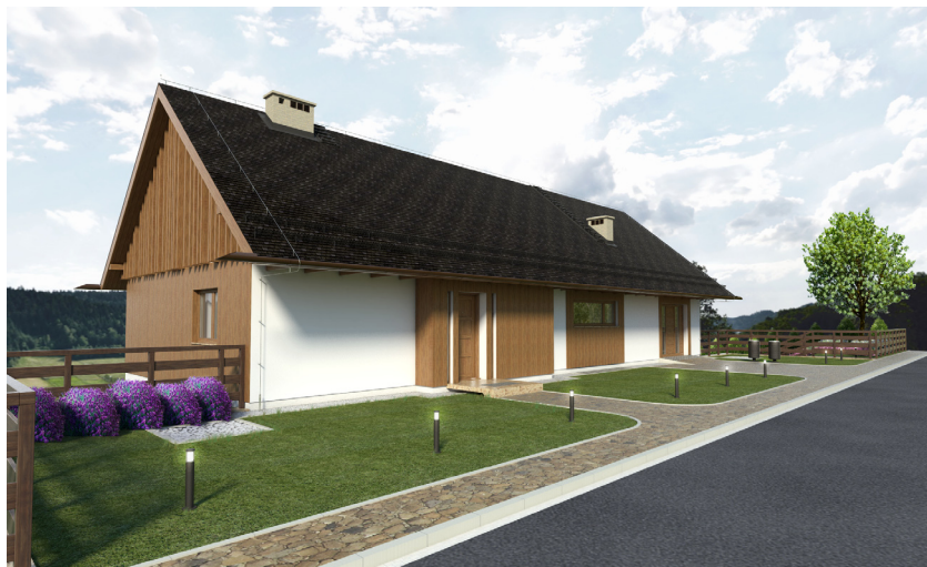
Królowa Górna. Koncepcja architektoniczna budynku mieszkalnego jednorodzinne, nawiązująca do regionalnego budownictwa łemkowskiego; projekt J. Olesiak, 2013

Ustalenia szczegółowe miejscowego planu zagospodarowania przestrzennego Gminy Kamionka Wielka 23 – we wsi Królowa Górna – w zakresie kształtowania architektury i ładu przestrzennego, obowiązują w kształtowaniu architektury „harmonizującej z krajobrazem i nawiązującej do lokalnych tradycji budowlanych”. Do wykończenia elewacji zaleca się stosowanie materiałów tradycyjnych, wymienione są kamień i drewno. Kolorystyka elewacji ma być utrzymana w kolorach pastelowych, zbliżonych do naturalnych barw drewna i kamienia.