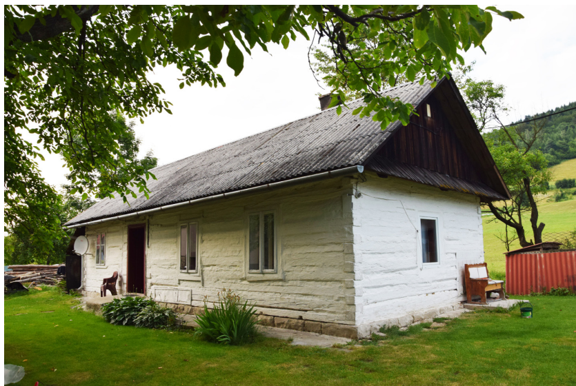
Dawna chałupa łemkowska w Królowej Górnej, obecnie dom mieszkalny pp. Siedlarzy; fot. J. Olesiak, 2013

Jedyny zachowany w miejscowości przykład budynku mieszkalnego, zidentyfikowany jako chałupa łemkowska, został zinventaryzowany przez autorkę w roku 2013. Jest to jednokondygnacyjny budynek drewniany, o konstrukcji zrębowej. Fundament stanowi kamienna podmurówka, brak natomiast podpiwniczenia.