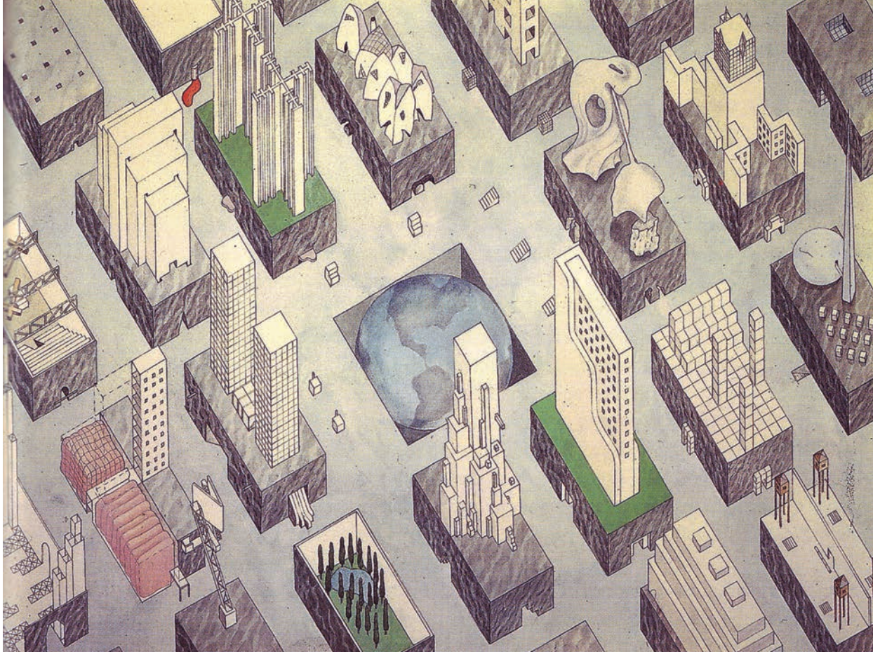
Il. 1. Rem Koolhaas, Zoe Zenghelis - Miasto Uwięzionego Globu / The City of the Captive Globe by Rem Koolhaas and Zoe Zenghelis

- odmienną strzelistą budowlę wznoszoną na standardowym kamiennym cokole. Na poszczególnych parcelach sąsiadują ze sobą różne, często zantagonizowane prądy europejskiej awangardy i nowojorskie wieżowce, z których każdy tworzy w swoim wnętrzu oryginalną subkulturę. Identyfikację tych reprezentacji pozostawiono spostrzegawczości czytelników książki. Możemy tu rozpoznać dzieła znanych architektów i artystów (Le Corbusiera, Dalego, Leonidowa, Malewicza, Miesa van der Rohe, i innych) jak i budowle występujące w „Delirycznym Nowym Jorku” (Hotel Waldorf-Astoria, Trylona i Perisferę, czy Rockefeller Center). Ideologie-budynki koegzystują w sztywnych ramach narzuconych przez Siatkę, równolegle przeżywając swoje mozolne wzniesienie i spektakularne upadki. Siatka gwarantuje stan nieustannego ruchu, napędzanego wzrastającą gęstością zaludnienia i nowymi technologiami, a będącego istotą wielkomiejskości. Ideologie wypełniające Siatkę są zredukowane do wymiennych elementów większego porządku, ich architektura ma względną wagę, której „wartość polega na dążeniu, a nie osiągnięciu skończonej formy” (de Graaf, 2019, 442).