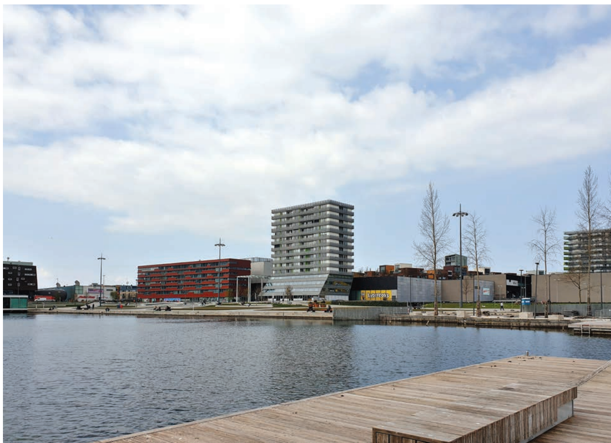
Il. 4. Centrum Almere od strony jeziora Weerwater, fot. Katarzyna Grądzka / The Almere City Center – Weerwater waterfront, photo: Katarzyna Grądzka

Reiner de Graaf (2019, 443) notes that, in view of the interchangeability of "works" of the architecture of the City of the Captive Globe, the immutable Grid remains its "true masterpiece". Koolhaas (2013, 339) makes it clear that it can be "any other subdivision of the metropolitan territory into maximum increments of control". It organizes the Metropolis on various levels: spatial, ideological, and semantic. The same is true for the Almere City Center. Its discontinuous and deformed street grid is the main carrier of the idea of the master plan, its essence and, as de Graaf would say, the "masterpiece". Despite its formal differences, it is as rigid