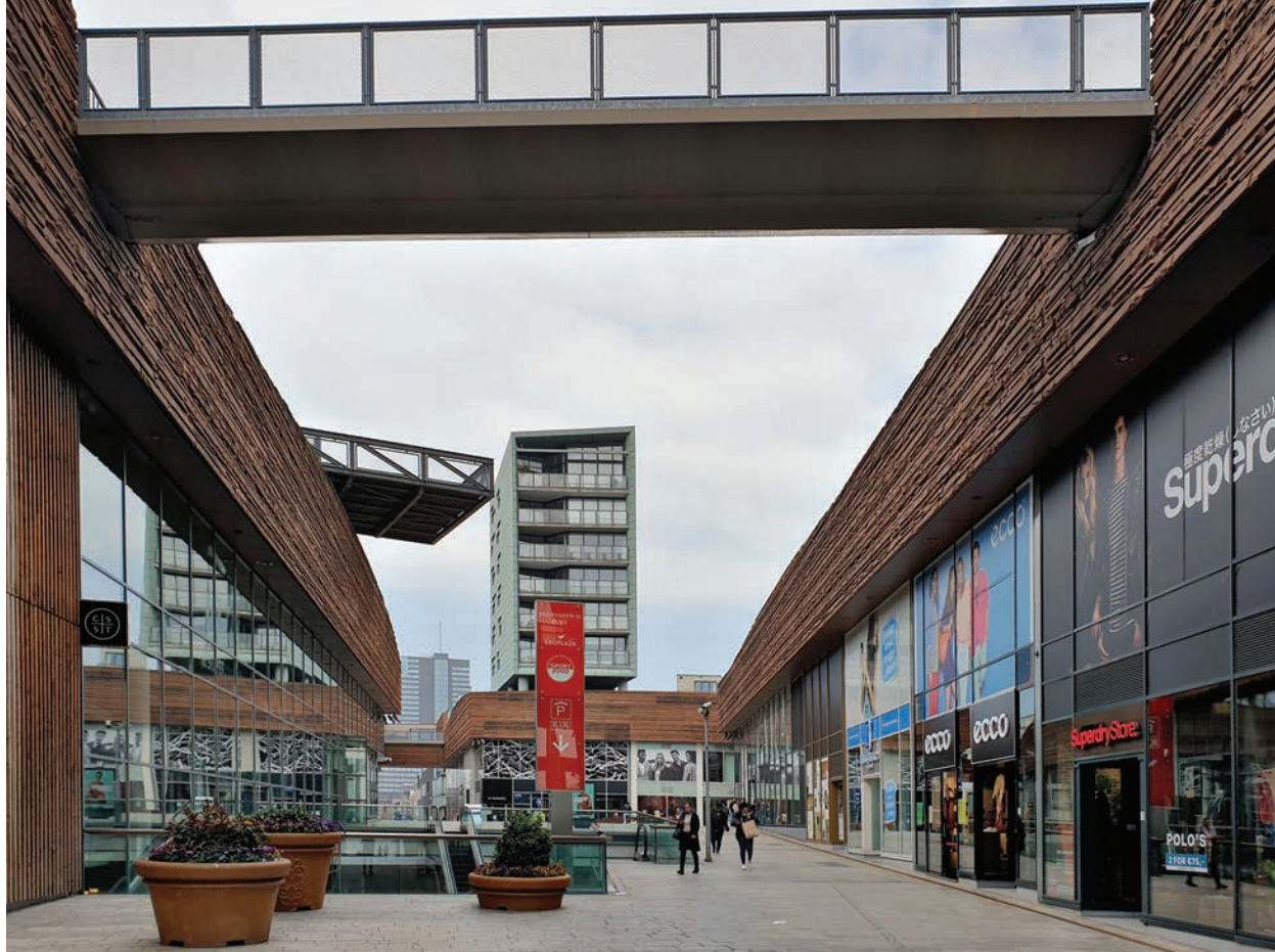
Il. 6. Pasaż centrum handlowego Cytadela wg projektu Christiana de Portzamparca, fot. Katarzyna Grądzka / The Passage of de Citadel shopping center designed by Christian de Portzamparc, photo: Katarzyna Grądzka

kluczyć, że w związku z trwającym dynamicznym rozwojem demograficznym miasta albo trwałą zmianą stylu życia (na przykład spowodowaną pandemią), poszczególne budynki zostaną zastąpione przez inne w ramach Siatki.