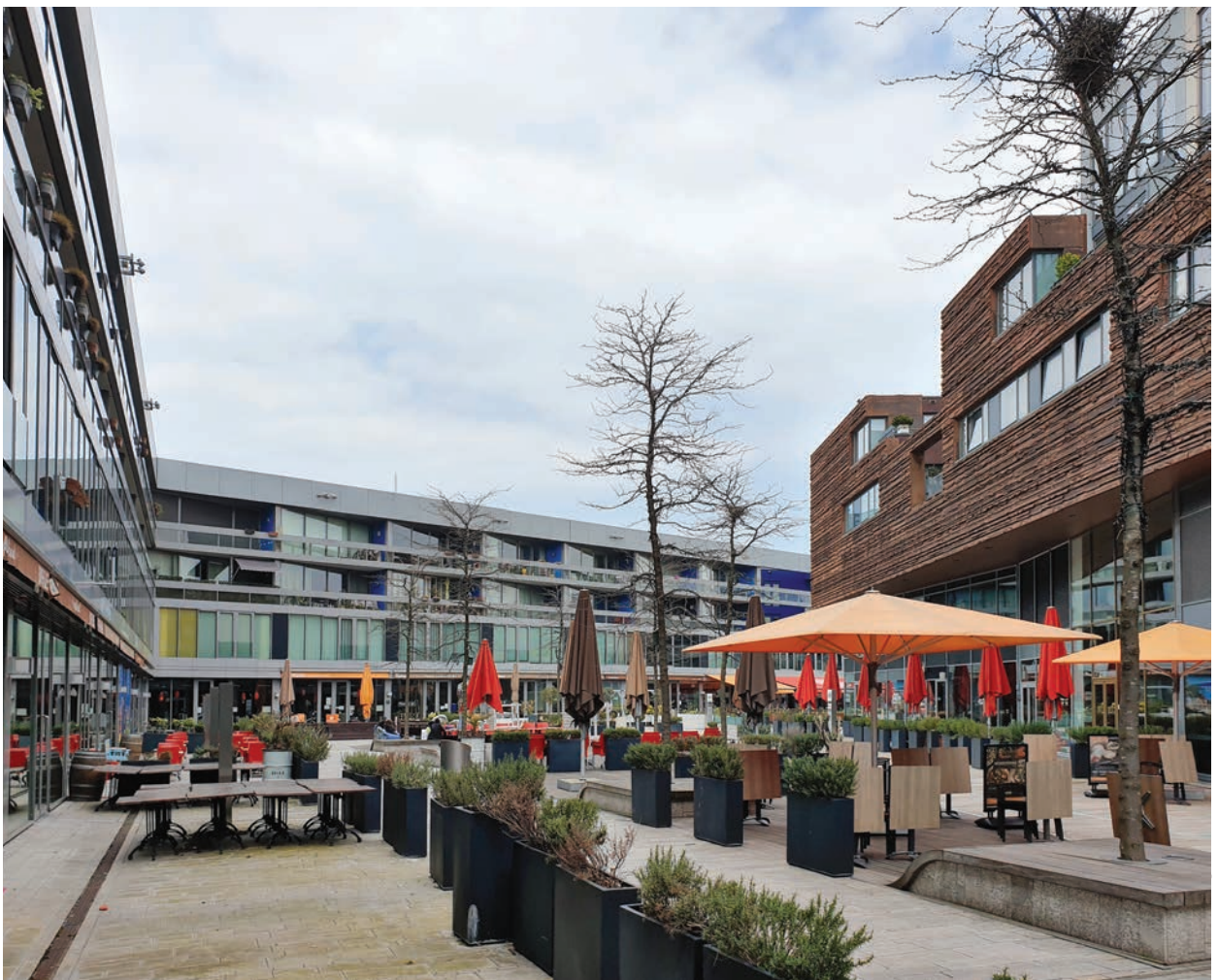
Il. 7. Uliczka piesza w centrum Almere, fot. Katarzyna Grądzka / The pedestrian street in the center of Almere, photo: Katarzyna Grądzka

In their Almere master plan, the architects from OMA attempted to implement the post-modern urbanism outlined earlier by Rem Koolhaas. When read as a manifesto, the City of the Captive Globe allows us to go beyond superficial perception of the formal aspects of the Almere master plan and see its underlying principle and design decisions in detail. On the other hand, the inner city of Almere, existing and functioning, can serve as a case for a verification of the competition objectives, the winning design by OMA and, also, the ideological manifesto of the City of the Captive Globe.