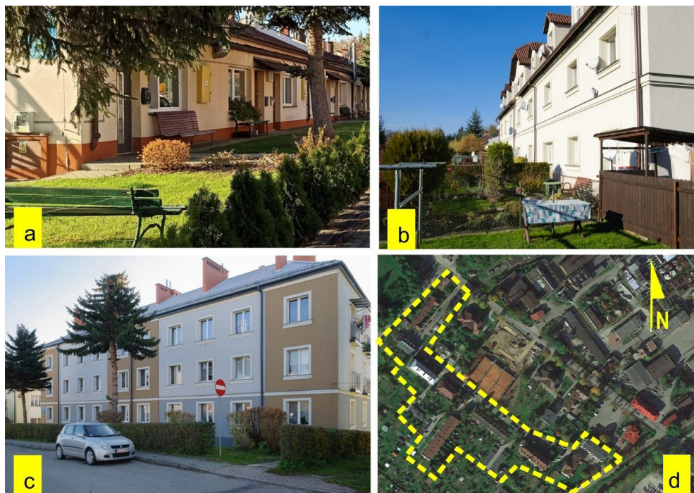
II. 3. Różnorodna typologia zabudowy mieszkalnej dla pracowników fabryki, ul. Ściegiennego.