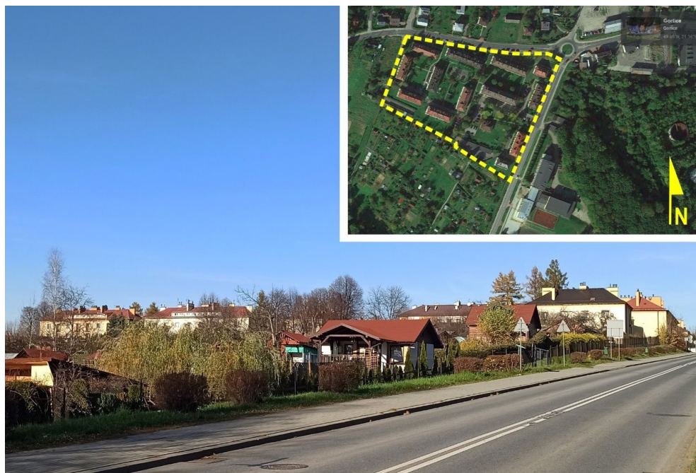
Il. 4. Widok ogródków działkowych z tzw. Osiedlem Górnym w tle. Fot. i oprac. aut.

jako miejsce upraw owoców i warzyw (zapatrzenie w żywność) oraz miejsce rekreacji czy towarzyskich spotkań (Ćmiech, 2014: 74–75).