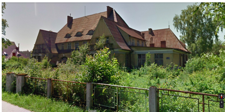
Il. 9. Widok dawnego, nieistniejącego już kasyna urzędniczego

W Gminnym Programie Rewitalizacji dla Gminy Gorlice na lata 2017–2023 stwierdzono, co następuje: „Potrzebne jest ukierunkowanie na wsparcie ożywienia miejscowych zakładów przemysłowych, jak »Glinik« i »Rafinerii«” (GPRG, 2017: 8).