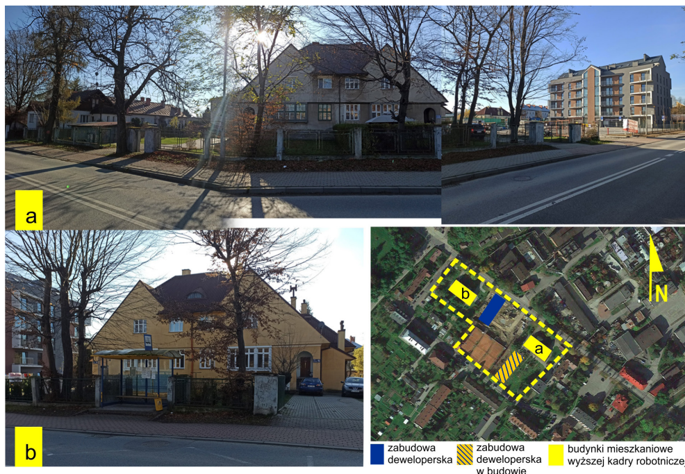
Il. 10. Widok istniejących jeszcze budynków mieszkalnych dla wyższej kadry robotniczej w sąsiedztwie nowego deweloperskiego budynku wielorodzinnego, wybudowanego na działce, gdzie wcześniej stał obiekt kasyna urzędniczego.