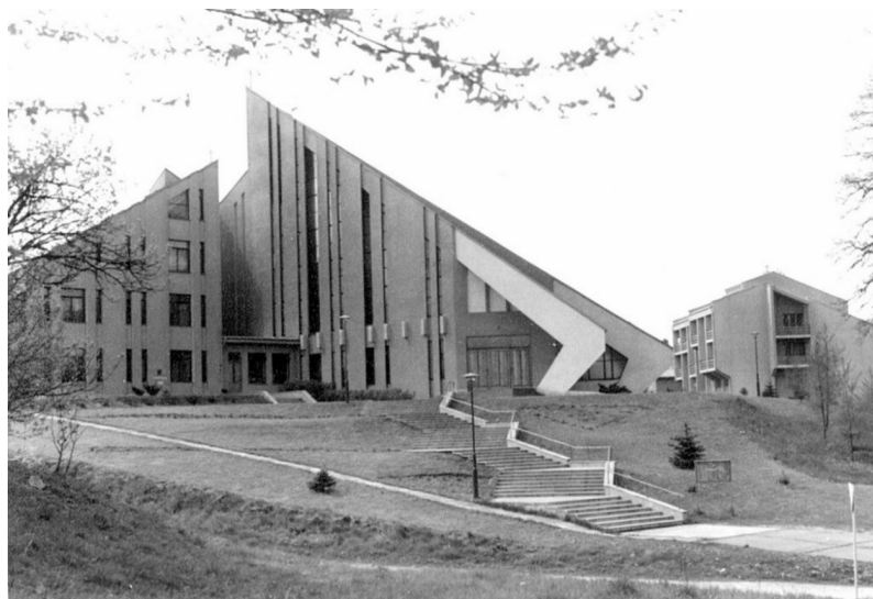
Il. 5. Zdjęcie kościoła pw. Matki Bożej Nieustającej Pomocy w Gorzowie Śląskim, u zbiegu ulic Dmowskiego, Paderwskiego i Wyszyńskiego, autor nieznan (KMBNP, 2022)