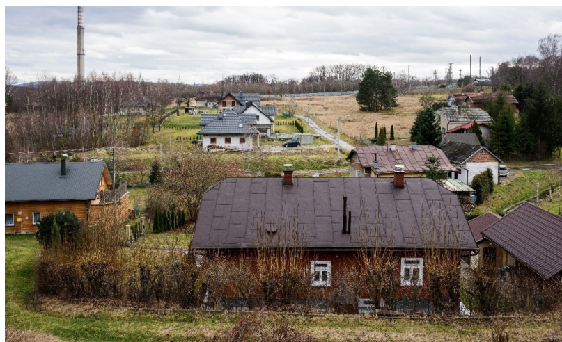
Il. 12. Widok komin elektrociepłowni oraz urządzeń rafinerii od strony wiejskich zabudowań i ul. Granicznej w północnych krańcach Glinika Mariampolskiego.

Pnąca się ku Górnemu Osiedlu ul. Wyszyńskiego zachowała urok, podobnie jak i samo osiedle wraz z sąsiadującą z nim połącją nadal funkcjonujących ogródków działkowych. Szkoła podstawowa została odnowiona i rozbudowana w nowoczesnym stylu. Osiedle i obiekty mieszkaniowe przy ul. Chopina, między ulicami: Kopernika i Krakowskiej czy też Osiedle Młodych, dziś zamieszkane w znacznym stopniu przez osoby starsze, są nadal jednymi z największych w mieście obiektów i zespołów mieszkaniowych. Tereny rekreacyjne związane ze wspomnianym parkiem miejskim czy też obiektami basenowymi pozostają w rękach miasta i stanowią niezmiennie ważne, odwiedzane przez mieszkańców atrakcje. Komin elektrociepłowni pozostaje wyrazistą dominantą lokalnego krajobrazu, widoczną z najodleglejszych krańców Gorlic i spoza miasta (il. 6).