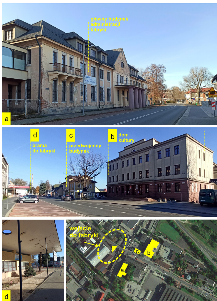
Il. 11. Widok istniejących budynków wokół dawnego wejścia do fabryki: budynek administracji (a), budynek domu kultury i zachowany budynek przyfabryczny z czasów przedwojennych (b), zadaszenie przy wejściu do fabryki (c, d), budowa z czasów powojennych.

Za jeden z efektów przyjętego kierunku działań rewitalizacyjnych wokół dawnej rafinerii naftowej uznać można podjęcie w 2022 r. całościowego remontu i renowacji budynku Gorlickiego Centrum Kultury (1956 r.), znajdującego się u zbiegu ulic ul. Józefa Michalusa i Solidarności. O tym jednak, czy inwestycja ta istotnie wpłynie na odzyskanie przez obiekt dawnego blasku, przekonać będzie można się najpewniej po dłuższym okresie trudnych, wymagających prac remontowych.