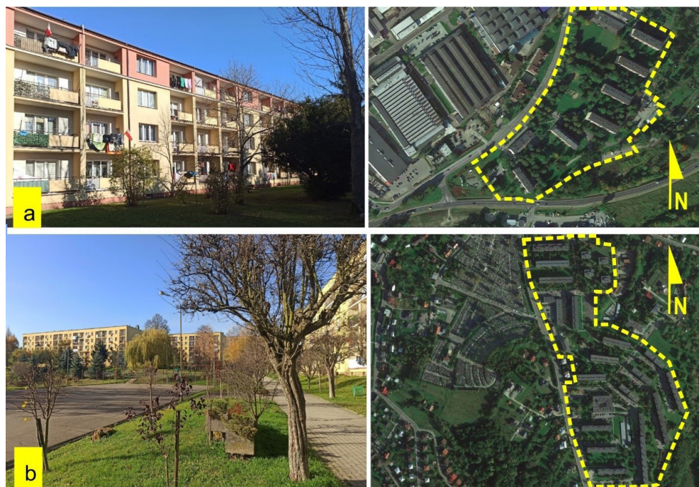
Il. 7. Widok osiedli mieszkaniowych przy ul. Fryderyka Chopina (a), oraz Krakowskiej/ Mikołaja Kopernika (b). Fot. i oprac. aut.

Przy ulicy Józefa Michalusa nieopodal fabryki powstał lokalny dom kultury. Stopniowo postępową także obszarowa ekspansja fabryki w kierunku północno-wschodnim w ramach II etapu rozbudowy. Powstały wówczas nowe obiekty technologiczne, m.in.: kuźnia,