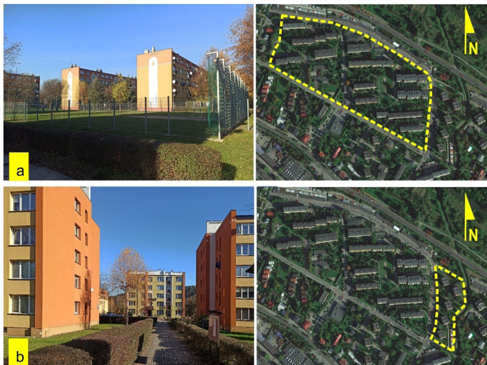
Il. 8. Widok tzw. Osiedla Młodych (a) oraz punktowców (b).

magazyn stali i elektrociepłownia (oddana do użytku w 1977 r.). W latach 80. nadal trwały także inwestycje w mieszkalnictwo, powstawały kolejne bloki, już nie tylko w samym Gliniku, ale i poza nim (np. tzw. Osiedle Młodych, wybudowane przy ul. Konopnickiej). By przyspieszyć i wspomóc procesy budowlane, jak pisze Andrzej Ćmiech, część przejętych fabryk przekształcono w „fabrykę domów”, tworzącą elementy budowlane. W latach 1971–1978 fabryka była właścicielem 1700 mieszkań (jednym z największych w kraju), a także hotelu robotniczego. W tym czasie w całej fabryce pracowało ok. 7 tys. pracowników. Władze fabryki dbały także o tworzenie przestrzeni rekreacji i w 1977–1978 oddano mieszkańcom miasta otwarte baseny publiczne oraz lodowisko. Okres świetności fabryki został jednak przerwany w latach 80., kiedy krajem zaczęły wstrząsać wydarzenia polityczne oraz piętrzące się problemy ekonomiczne (Kaliński, 2021). Wkrótce nastąpiła przemiana gospodarki zarządzanej centralnie w system rynkowy, co skutkowało olbrzymimi turbulencjami – restrukturyzacjami, zmianami własnościowymi i zwolnieniami (Ćmiech, 2014: 138–147).