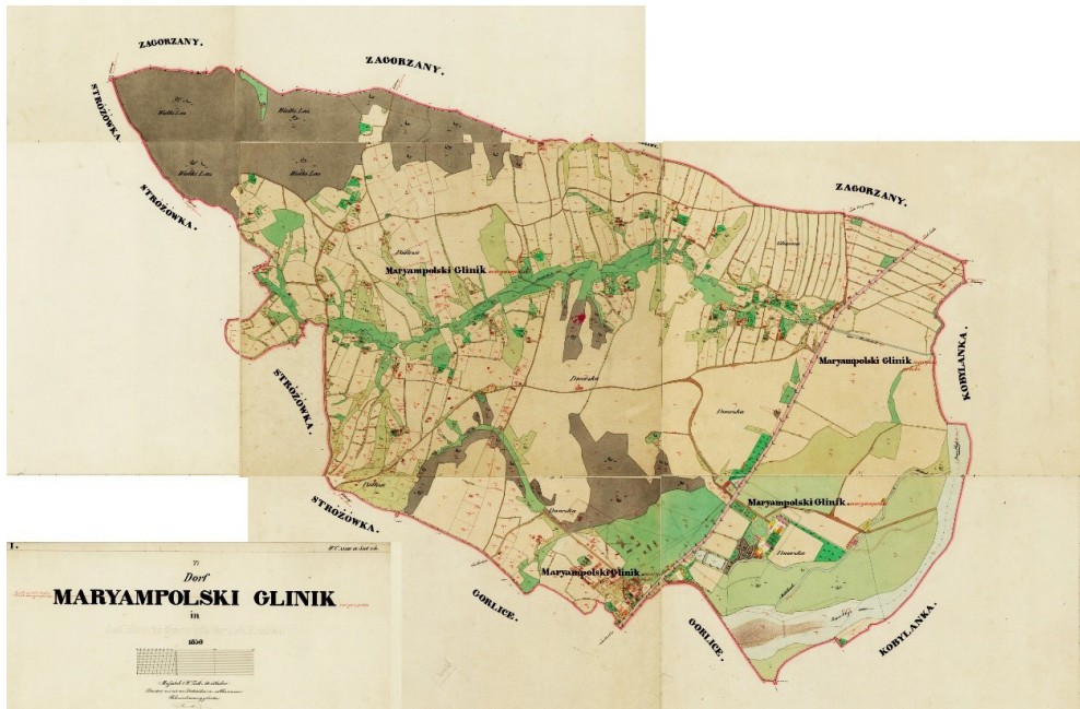
Il. 1. Widok mapy Glinika Mariampolskiego z 1850 r. (APP, b.d.). Oprac. aut.

Przeprowadzone badanie oparto na przeglądzie dostępnych danych: literatury przedmiotu, dostępnych archiwalnych i współczesnych materiałów kartograficznych i ikonograficznych, zdjęć lotniczych wykonanych w latach między 1966–2022 oraz ortofotomap istniejących w zasobach platformy internetowej Geoportalu Krajowego oraz Małopolskiej Infrastruktury Informacji Przestrzennej (MIIP) dla okresu 2003–2022. Dokonano także przeglądu dostępnych opracowań planistycznych (bieżącego i archiwalnego studium, zapisów tekstowej i graficznej części planu miejscowego, w zakresie dotyczącym Glinika).