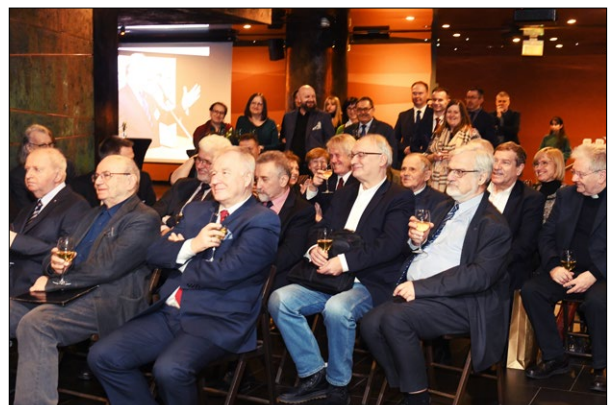
Ryc. 7. Goście uroczystości – rodzina, profesorowie, konserwatorzy, przyjaciele