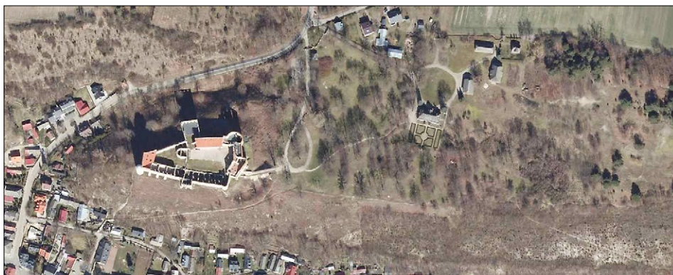
Ryc. 5. Zdjęcie lotnicze rezydencji w Janowcu i jej otoczenia, po prawej stronie widoczny rozległy płaskowyż, translokowany dwór z Moniaki z odtworzonym ogrodem oraz niewielki skansen; źródło: https://polska.geoportal2.pl/map/www/mapa.php?mapa=polska (dostęp: 30 V 2022)