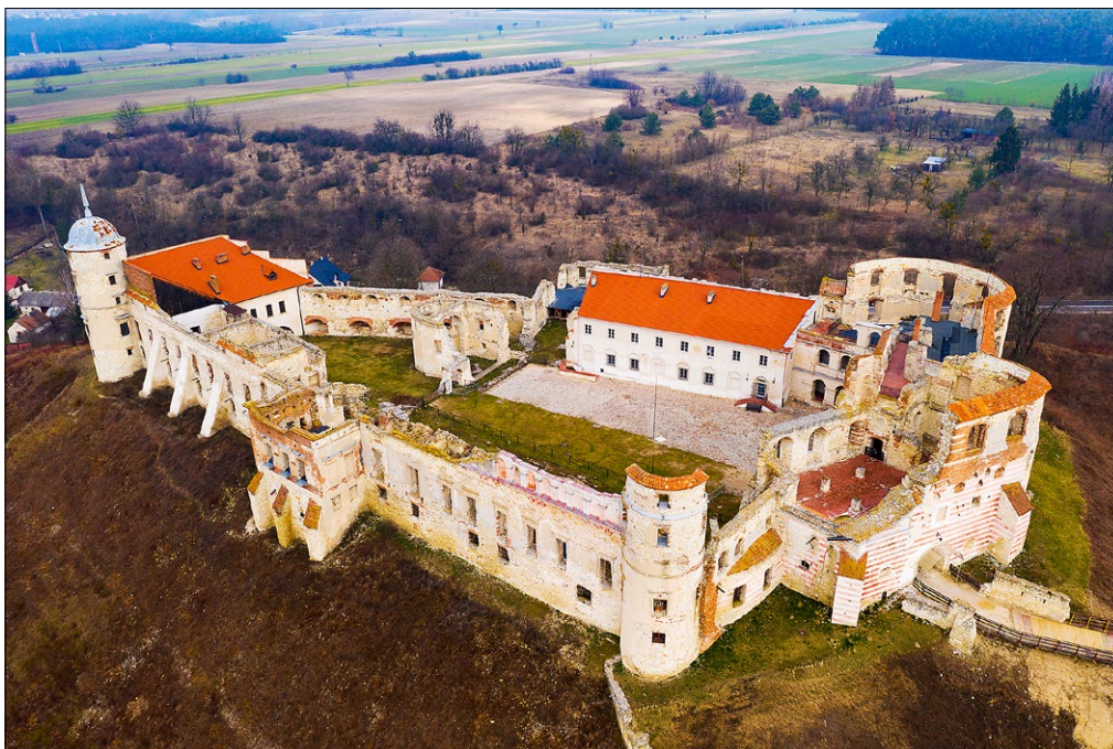
Ryc. 1. Widok ruin zamku w Janowcu (zdjęcie współczesne)