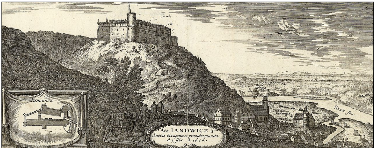
Ryc. 2. Panorama Janowca z poł. XVII w. wg Erika Dalhbergha