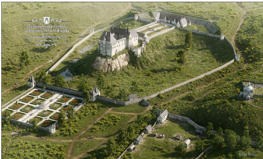
Ryc. 4. Wizualizacja ogrodu u podnóża zamku w Pińczowie wg Mateusza Staniszewskiego; źródło: http://www.zamekpińczow.pl/pages/show.php?m=2&u=02 (dostęp: 30 V 2022)