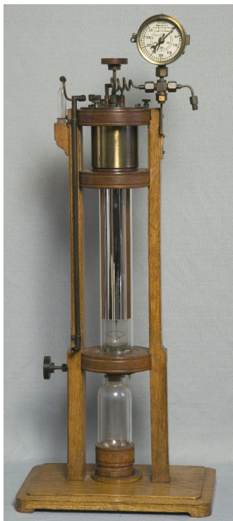
Rys. 3. Aparat do skraplania powietrza i wodoru – Muzeum UJ

W 1884 roku Olszewski podjął próby skroplenia wodoru, określił jego temperaturę i ciśnienie krytyczne. W roku 1885 otrzymał wodór w stanie dynamicznym (w postaci mgły), trwającym tylko chwilę. Pełnego skroplenia wodoru w formie statycznej dokonał w 1898 roku znany szkocki fizykochemik J. Dewar. Z kolei w 1895 roku Olszewski skroplił próbkę argonu, przesłaną przez znanego brytyjskiego chemika i fizyka Williama Ramsaya. W tym samym roku, po odkryciu helu, Ramsay ponownie poprosił Olszewskiego o jego skroplenie. Mimo że Olszewski zajmował się tym problemem przez wiele lat, prace zakończyły się niepowodzeniem. Skroplenie helu udało się dopiero w 1908 roku holenderskiemu fizykowi Heikemu Kamerlinghowi Onnesowi (1853–1926).