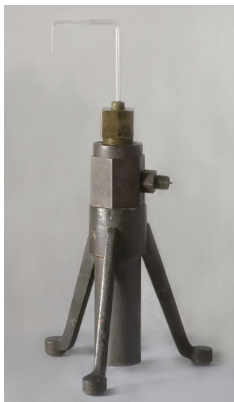
Rys. 2. Kopia aparatu Cailleteta do skraplania tlenu – Muzeum UJ

W latach 1880–1882, w ramach stypendium przyznanego mu przez Akademię Umiejętności w Krakowie, Wróblewski odbył liczne podróże naukowe do Francji