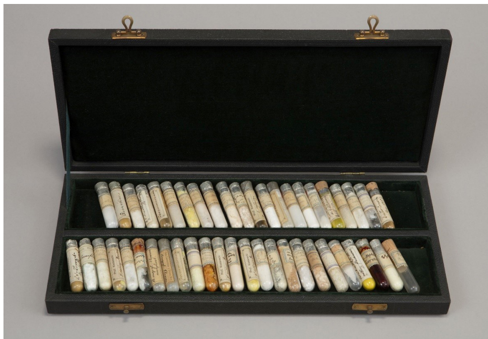
Rys. 5. Kasetka Kostaneckiego z zestawem barwników – Muzeum UJ

W 1888 roku, po śmierci Emila Czjrniańskiego, władze Uniwersytetu Jagiellońskiego zaproponowały Kostaneckiemu objęcie kierownictwa Katedry Chemii Organicznej. Niestety zgoda ministerstwa na tę nominację przeciągała się i w tej sytuacji 28-letni naukowiec przyjął w roku 1890 propozycję objęcia kierownictwa Katedry Chemii Organicznej na Uniwersytecie w Bernie w Szwajcarii, gdzie pracował do przedwczesnej śmierci.