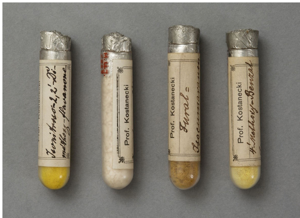
Rys. 6. Fiolki z próbkami barwników otrzymanych przez prof. Kostaneckiego – Muzeum UJ