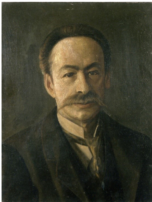
Rys. 4. Portret Karola Olszewskiego – Muzeum UJ

Uniwersytecie Lwowskim początkowo teologię, następnie nauki matematyczno-przyrodnicze, między innymi u profesora Bronisława Radziszewskiego. W roku 1882 doktoryzował się z chemii, a dwa lata później habilitował. W latach 1882–1884 pracował na Uniwersytecie Lwowskim jako asystent Radziszewskiego, a następnie na stanowisku docenta chemii organicznej. W roku 1891 Schramm został powołany na stanowisko profesora nowo utworzonej Katedry Chemii II (potem chemii organicznej) Uniwersytetu Jagiellońskiego, którą od podstaw zorganizował.