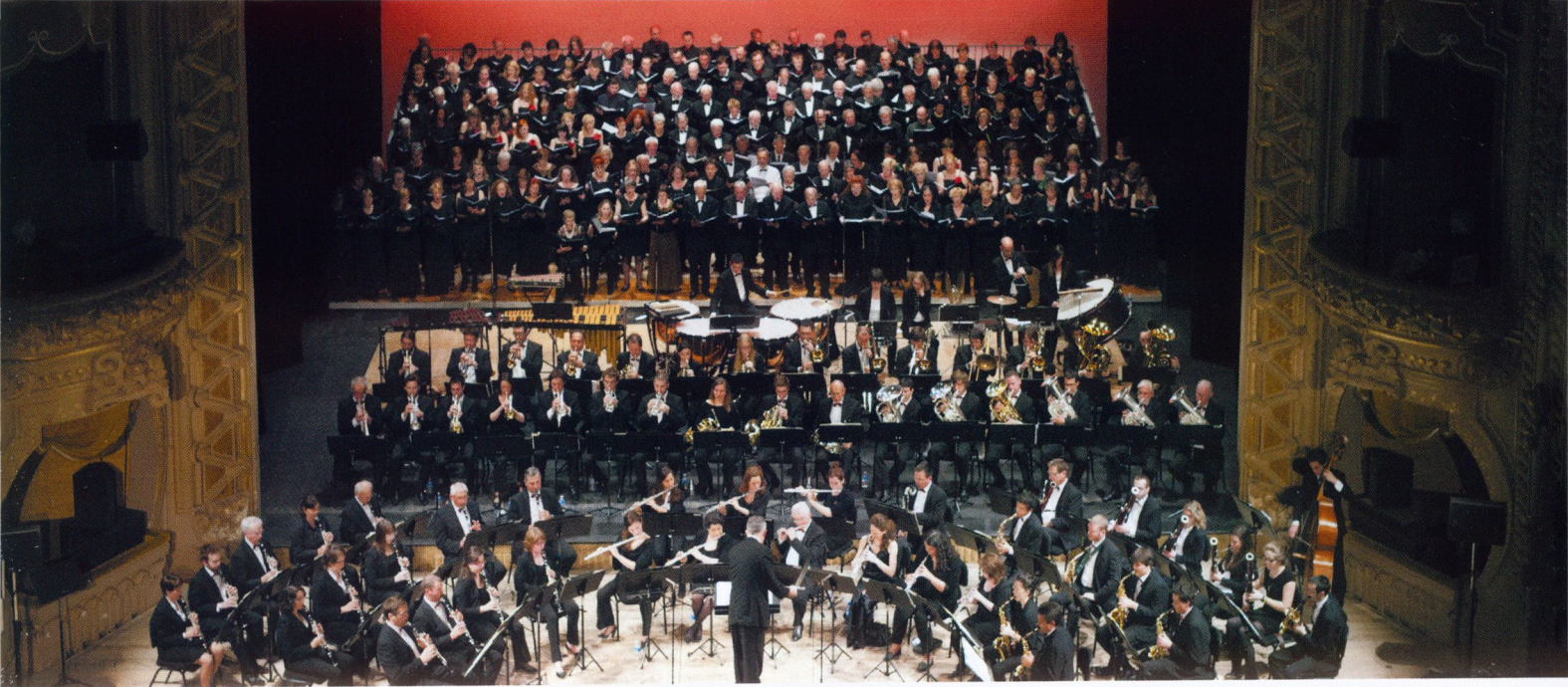
■ Opera w Vichy, chóry: „Cantata”, „Madrygal” z Legnicy oraz „Ensemble Vocal de Roanne”. 2014

Działalność artystyczna Akademickiego Chóru Politechniki Krakowskiej „Cantata” sprawia, że obcowanie z muzyką i śpiewem bardzo mocno wpływa na człowieka. Uszlachetnia go i uwrażliwia, otwiera jego serce oraz umysł, rozwija wyobraźnię. Dzięki Wam w naszą akademicką techniczną codzienność wplata się piękno, które niesie w sobie muzyka. Bogaty i różnorodny repertuar, zawsze po mistrzowsku wykonany, wzrusza nas, zachwyca i pozostawia w pamięci niezapomniane wrażenia.