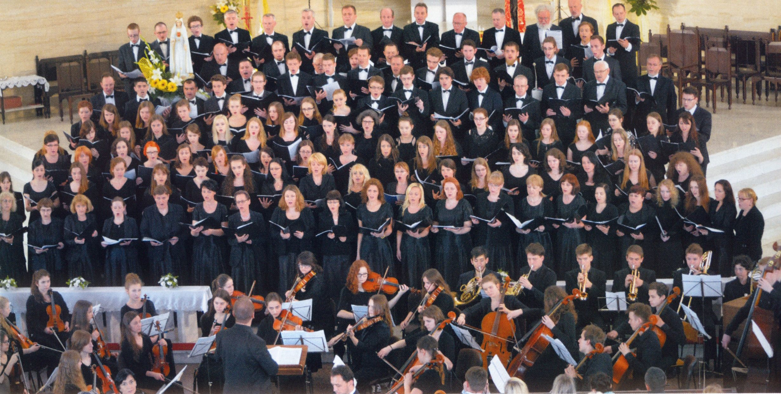
■ Koncert w ramach cyklu „Koncerty Mistrzejowickie” - „Requiem” G. Faure, Kraków, 2015