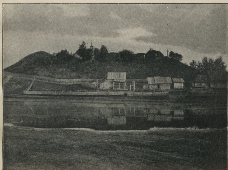
Rys. 10. Pile w Popielanach, na nim cmentarz.