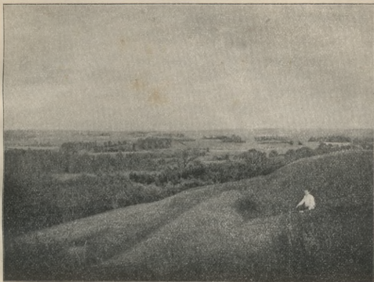
Rys. 7. Warownia na Girźducie (z prawej strony wzniesienie warowni, z lewej wał).