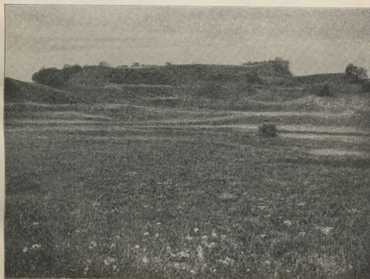
Rys. 8. Pile pod Chorążyszkami obok Medwiagoly. Z prawej strony przedśionalek tarasowaty.