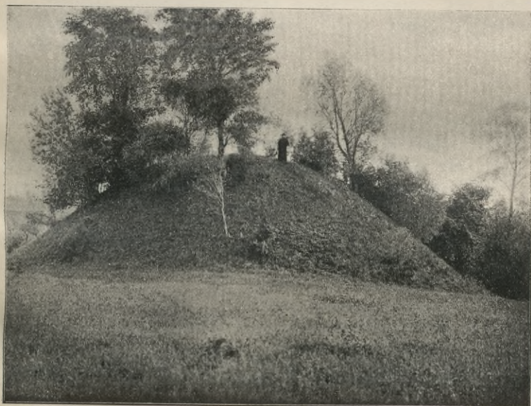
Rys. 6. Pile w Podewajciach (widok przodu, poza którym sypanka spuszcza się długim wzgórzem po pochyłości pasma nadrzecznej.)