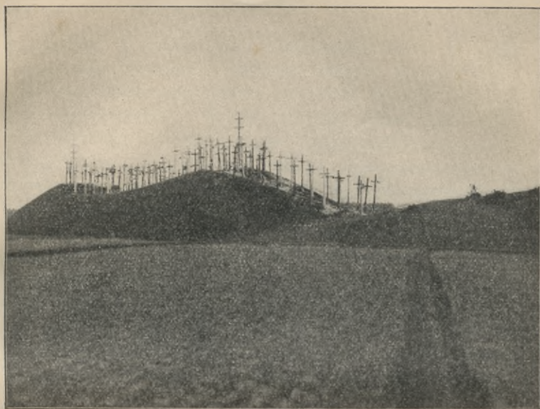
Rys. 1. Pile na gruntach wsi Jurgajcie, zwane Świętą Górą.