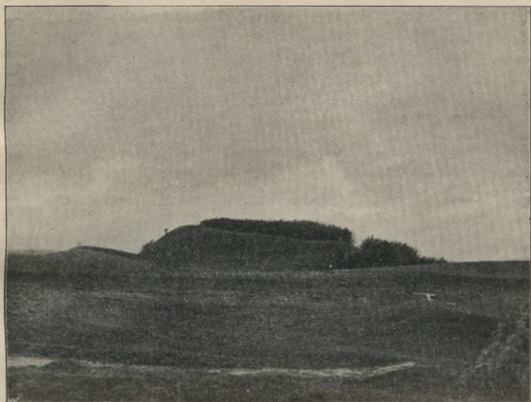
Rys. 9. Pile w Trejgach.