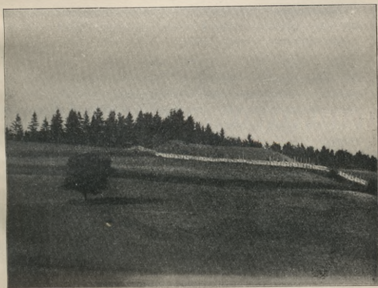
Rys. 4. Pile na drodze z Worń do Twer pod Lejbiszkami.