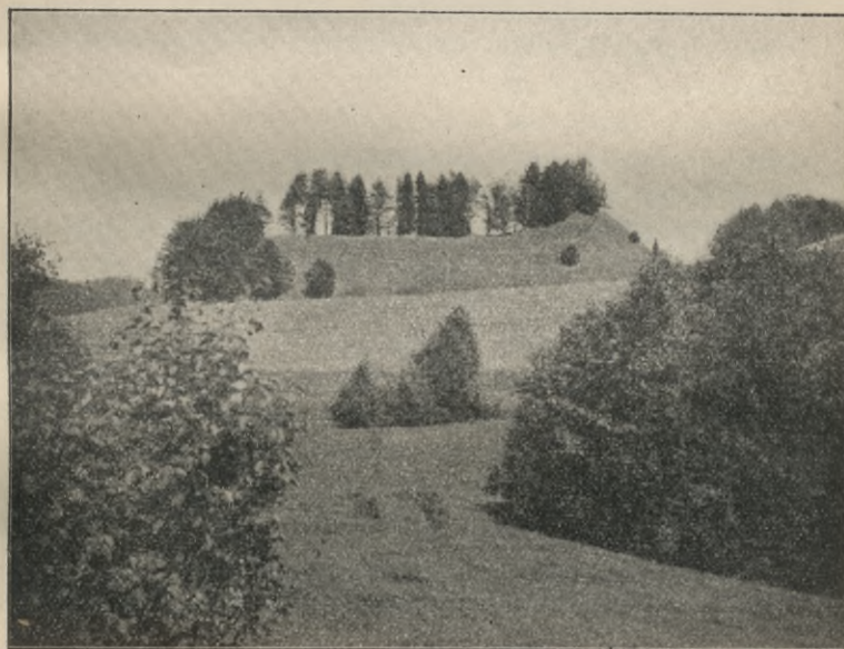
Rys. 2 Pile w Bubiach.