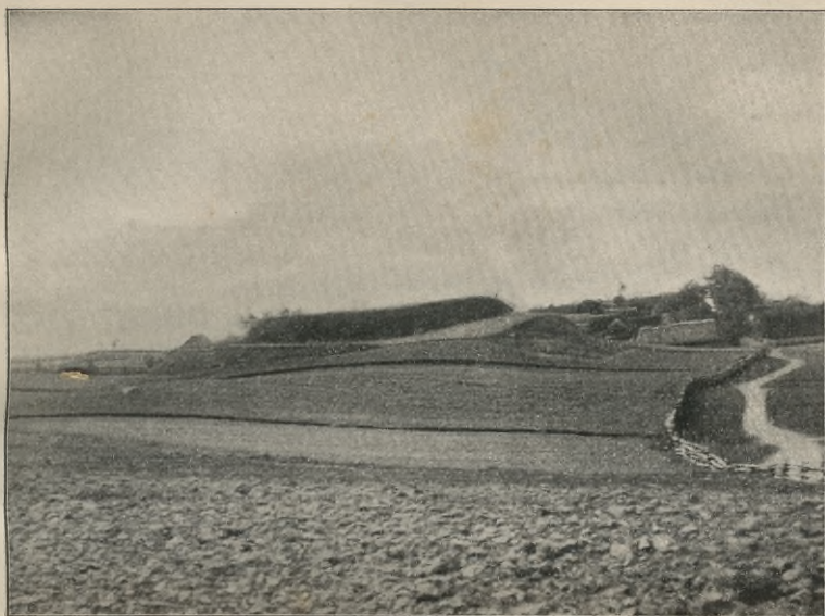
Rys. 5. Pile pod wsią Geigole.