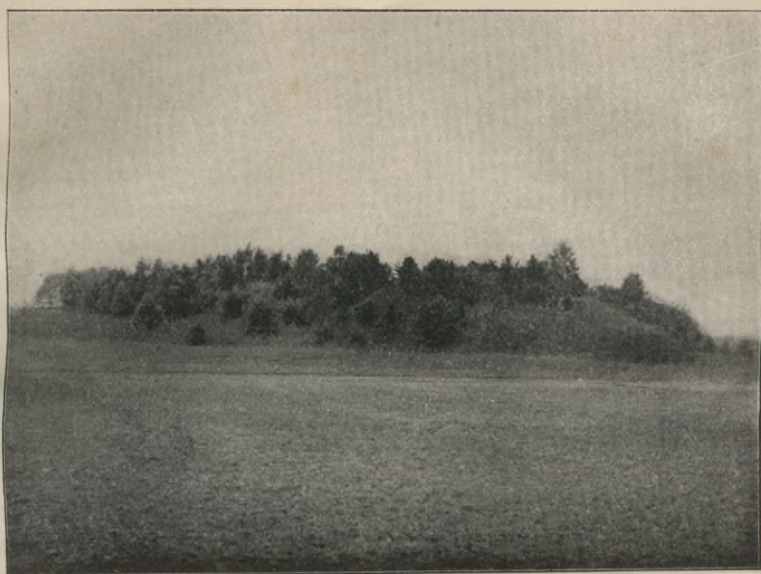
Rys. 3. Wzgórze na gruntach folwarku Spokojność pod Szawkianami, część jego prawa odcięta na pile.