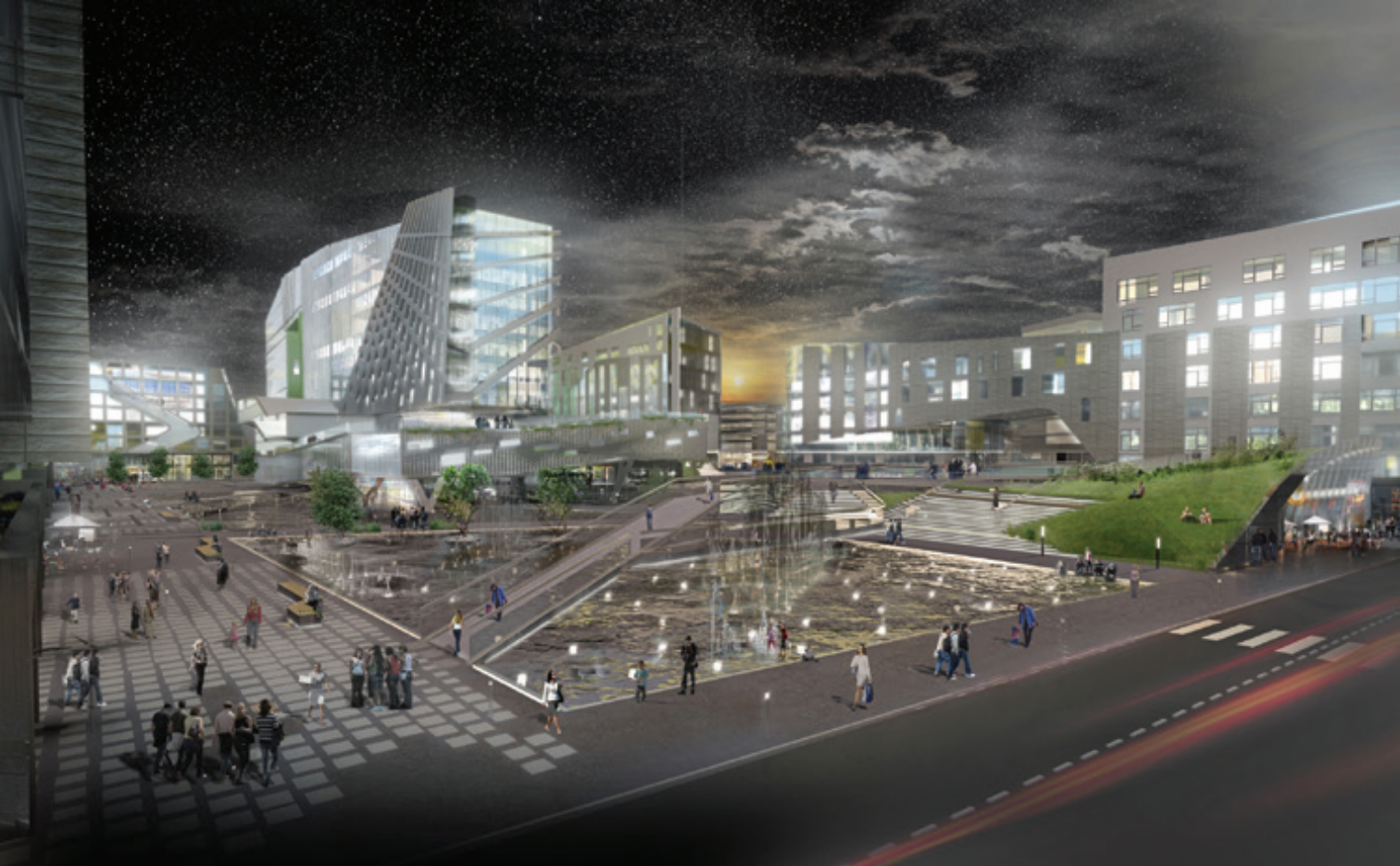
Il. 2. Widok na plac Kazimierza Wielkiego, dzielnica Wola, Warszawa; dyplom magisterski WAPW (2013), Tomasz Kamiński / View of Casimir the Great Square, the district of Wola, Warsaw; FAWUT Master's diploma (2013), Tomasz Kamiński

będzie zależało od mieszkańców, do których przecież jutro będzie należało naprawdę całe miasto.