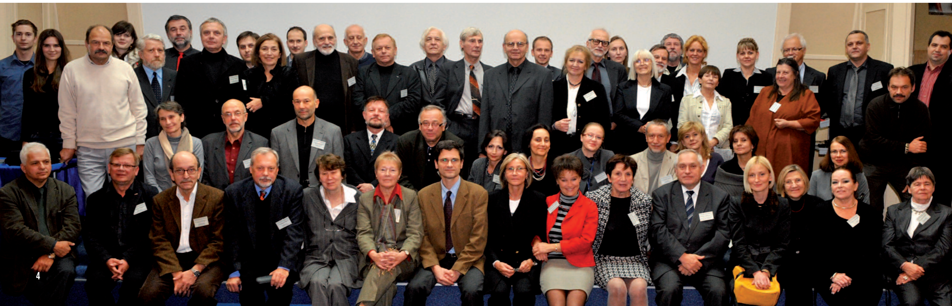
Participants in the Third Scientific Meeting in Zakopane 2009