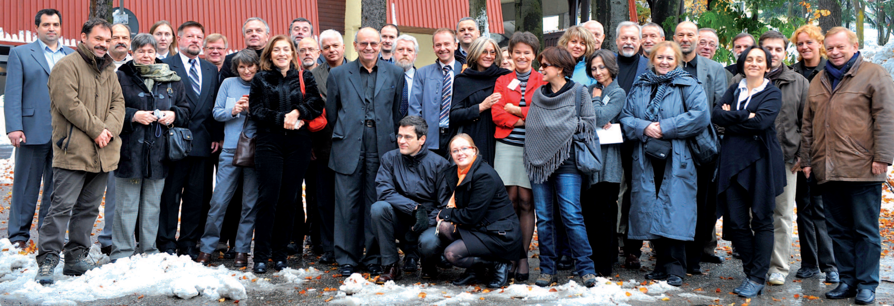
Uczestnicy Trzecich zakopiaskich spotkań naukowych – 2009