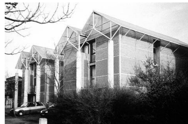
Nowoczesne osiedle mieszkaniowe „Domaine de la Terre” – zespół zabudowy szeregowej, L'Isle d'Abeau k. Lyonu (Francja) A modern residential complex „Domaine de la Terre” – a row of houses in L'Isle d'Abeau near Lyon, France fot. Lignon