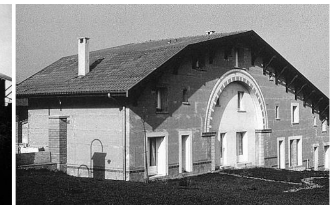
Budynek typu semi-collective w osiedlu mieszkaniowym „Domaine de la Terre” w L'Isle d'Abeau k. Lyonu (Francja) A building of the semi-collective type in a residential complex „Domaine de la Terre” in L'Isle d'Abeau near Lyon, France