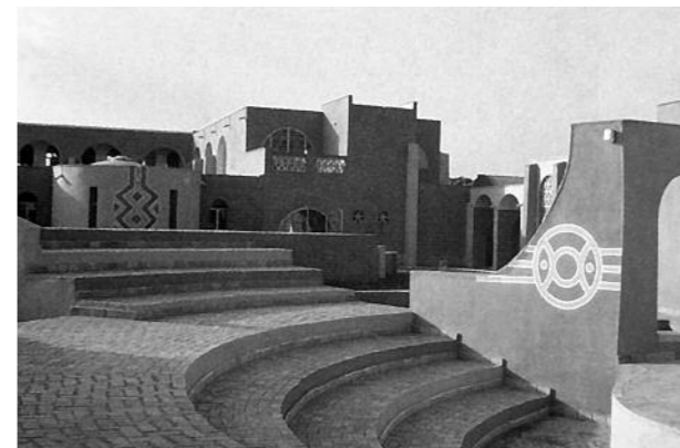
Centrum kulturalno-edukacyjne na wyspie Bali A cultural and educational centre on the island of Bali