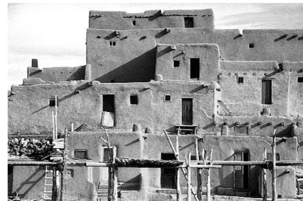
Tradycyjne indiańskie „bioklimatyczne” pueblo w Taos – stan Nowy Meksyk (USA) A traditional Indian „bioclimatic” pueblo in Taos, New Mexico (the USA)

Earth (clay) as a healthy, recyclable, low-energy raw material which does not devastate the environment technologically is likely to become the building material of the twenty-first century.