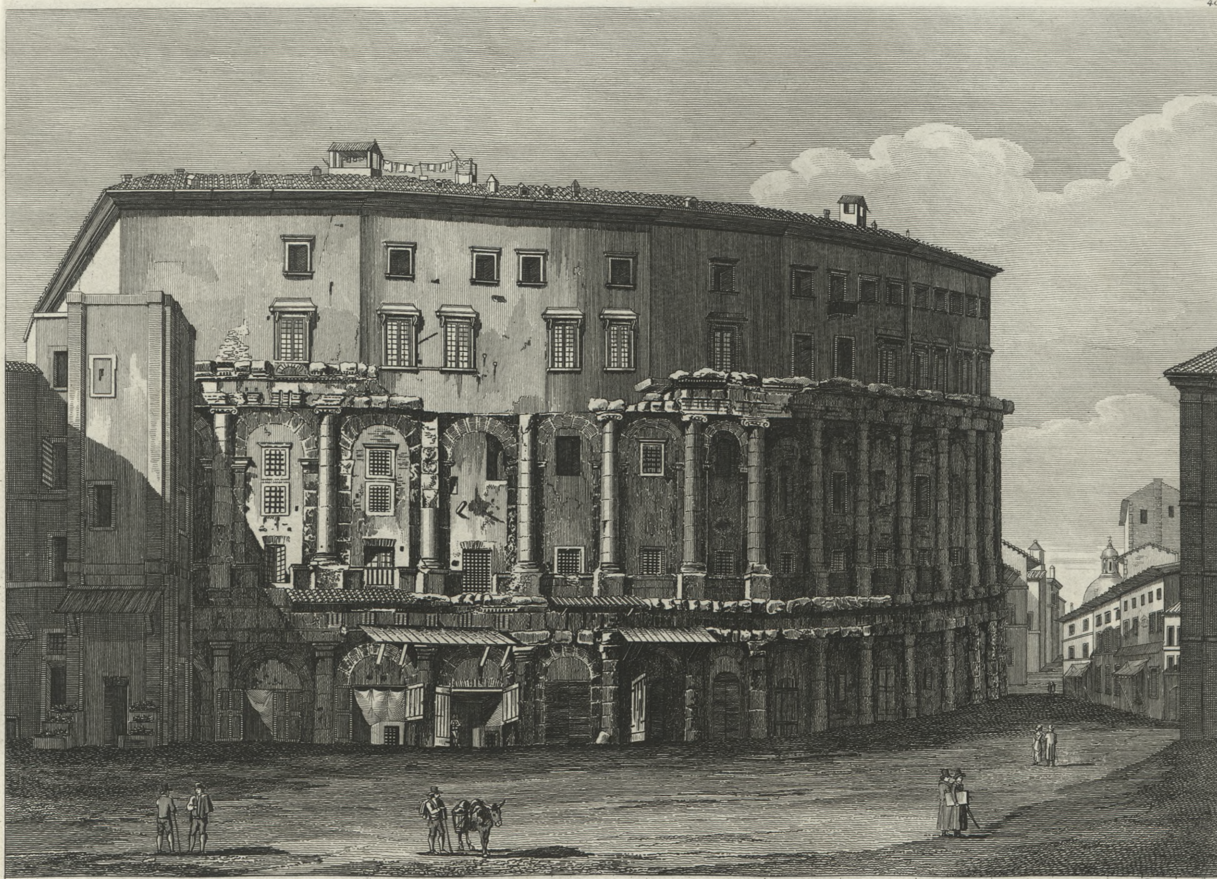
Teatro di Marcello, in oggi Palazzo Orsini