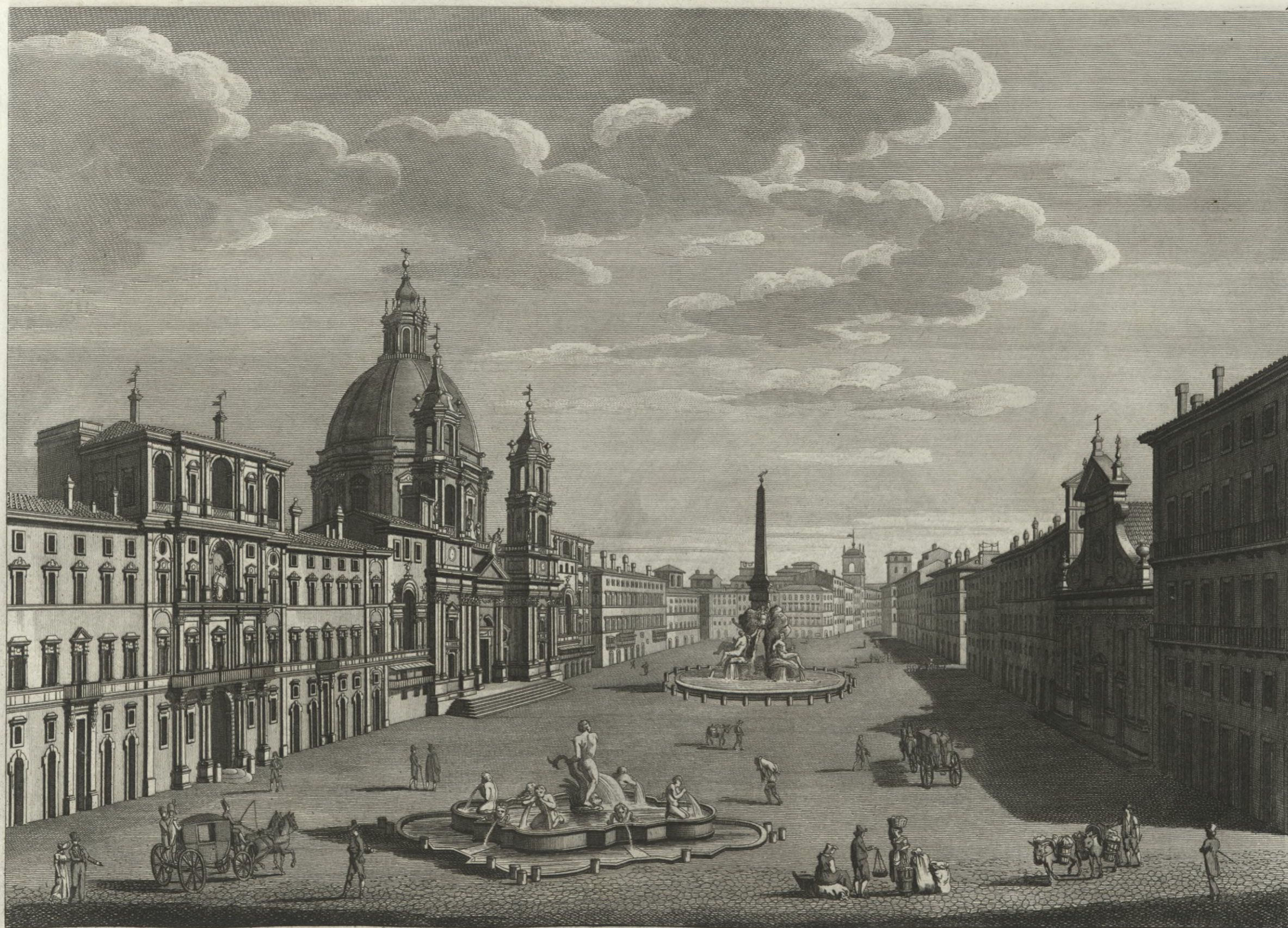
Veduta della gran Piazza Navona, ov' era anticamente il famoso Circo Agonale fatto da Alessandro Severo, che quivi presso aveva le sue Terme. Vue de la grande Place Navone qui étoit anciennement le fameux Cirque Agonale, proche duquel Alexandre Sèvre avoit ses Thermes.