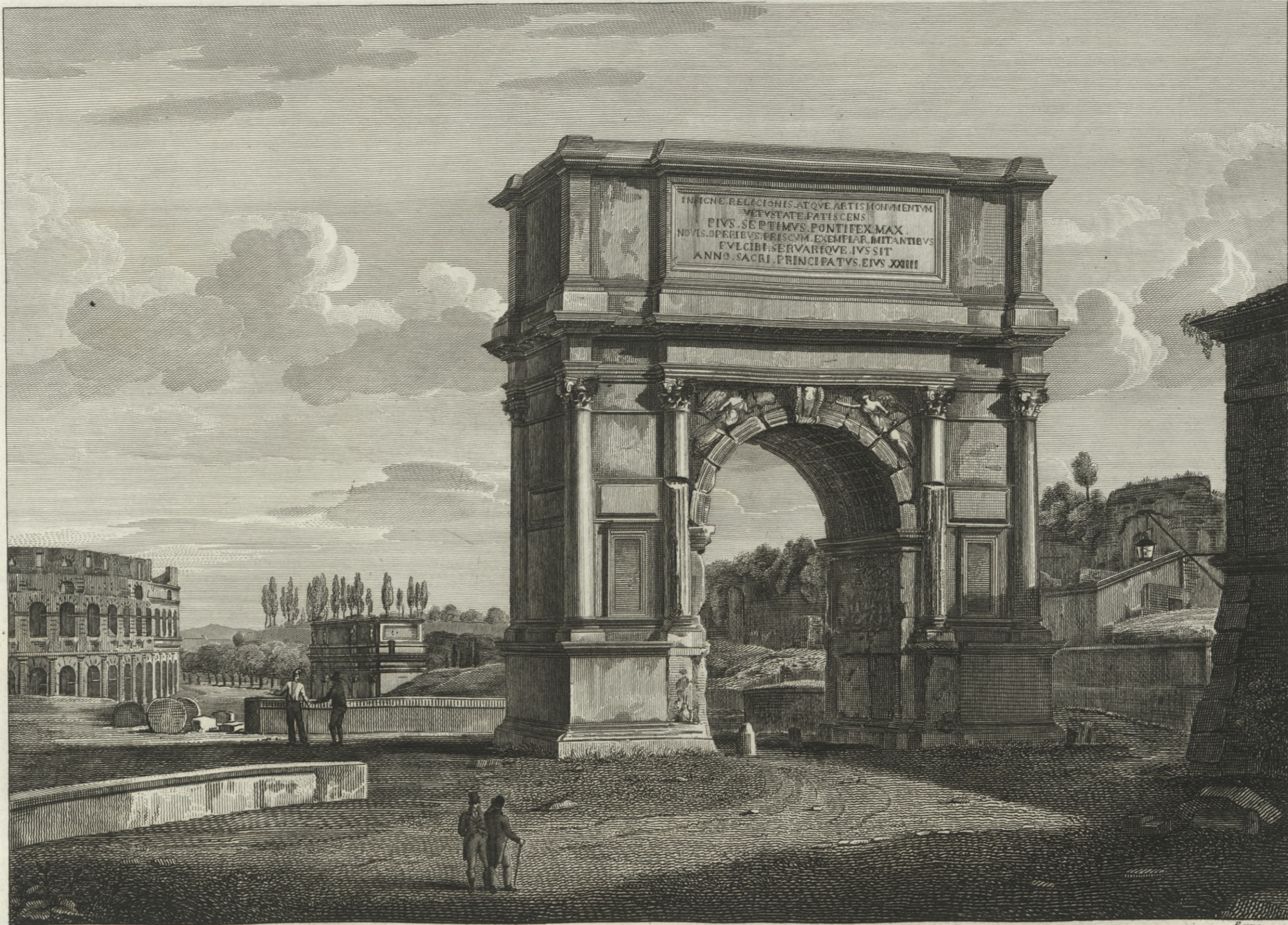
Veduta dell' Arco di Tito Ristaurato, e ridotto alla pristina forma.