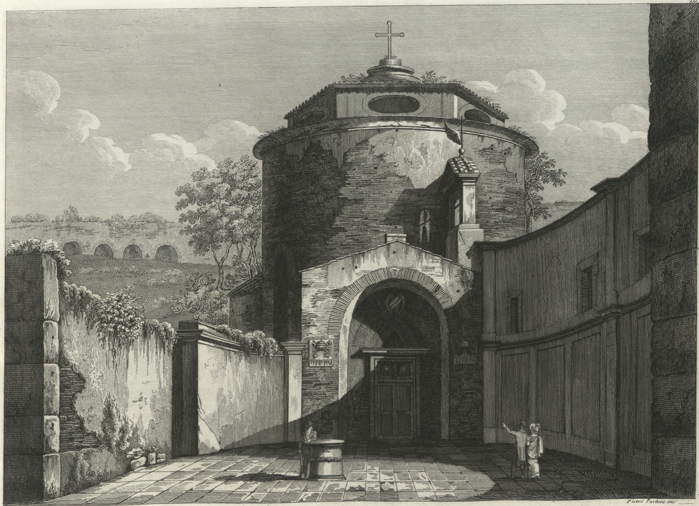
Tempio di Romolo oggi Chiesa di S. Teodoro