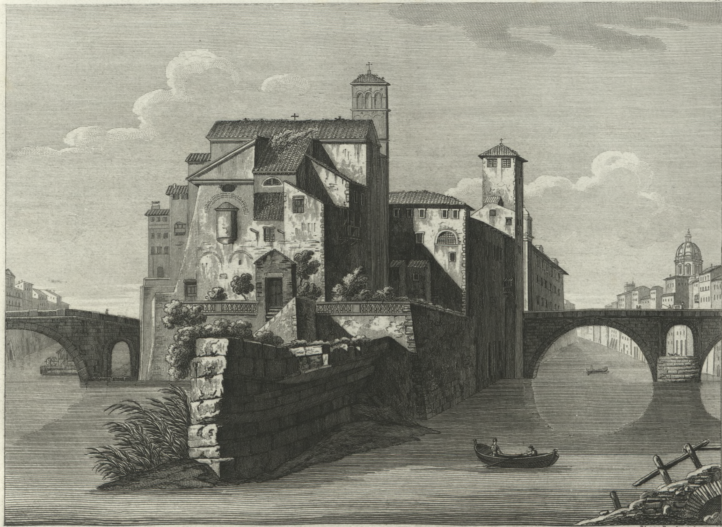
Veduta dell' Isola Tiberina