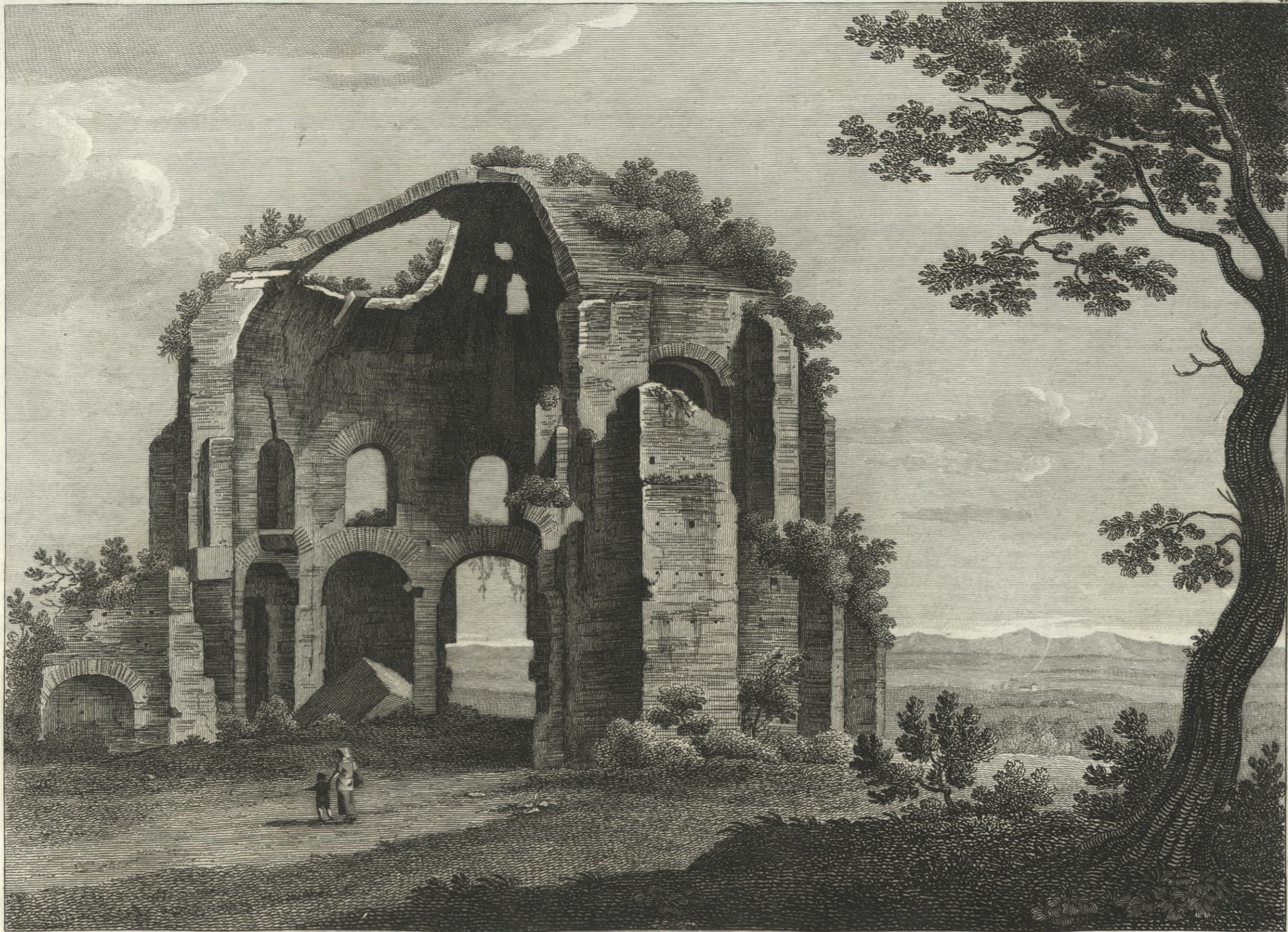
Veduta del Tempio di Minerva Medica, così creduto per essere quivi stata ritrovata, oltre molte altre, la celebre Statua di questa Dea.