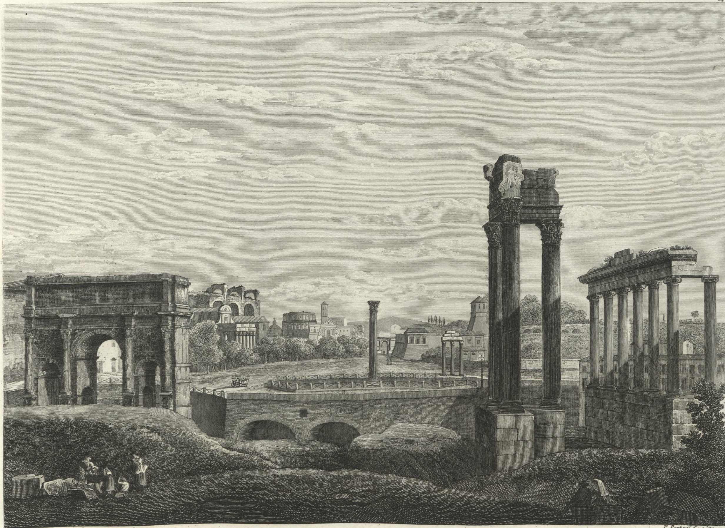
Veduta dell'antico Foro Romano volgarmente detto Campo Vaccino, ove si ammirano gli avanzi degli antichi Edifizii che lo circondavano. } Vue de l'ancien Forum Romain vulgairement Campo Vaccino, ou on admire les ruines des anciens Edifices qui l'entouraient. }

In Roma presso G. Antonelli in Piazza di Sciarra N. 255.