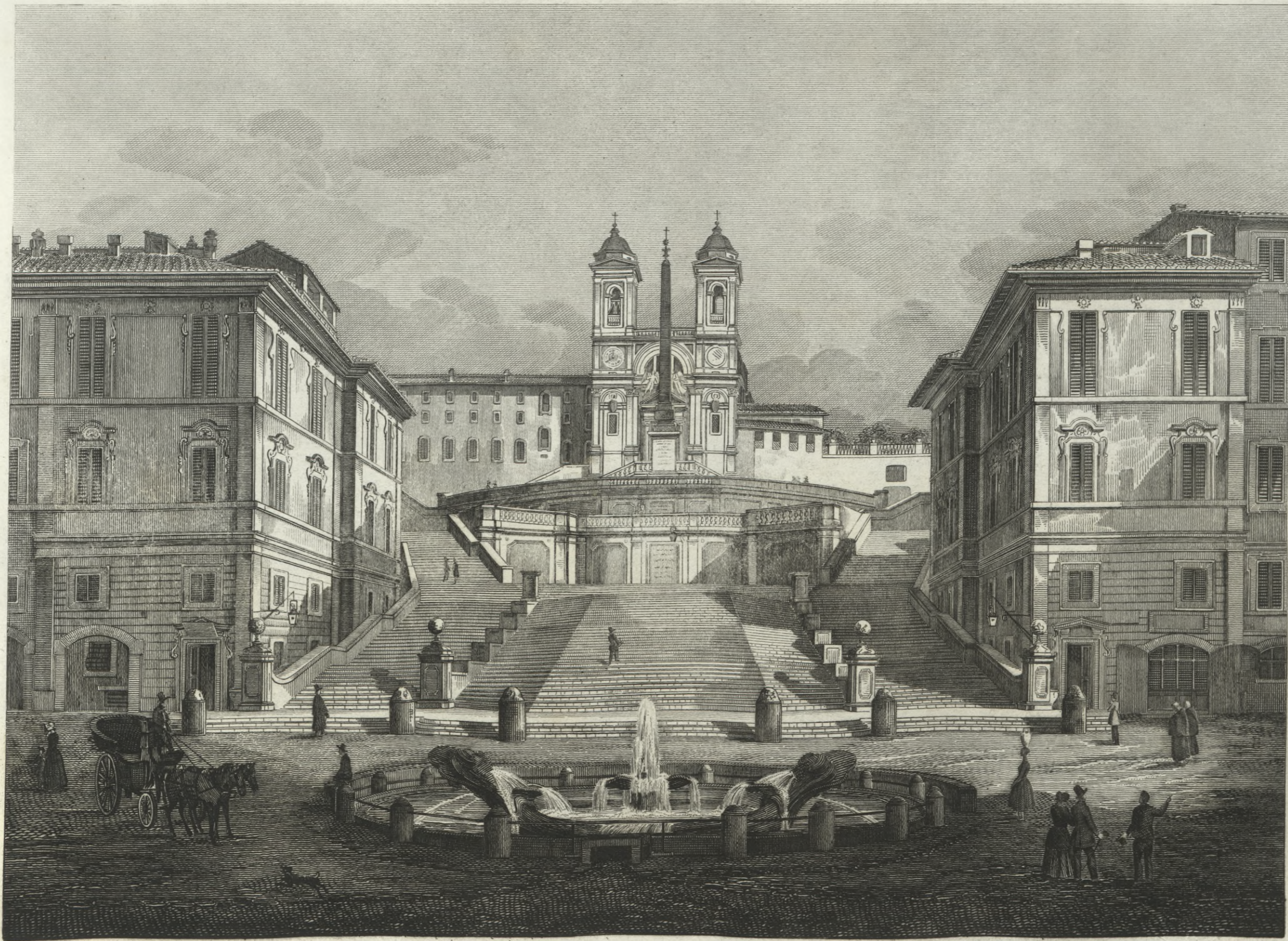
Piazza di Spagna.