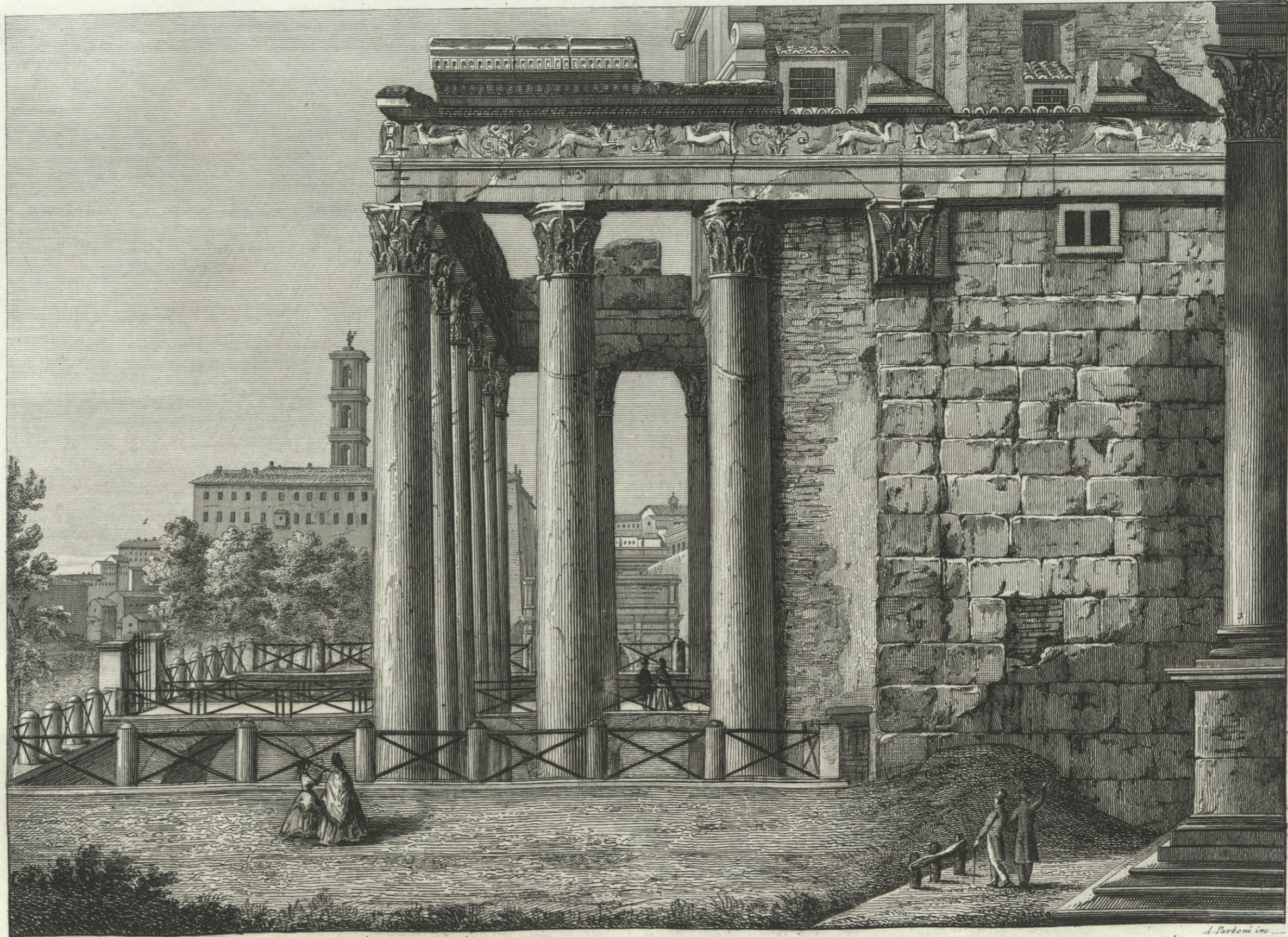
Tempio d'Antonino e Faustina oggi Chiesa di S. Lorenzo in Miranda.