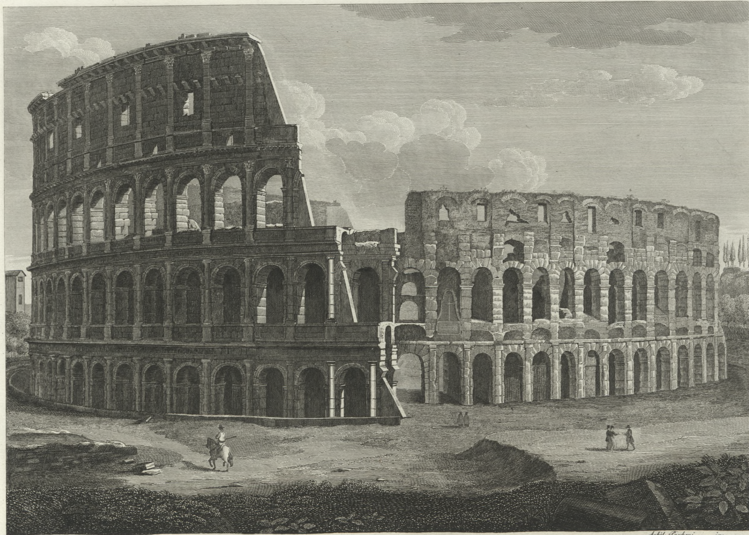
Viſta dell' Anfiteatro Flavio detto il Colosseo, eretto dall' Imp. o Flavio Vespasiano nei Giardini di Nerone l' Anno 72. dell' Era volgare.