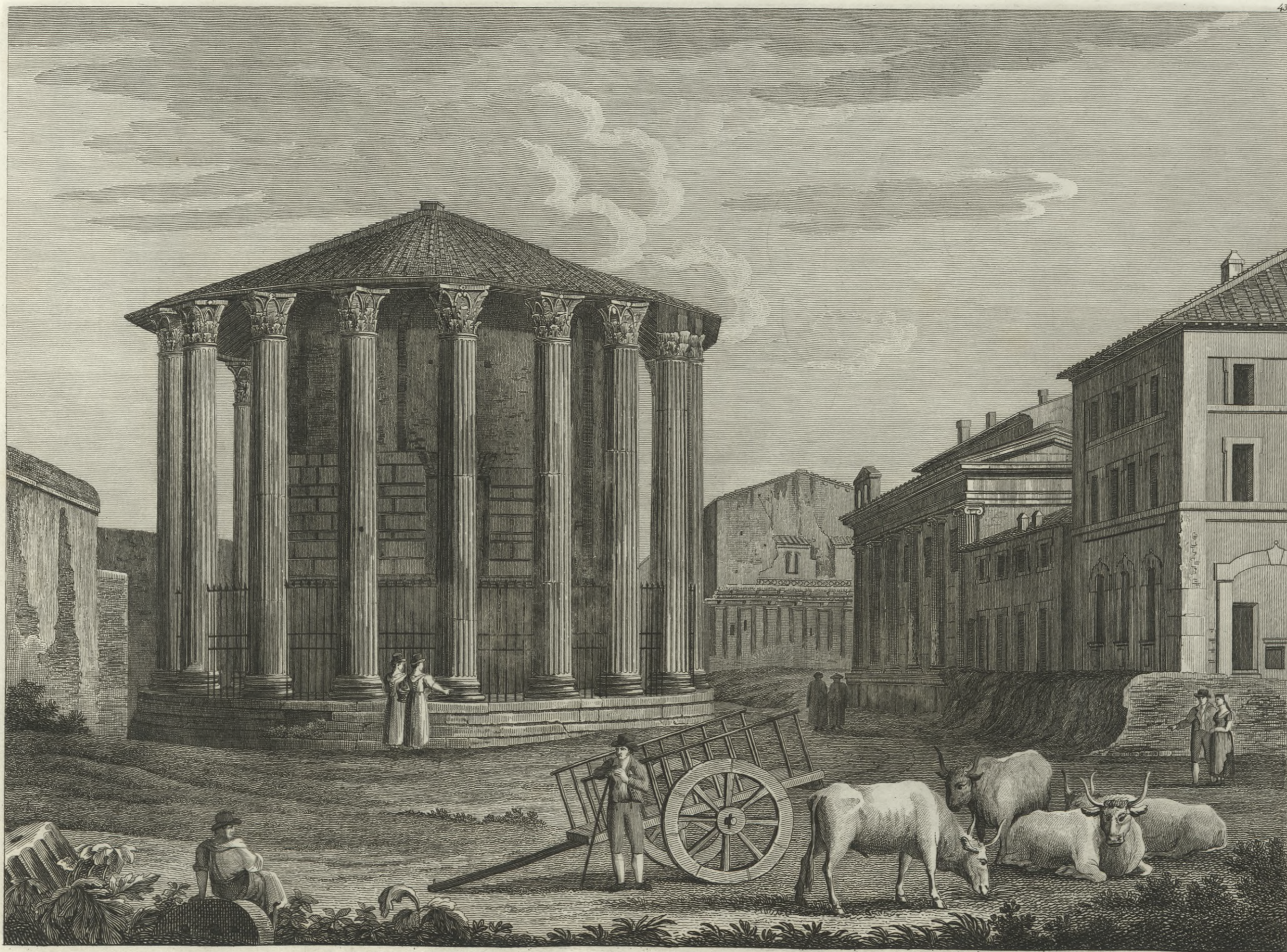
Veduta del Tempio d'Ercole volgarmente detto Tempio di Vesta.