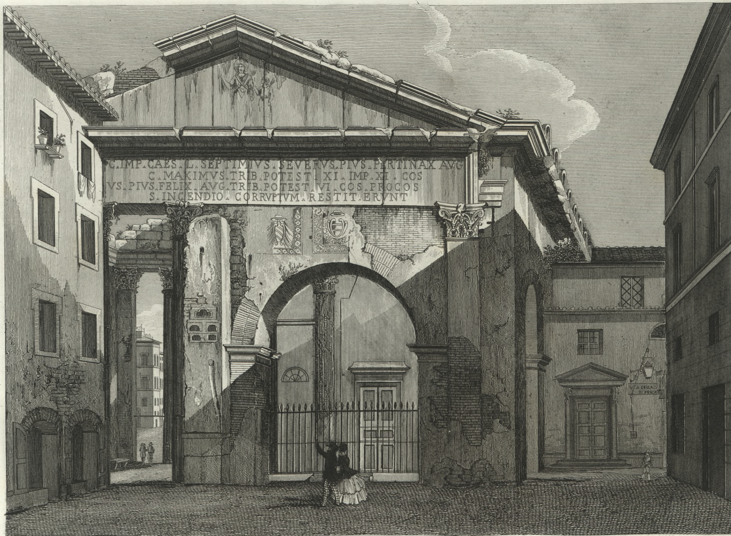
Portico di Ottavia.