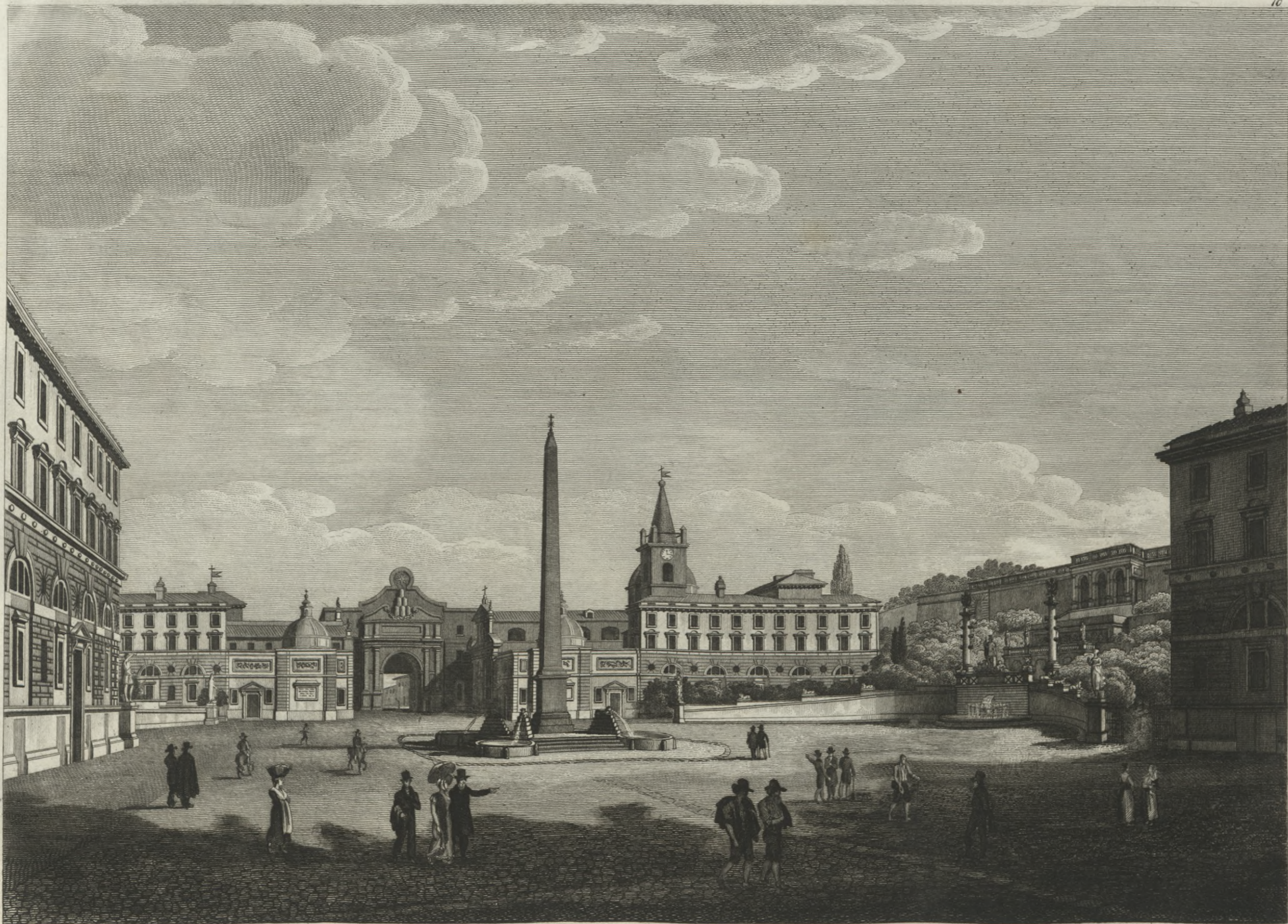
Veduta della Piazza del Popolo.