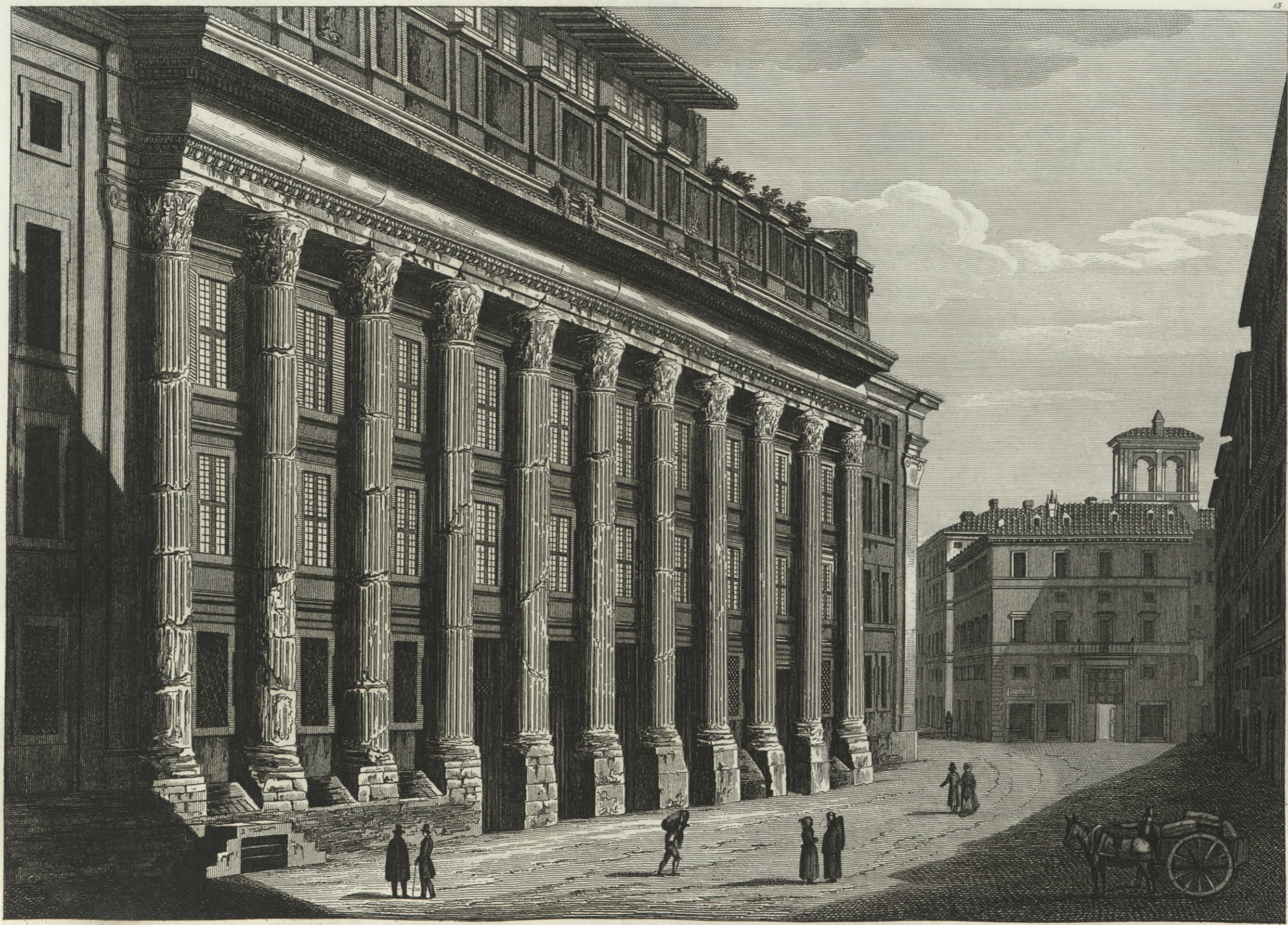
Tempio di Marco Aurelio Antonino.