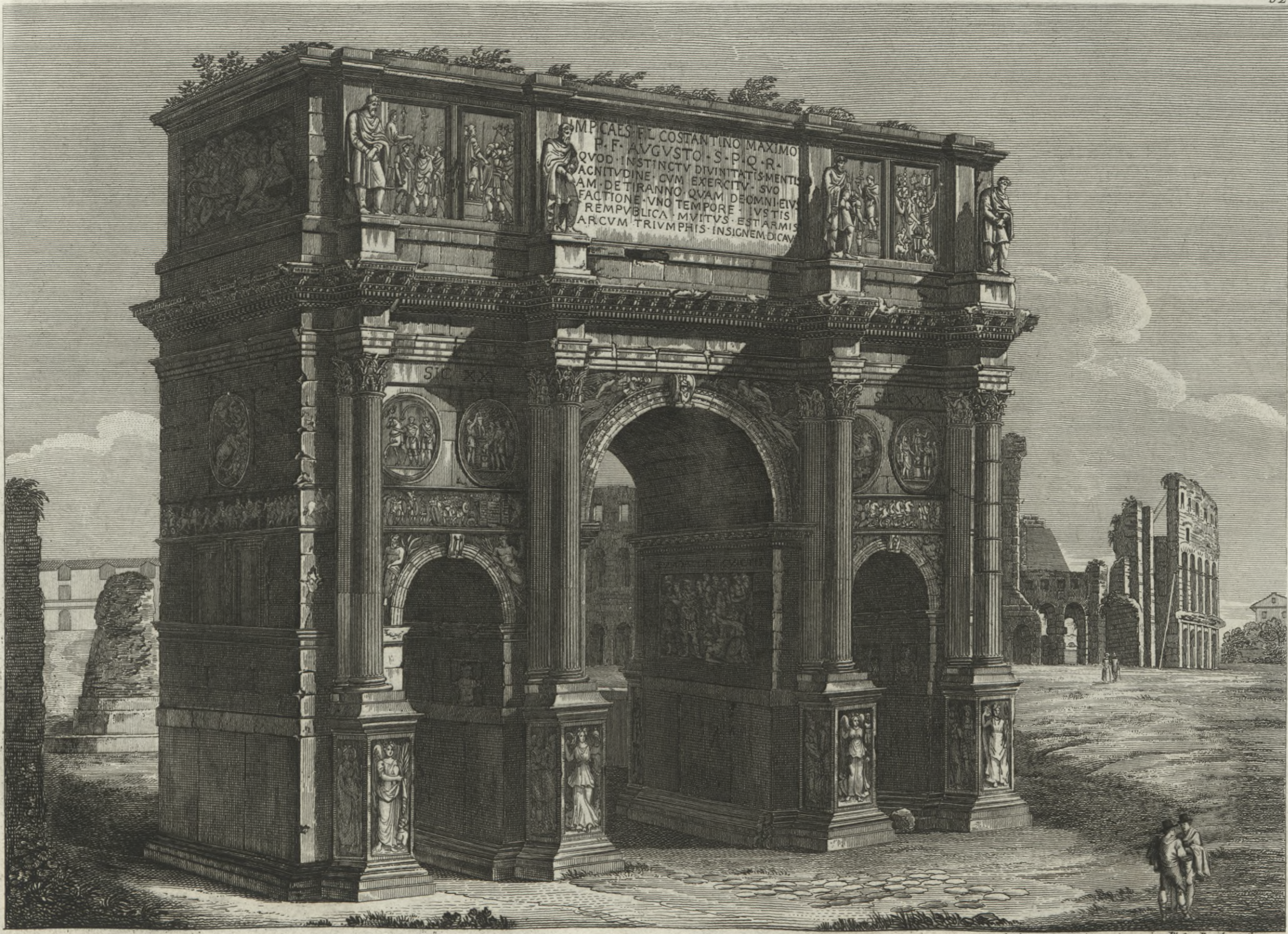
Veduta dell'Arco di Costantino