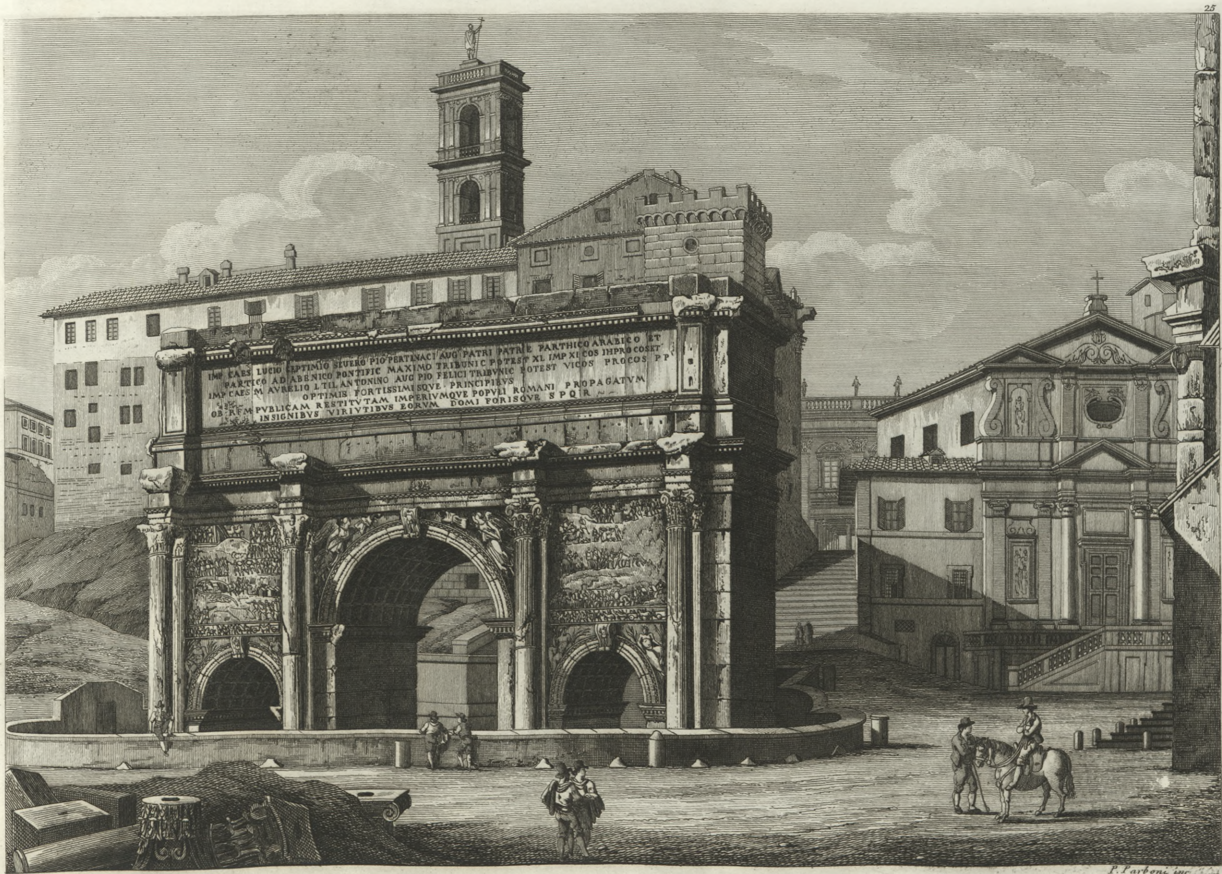
Veduta dell'Arco di Settimio Severo.