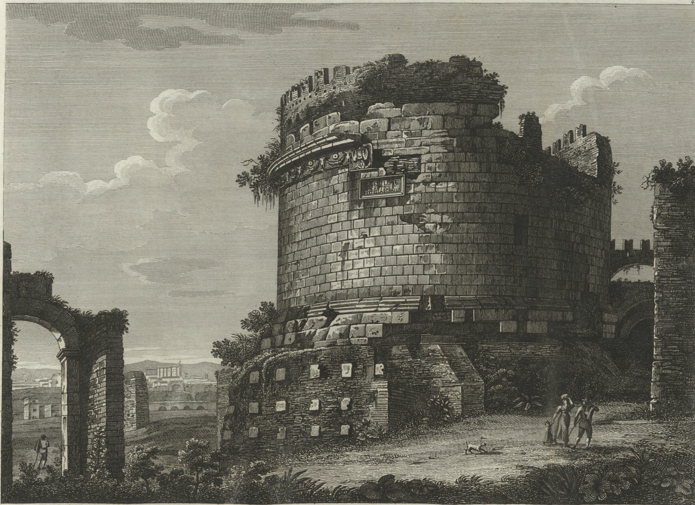
Veduta del Sepolcro di Cecilia Metella detto Capo di Bove eretto da Crasso suo Marito per conservare le di lei ceneri