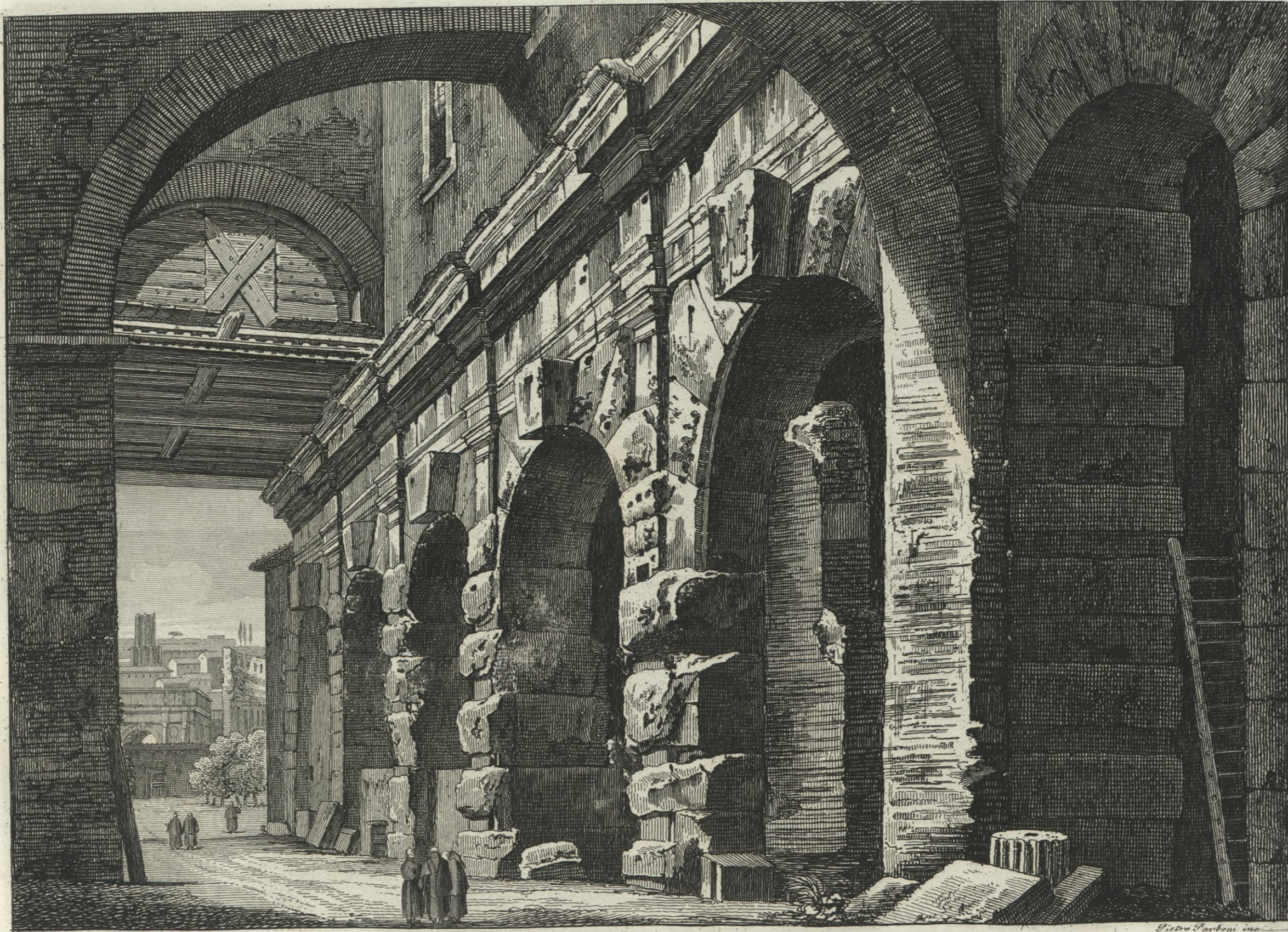
Sorbatojo per le Fiere ad uso de' spettacoli del Colosseo detto la Curia Ostilia.