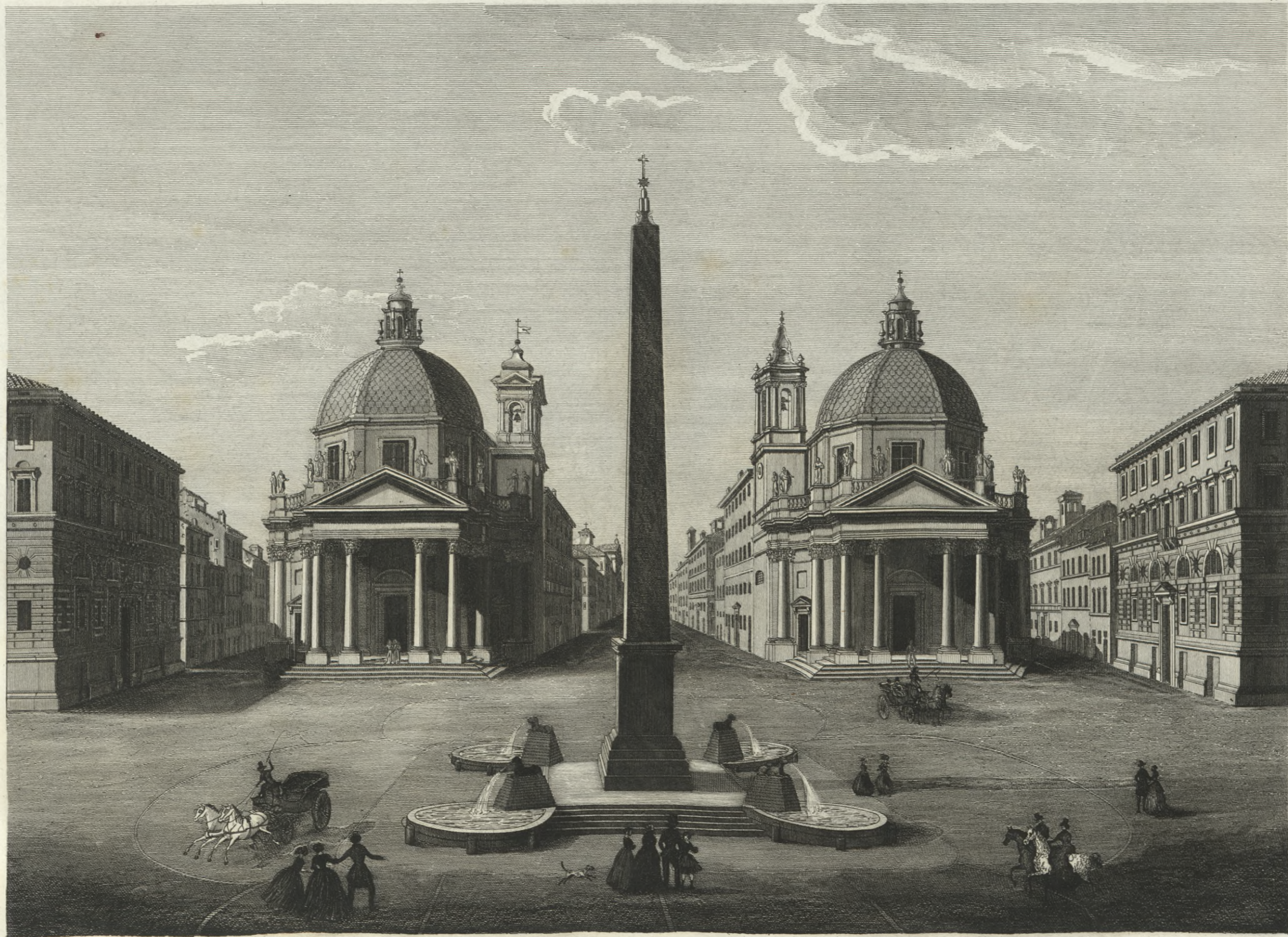
Veduta della Piazza del Popolo