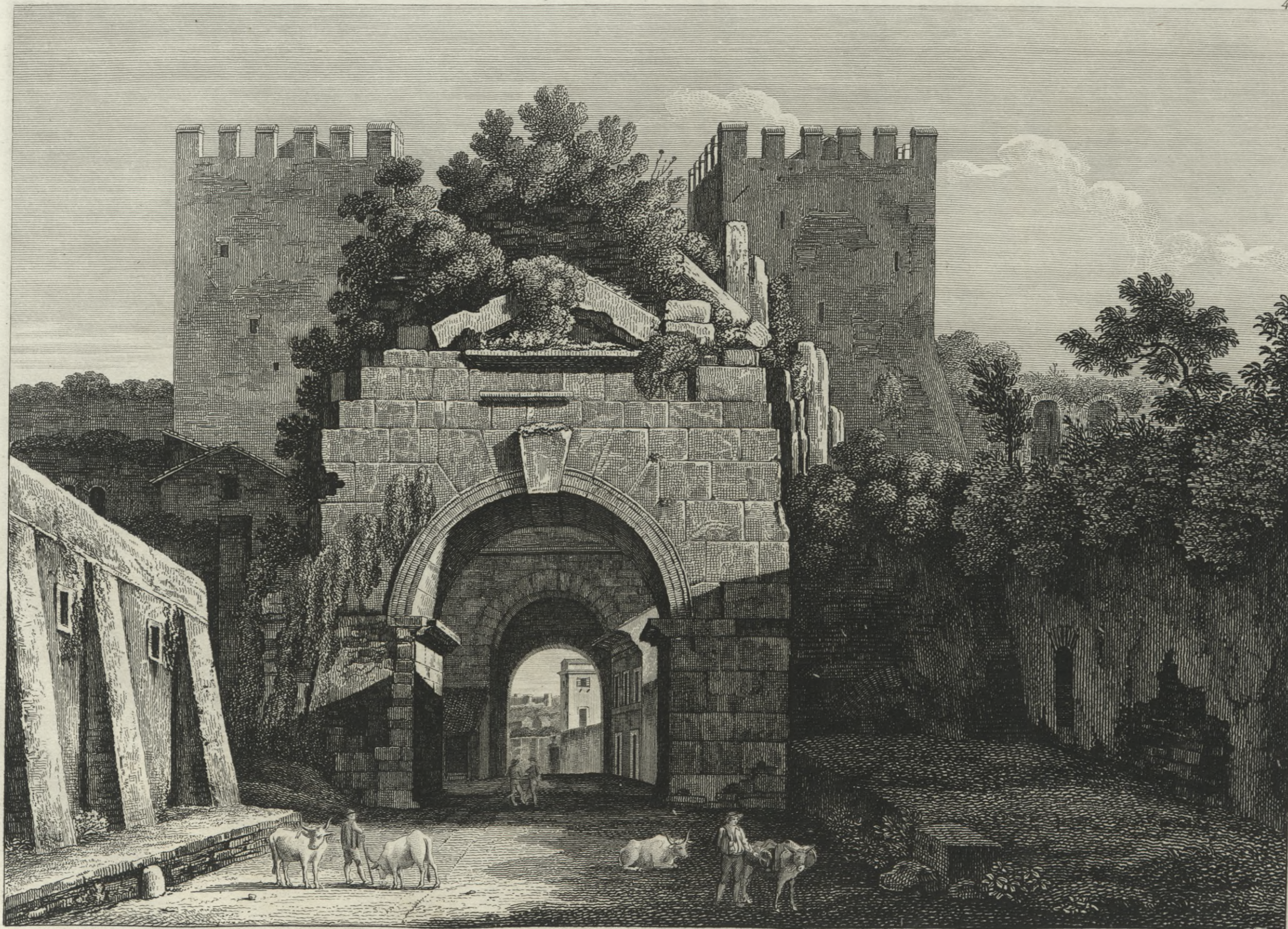
Veduta dell' Arco di Druso dalla Città.

In Roma presso Giac. Antonelli in Pia. di S. Maria N. 233