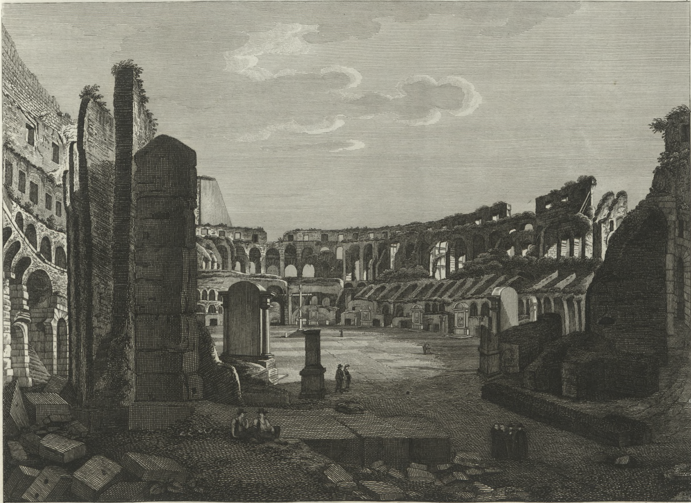
Veduta dell' interno del Colosseo