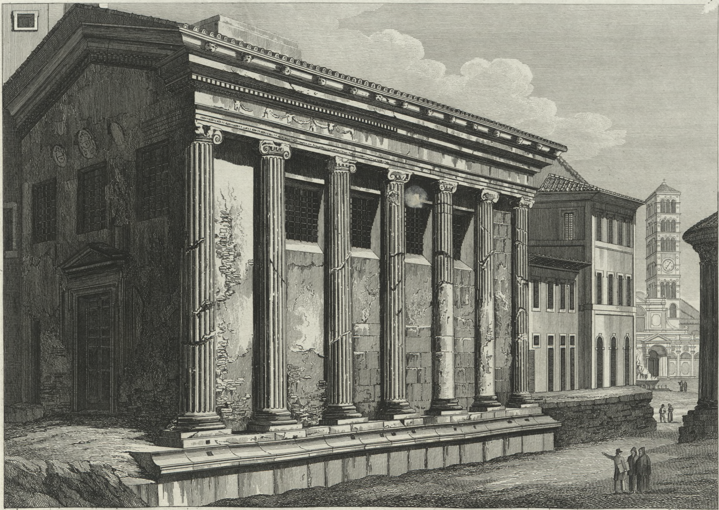
Tempio della Fortuna Virile in oggi Chiesa di S. Maria Egiziaca.