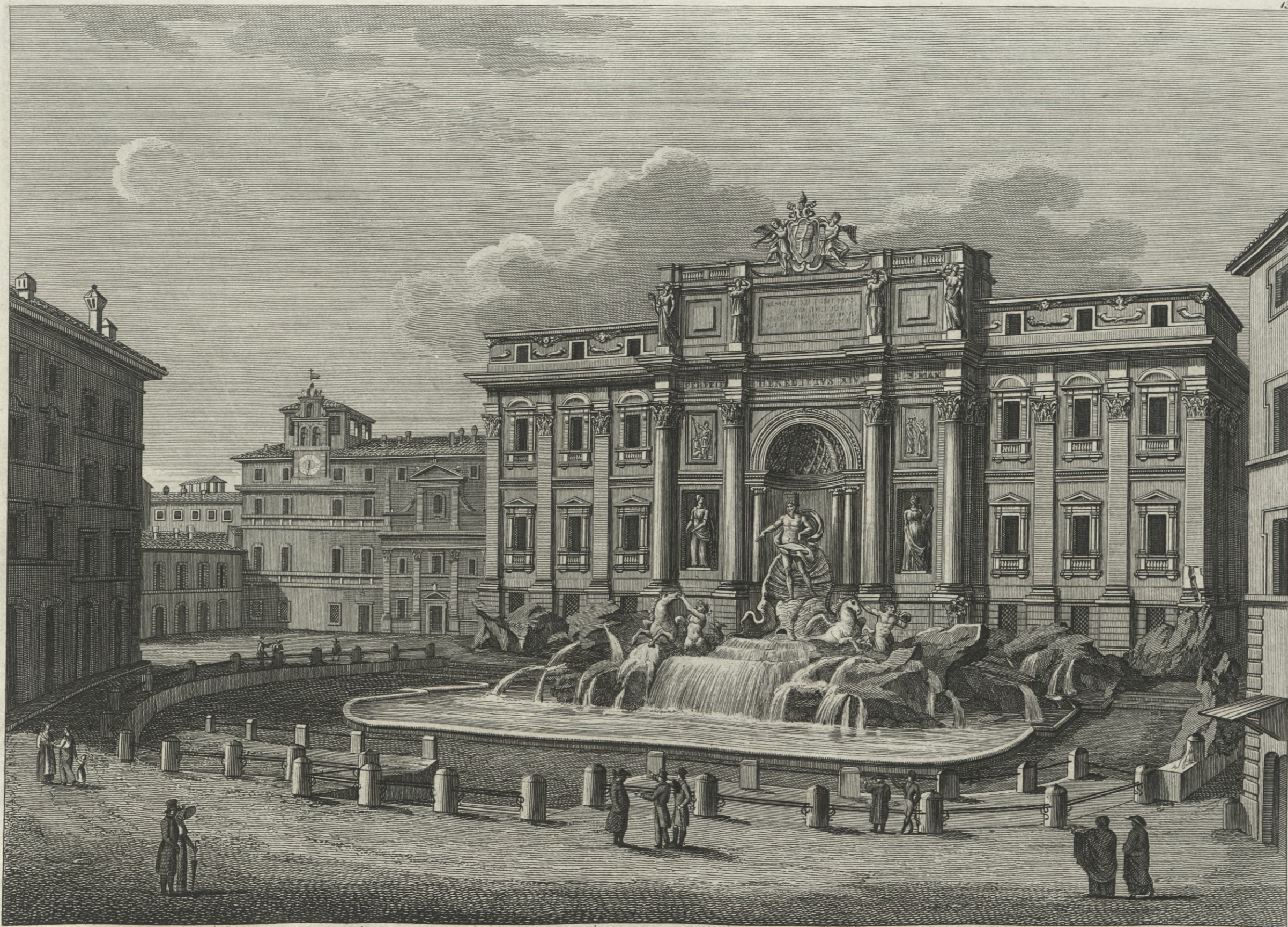
Veduta della Fontana dell'acqua Vergine d. di Trevi fatta condottare da M. Agrippa, } Vue de la Fontaine de l'Eau Vierge dite de Trevi que Agrippa fit emmener così chiamata da una Vergine che mostrò le vene ad alcuni Soldati assetati. } son nom lui vient d'une Vierge qui la trouva, et en montra la source a des Soldats alté

In Roma presso G. Antonelli in Piazza di Sciarra N. 225.