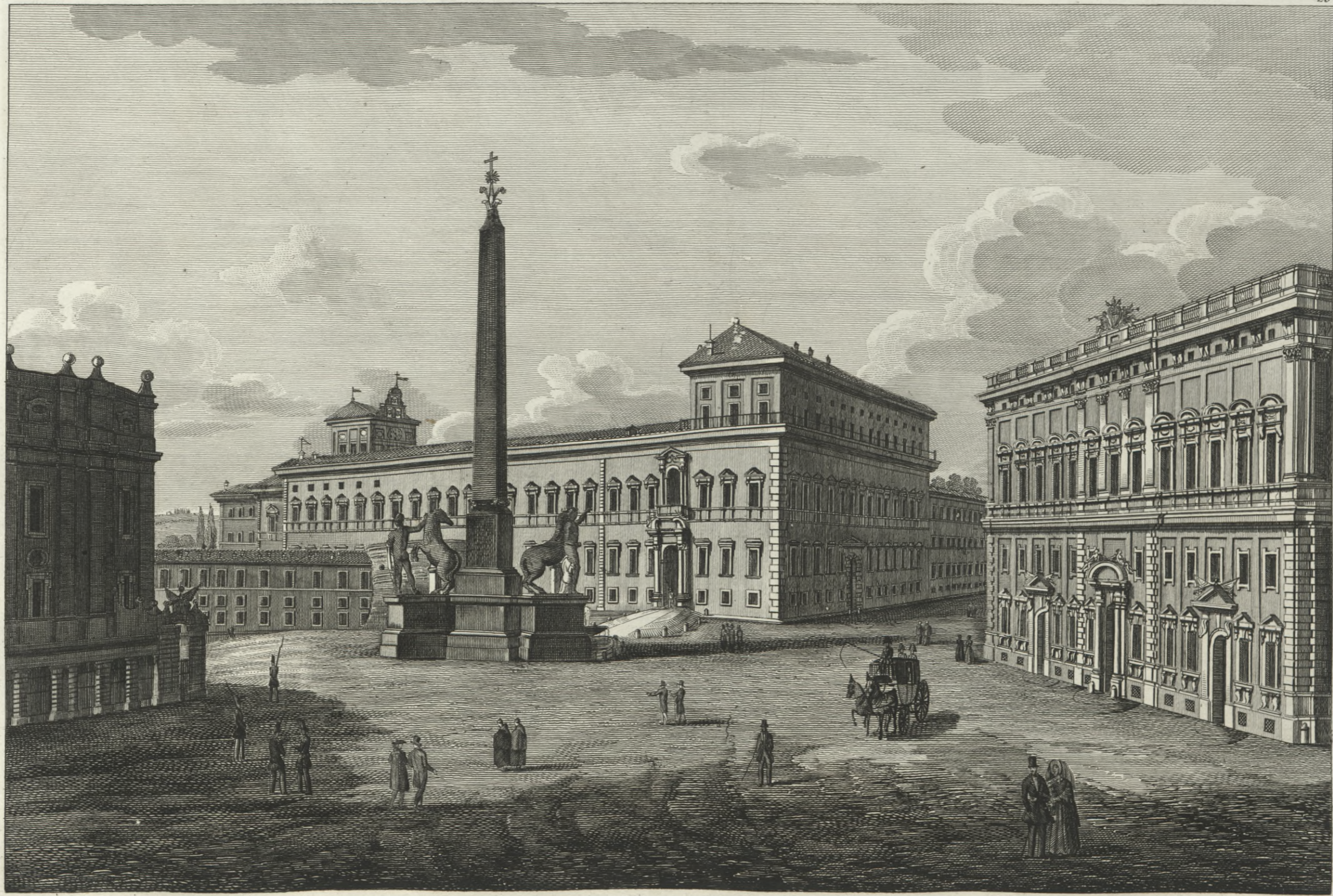
Piazza del Quirinale.