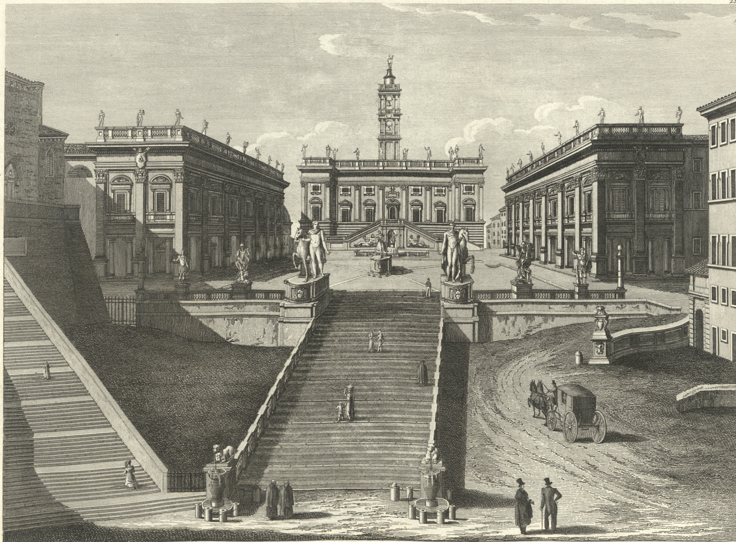
Veduta del Campidoglio sul Monte Capitolino sopra del quale salvavano i Vittoriosi Romani, ed appendevano nei Tempj le nemiche spoglie in ringraziamento agli Dei. } Vue du Capitole sur le Mont Capitolin sur ce Mont les Romains montaient en triomphe et où ils appendoient dans les Temples les dépouilles des ennemis en remerciant les Dieux.

In Roma presso G. Antonelli in Piazza di S. Maria N. 237.