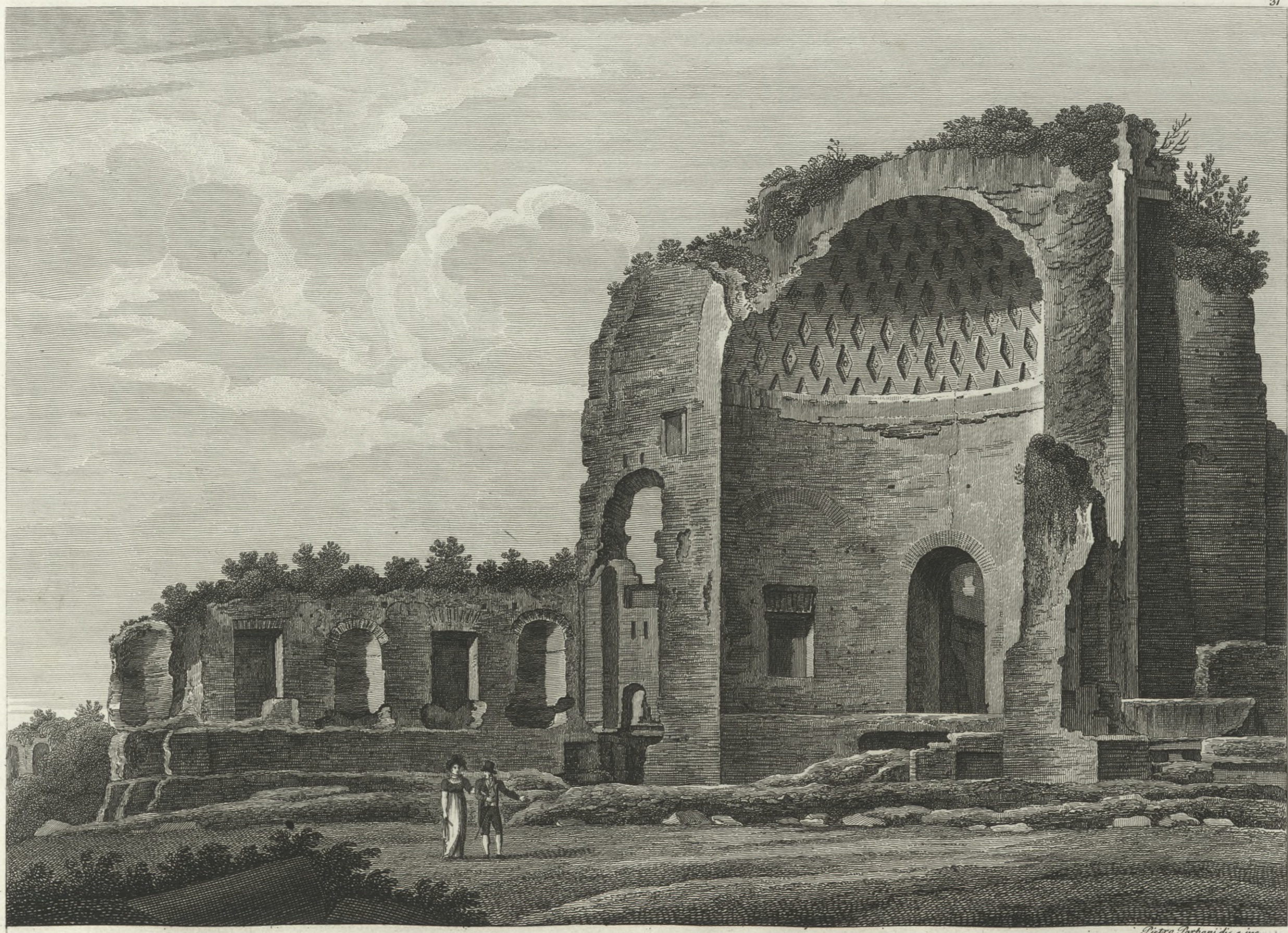
Rovine del Tempio di Venere, e Roma volgarmente detto del Sole, e della Luna.