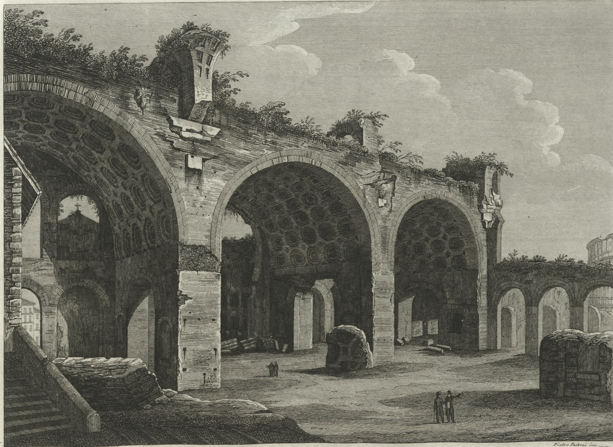
Veduta degli avanzi del Tempio della Pace eretto dall'Imperadore Flavio Vespasiano sopra le rovine della Casa Aurea di Nerone.