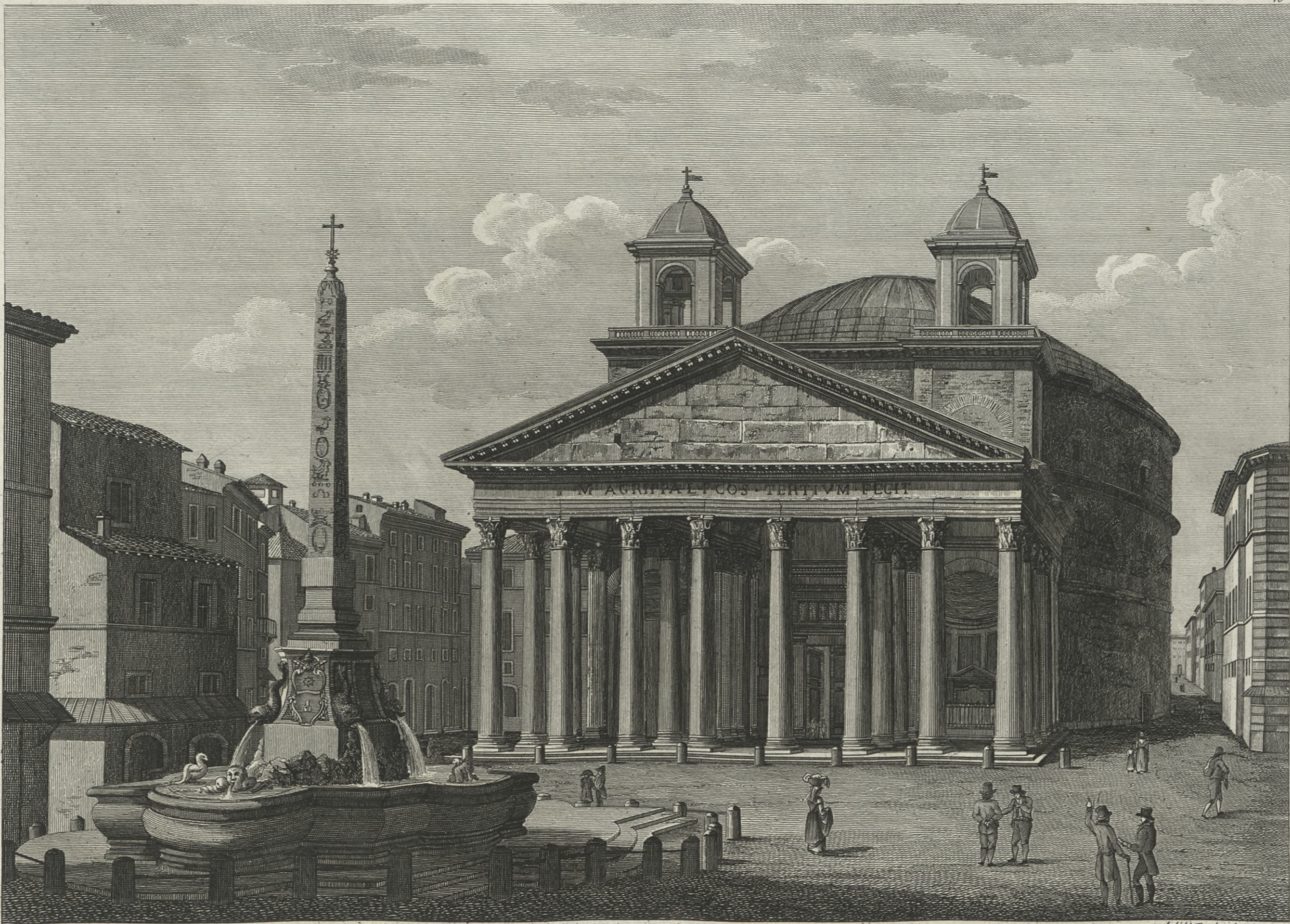
Veduta del Pantcon d' Agrippa in oggi Chiesa di S. Maria ad Martyres, comunemente detta la Rotonda.